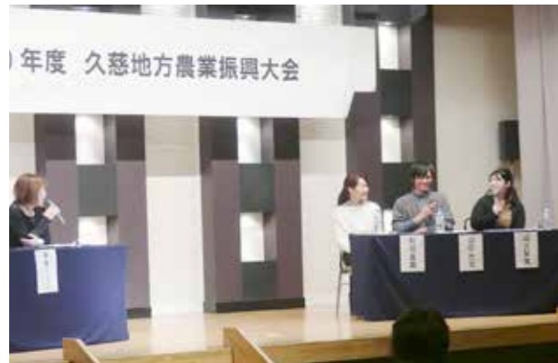
久慈地方農業振興大会で仲間と一緒に発表