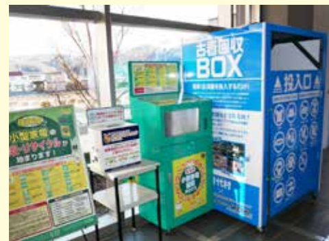
保健センター渡り廊下に設置されている回収ボックス

村では、使用済小型家電回収ボックス、古着回収ボックスを役場エントランスホール左の保健センターへの渡り廊下に設置しています。資源の有効活用やごみ減量のため、ぜひご利用ください。