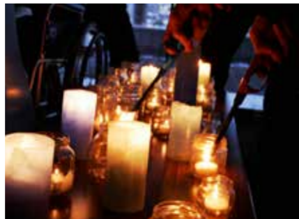
キャンドルナイトで祈りを捧げました

東日本大震災から8年を迎えた3月11日、震災の記憶を風化させず、防災意識を高めることを目的に「防災を考える日イベント」が役場3階大会議室で行われました。