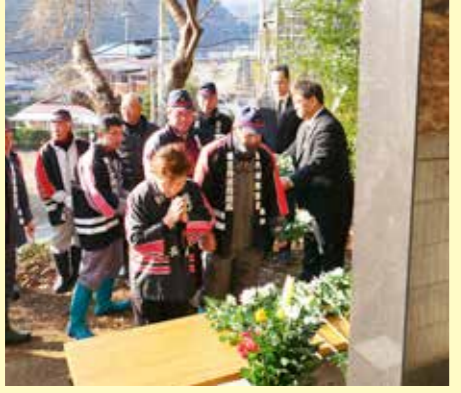
菊の花を手向け、犠牲者を悼みました

3月3日には、明治と昭和の大津波で犠牲になられた人々を追悼する津波記念碑慰霊祭が、中央区と太田名部のそれぞれの津波記念塔で行われました。