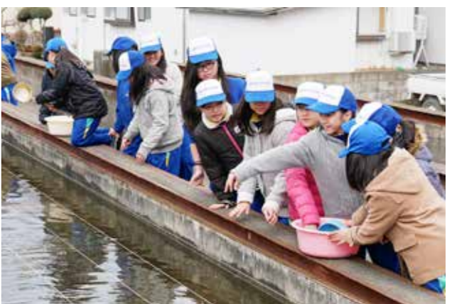
餌をまく5年生の児童たち

水槽に餌をまくと稚魚が一斉に動き出し、素早く餌に群がる様子を見た児童たちは「来た来た」と歓声を上げながら、水槽の中を覗き込んで観察したり、たくさんの稚魚に届けようと遠くまで餌を投げたりしていました。