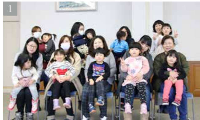
3歳児虫歯ゼロを達成した子供たちと保護者の皆さん

平成30年度第3回保健推進員会議が2月15日、村保健センターで開催され、3歳児健診で虫歯がゼロだった子ども10人と70歳で自分の歯が20本以上ある「7020」達成者3人、80歳以上で自分の歯が20本以上ある「8020」達成者3人が表彰されました。 村歯科診療所の藤原秀世所長は「受賞されたみなさんの日頃の努力の成果だと思います。食の偏りは虫歯や高血圧などにつながり、健康のためには食生活を見直すことが非常に重要です。今回受賞した3歳児は7020を、7020受賞者は8020を、そして8020受賞者は9020を目標にしていきたい」と受賞者の皆さんをたたえました。 そのほか会議では、保健推進員勤続15年で岩手県保健推進員等代表者協議会表彰を受けた3人と勤続10年で村感