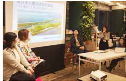
東京で行われたトークセッションの様子

普代参拾伍番館の窓から見える景色も変わり始め、春の訪れが感じられます。この春は山菜を探して歩くことが目標です。山菜のおいしい調理法をご存知の方いらっしゃいますよね。ぜひ教えてください。