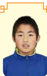
● 青少年読書感想文久慈地区コンクール 小学中低学年の部入選作

年中無休! 8:00 から 20:00 まで 中央区 上神田精肉店 (☎35-2210)