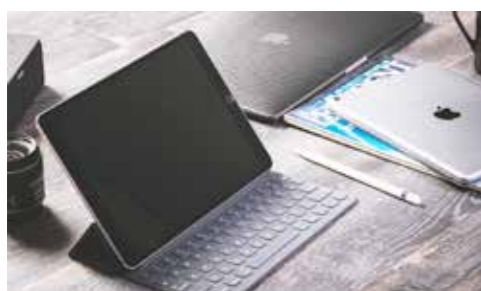
タブレットの活用にお悩みの方などお気軽にお越しください

する疑問を講師がわかりやすく解説します。講習会には事前の申し込みが必要です。質問などは申込時にお知らせください。