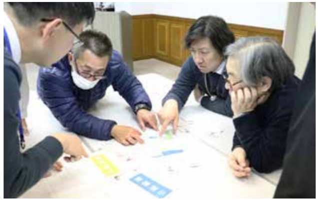
班内で協力しながら災害時の対処を考えました

東日本大震災から8年を迎えた3月11日、震災の記憶を風化させず、防災意識を高めることを目的に「防災を考える日イベント」が役場3階大会議室で行われました。