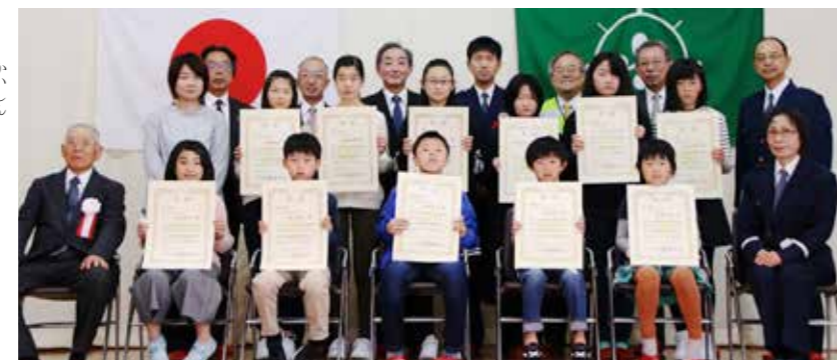
コンクール入賞者と関係者の皆さん

村交通安全ポスターコンクールの入賞者は次のとおりです。 ◇小学校低学年の部▽最優秀賞