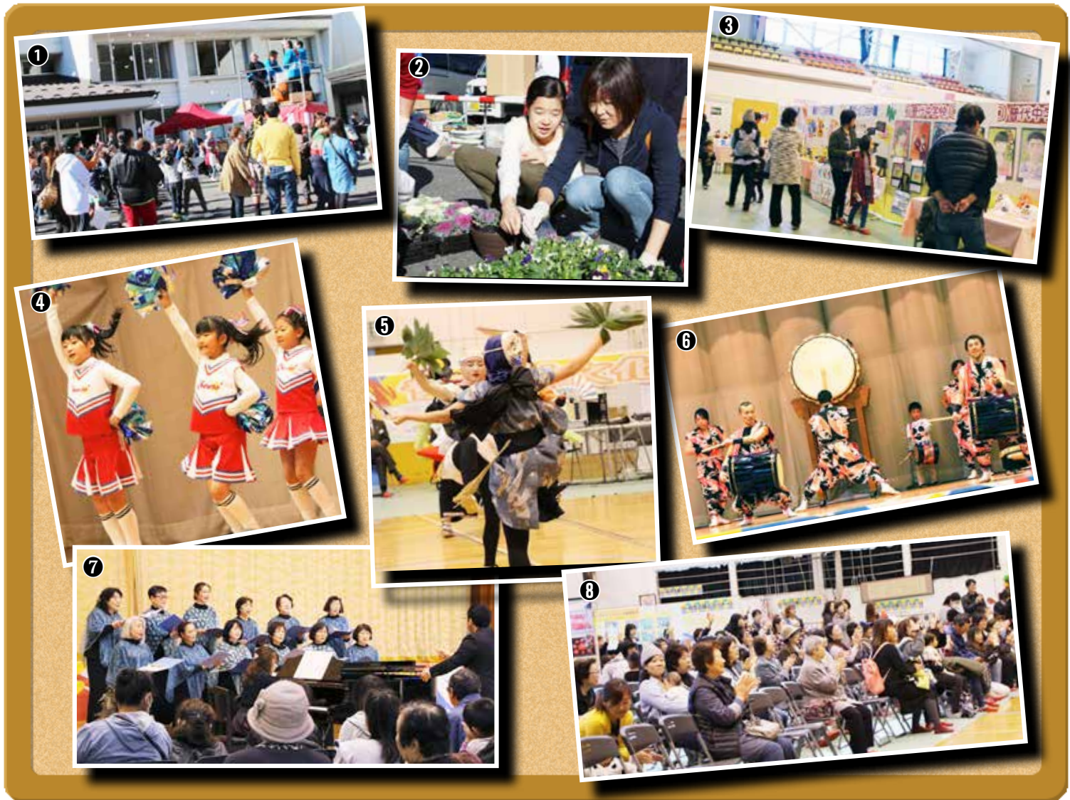
①「こっちこっち！」夢中になったお餅・お菓子まき②寄せ植え教室では参加者思い思いの作品を作りました③体育館内には丹精込めた作品がずらり④⑤⑥⑦各種団体が多様なステージ発表で盛り上げました⑧次々と繰り広げられるステージ発表に拍手喝采