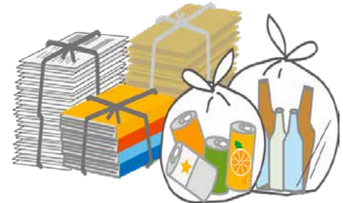
上のイラストは資源ごみです。可燃・不燃に混ぜていませんか？

◆就業・定着に関する支援として村外で開催される座学研修や漁業研修参加にかかる経費(旅費、資料代等) ▼待遇：①家賃が月額3万円を超える場合、その半額(上限2万5千円)を支援※ふるさと定住促進助成金など家賃補助の対象となる方は除く 詳しくは役場建設水産課(☎35-2116)まで。