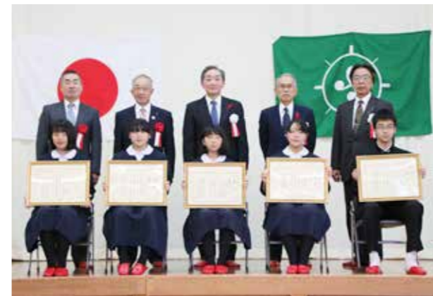
税の作文で表彰された皆さん（前列）

平成30年度中学生の「税」についての作文表彰式が11月3日、自然休養村管理センターで行われ、関係者ら約40人が出席する中、校内審査を通過した入賞者5人が表彰されました。