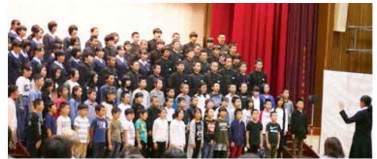
161人の厚みのある歌声を体育館に響かせました

発表では小中合同の合唱や吹奏楽部の演奏、中学校七頭舞同好会による七頭舞などが披露。劇では小学校低学年、中学年、高学年、中学校の4つに分かれ、迫真の演技を見せました。また、合唱発表会では中学校の3つの学年がそれぞれ美しい歌声を披露。練習の成果を存分に発揮し、観客から大きな拍手が