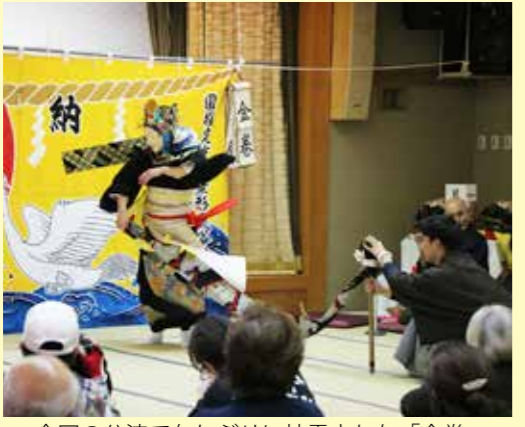
今回の公演で久しぶりに披露された「金巻」

国民宿舎くろさき荘で10月21日、今年度2回目となる鶴鳥神楽定期公演「神楽の日 青の国編」が行われました。