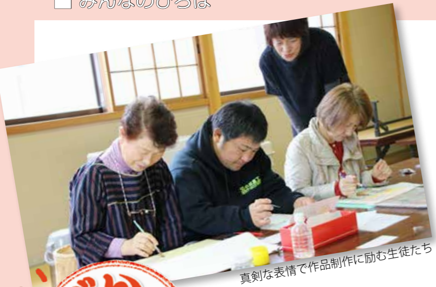
真剣な表情で作品制作に励む生徒たち