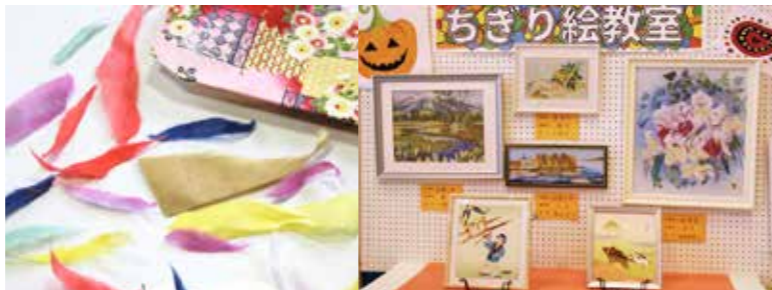
色とりどりの和紙をちぎると独特の風合いが出ます 今年の文化祭でも多数の美しいちぎり絵を展示

成感がやみつきになり、やめられないと言います。村文化祭への出展を終え、好評を博したちぎり絵教室では現在、来年東京で行われる全国習作展への出展を目標に作品を制作しています。生徒の募集も随時行っており、体験からでも大歓迎。年齢に関係なく、いつでも誰でも手軽に楽しむことができるちぎり絵教室で、新しい趣味を始めませんか。