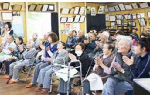
演奏後、参加者は盛んに拍手を送りました

久慈東高校吹奏楽部によるくろさき小規模多機能ホーム慰問のミニコンサートが10月6日、黒崎公民館で行われ、施設利用者や黒崎地区の住民など約60人が集まりました。 来場者には生徒手作りのパンフレットが配布。集まった皆さんは、高校生の奏でる演歌や歌謡曲などなじみのあ