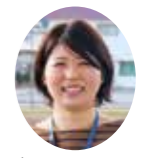
今月は山火隊員です