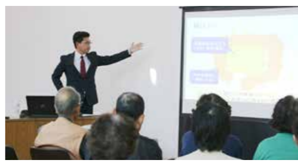
参加者は腸の働きについて学びを深めました

普代村自然休養村管理センターで10月25日、第1回地域包括ケアシステム住民セミナーが行われ、30人の村民が参加しました。 「おなか元気に」から元気に腸の働きについて学びを深めました