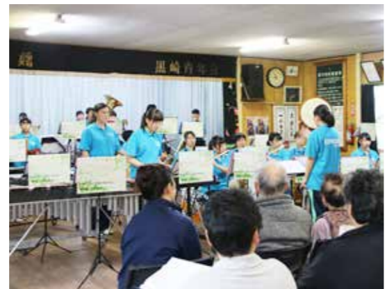
演歌や歌謡曲などで盛り上げた久慈東高校の皆さん

久慈東高校吹奏楽部によるくろさき小規模多機能ホーム慰問のミニコンサートが10月6日、黒崎公民館で行われ、施設利用者や黒崎地区の住民など約60人が集まりました。 来場者には生徒手作りのパンフレットが配布。集まった皆さんは、高校生の奏でる演歌や歌謡曲などなじみのあ