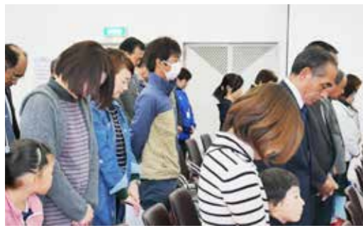
黙とうで交通事故の犠牲者へ祈りを捧げる参加者