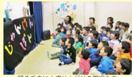
踊る毛虫に大盛り上りの園児たち

ふれあい交流センターで5月11日、としよしまつりが開催され、はまゆり子ども園の園児など59人が軽米町の「人形劇サークルじゃんけんぼん」による人形劇や絵本の読み聞かせを楽しみました。