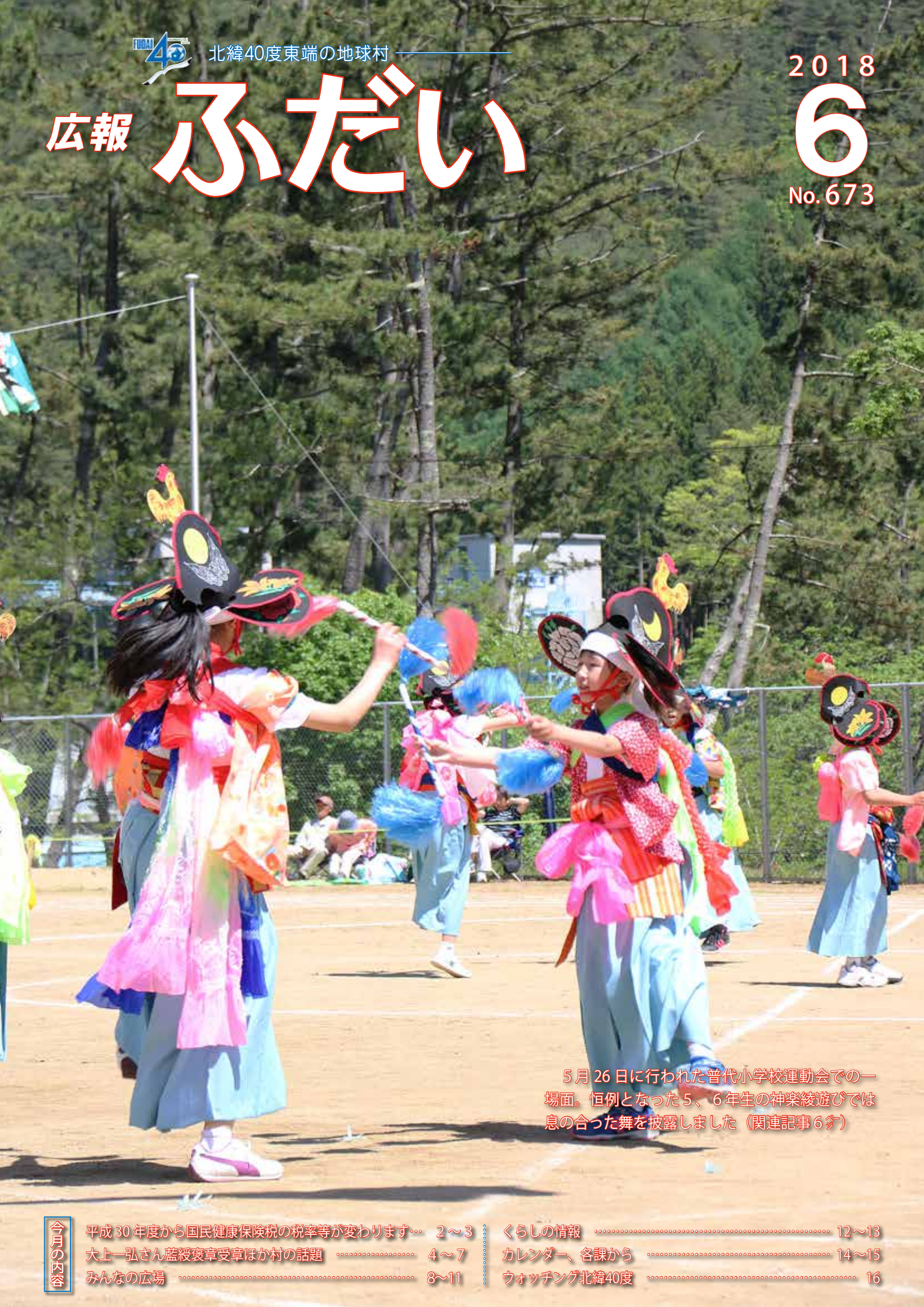
5月26日に行われた普代小学校運動会での一場面。恒例となった5、6年生の神楽綾遊びでは息の合った舞を披露しました（関連記事6頁）