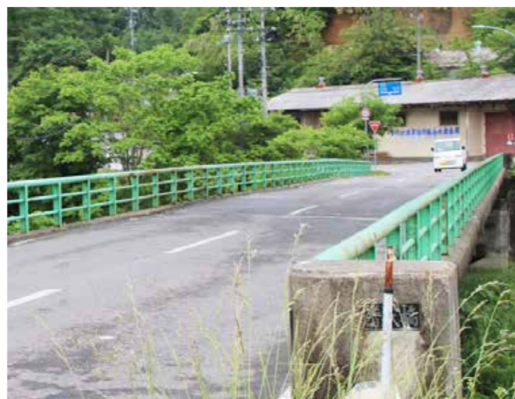
補修工事により10月から交通止めとなる普代橋

村内の橋梁は、多くが高度経済成長期から80年代に作られ、全体的に橋の老朽化が進んでいます。橋梁の健全性を保つため、村では「普代村橋梁長寿命化修繕計画」により計画的な維持管理をし、予防的に工事を行うことで道路交通の安全性を高めます。 8月から普代漁協付近にある普代橋の補修・補強工事が実施されます。主な補修内容は塗替え塗装、桁連結、支承取替、防護柵取替、伸縮装置取替、防錆処理です。