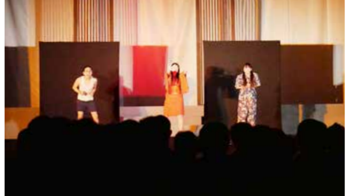
児童生徒らが学びを深めた演劇「約束～大切なもの～」

文化芸術に触れることで豊かな情 作りだしてきた演技集団「朗」による演劇「約束～大切なもの～」 操を養い、感性を磨くことを目的とした青少年劇場が5月29日、普代中学校の体育館で開催され、普代小3年生から普代中3年生までの児童生徒などが演劇を鑑賞しました。 同劇場では、人と人との絆をテーマとした作品を多く上演している。