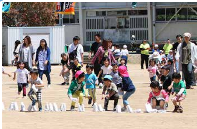
現況届の提出を忘れずに(普代小学校運動会から)

▼問い合わせ先: 役場住民福祉課(☎35-21113、内線133) ▼届出期間:平成30年6月1日(金)から29日(金) ▼届出場所:役場住民福祉課窓口 ▼問い合わせ先:役場住民福祉課(☎35-21113、内線133)