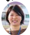
今月は 山火隊員です