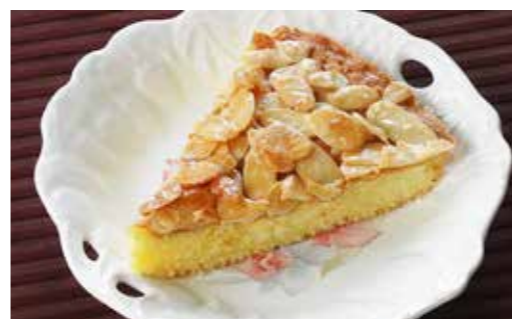
ケーキは数量限定です

6月に入り、梅雨時期になりましたね。「ヤマセ」が最近発生していますが、教科書で習う程度の知識だった私にはすごく珍しく、昨年初めて見たときはとても感動しました。三陸鉄道に乗る観光客の方とお話しした際も「車窓からの景色は見えないけど、ヤマセを体験できるのはとても貴重だからうれしい」と喜んでいました。ただ、車を運転するときは視界がほとんどなくとても怖いですね。お互いに気を付けましょう。