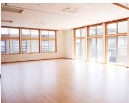
大きな窓のある広々としたホール