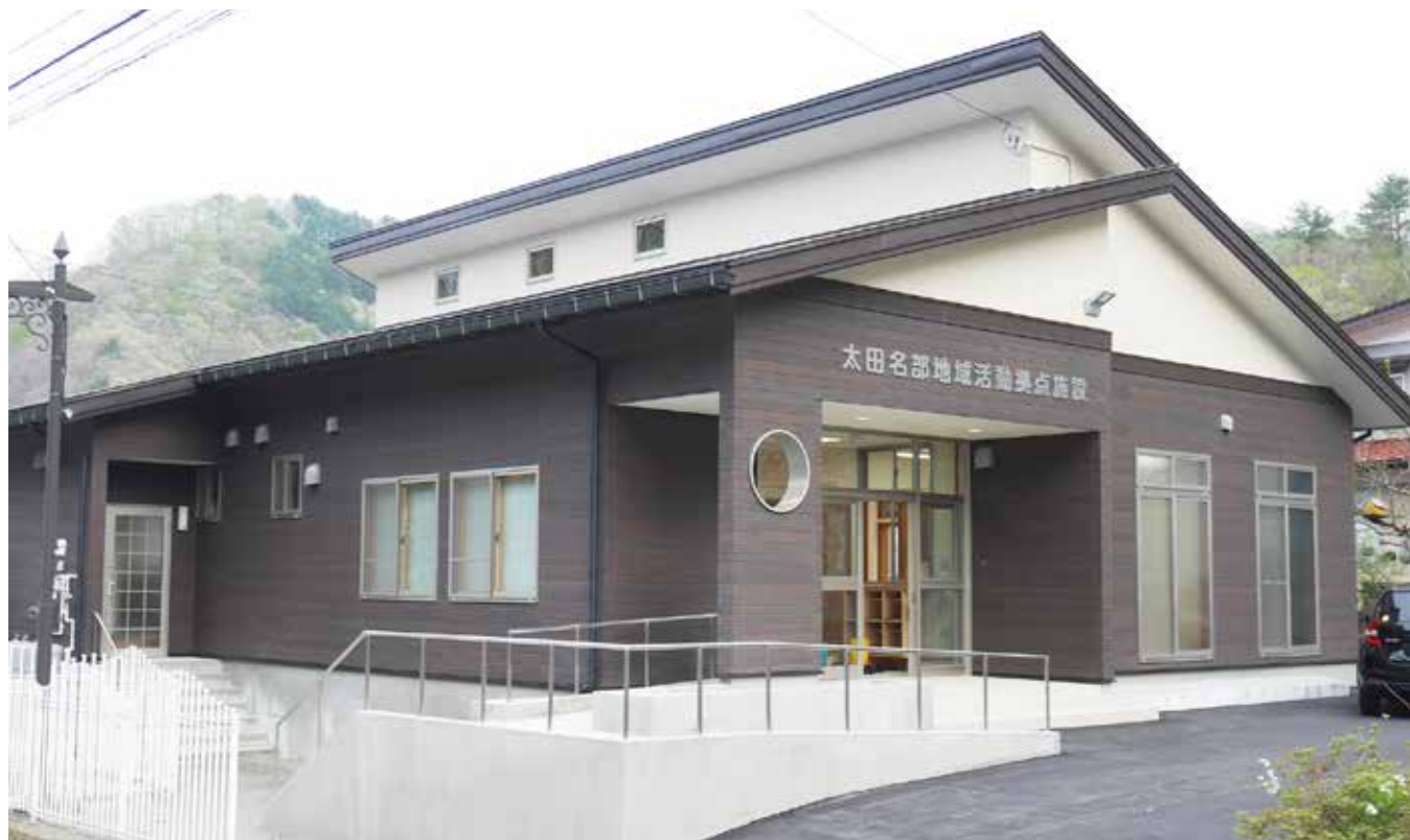
旧太田名部児童館跡地に完成した太田名部地域活動拠点施設