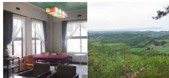
現在の普代参拾伍番館の内装

子どもたちの健やかな成長を願う金太郎さん 年中無休！ 8:00 から 20:00 まで 中央区 上神田精肉店 (☎35-2210)