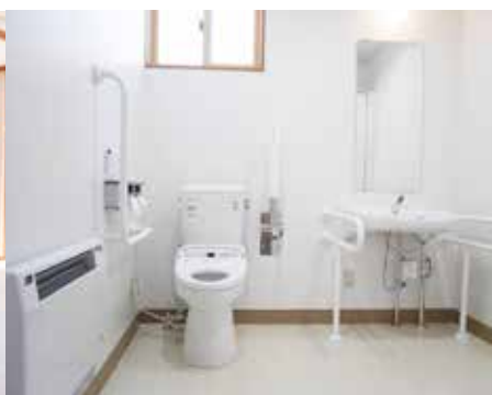
手すり付きのトイレは高齢者も安心