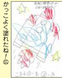
かっこよく塗れたね！ 大坪楓くん (久慈市・2歳)

広報クイズ 次の2つの問題を読み、3つの答えの中から正しいものを選び、はがきで応募してください。①は6ページから、②は