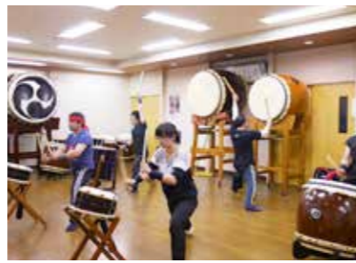
▲音色の違う大小さまざまな太鼓での演奏は迫力満点！