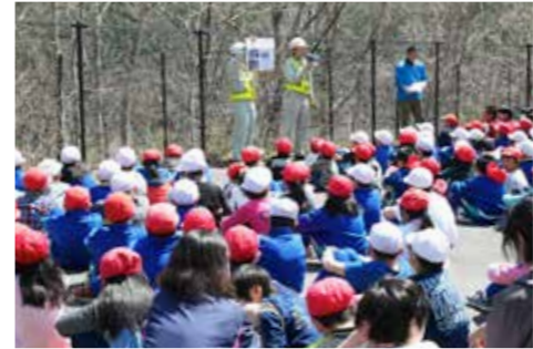
階段を上りきると広場が整備されています

報が発令」という想定で実施されました。発災直後、児童らは机の下に隠れるなどして身の安全を確保。揺れがおさまると、それぞれの校内で大津波警報発令の放送が流れ、教職員の指示に従い一時避難場所となる普代道路脇の広場へ避難を開始しました。同避難場所は高さ約16メートルにあり、児童生徒らは息を切らしながら108段の避難階段を駆け上がりました。