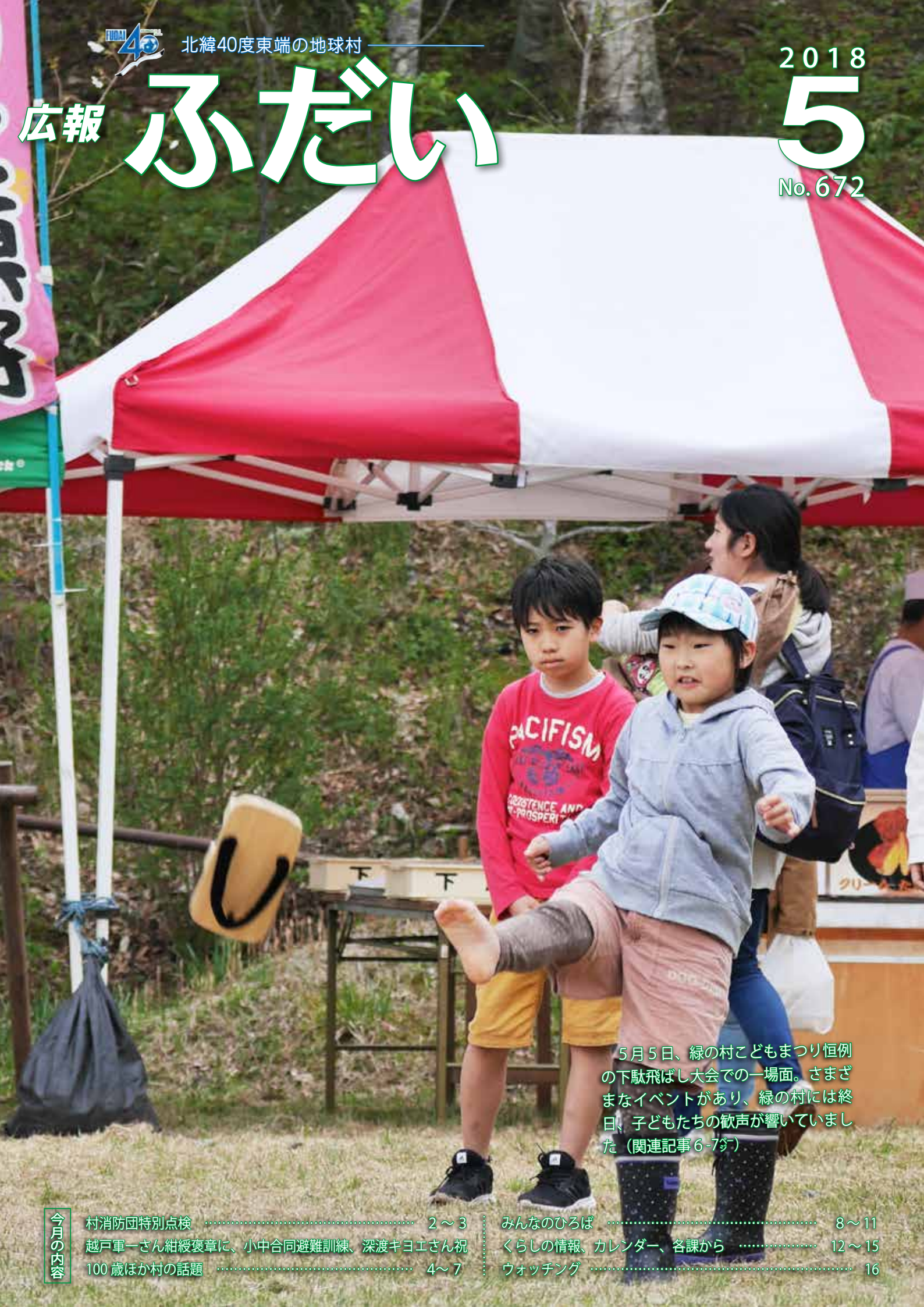
5月5日、緑の村子どもまつり恒例の下駄飛ばし大会での一場面。さまざまなイベントがあり、緑の村には終日、子どもたちの歓声が響いていました（関連記事6-7頁）