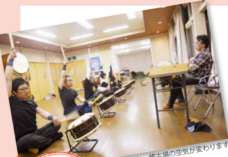
稽古が始まると、稽古場の空気が変わります