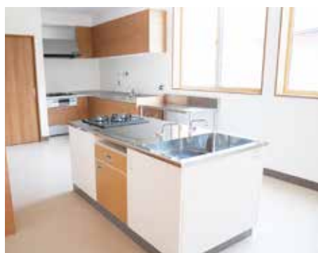
調理場も完備されています