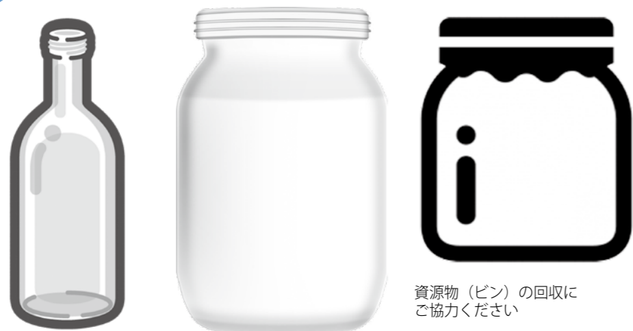
資源物（ビン）の回収にご協力ください

平成30年5月から資源ごみ（ビン類）の回収対象が拡がります。これまでは家庭から排出される空きビンは、飲料用のみを対象としていました