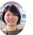
今月はやまび山火隊員です

春ですね。暖かくなってきた今日この頃、いかがお過ごしでしょうか。 私は休日に鵜鳥神社の本殿まで登ってきました。ほどよい運動になり、本殿後ろのお岬さまから美しい景色を眺めるころにはもやもやしていた気持ちもすっかり晴れ、また新たな気持ちで頑張ろうと思えました。いつでも行けると