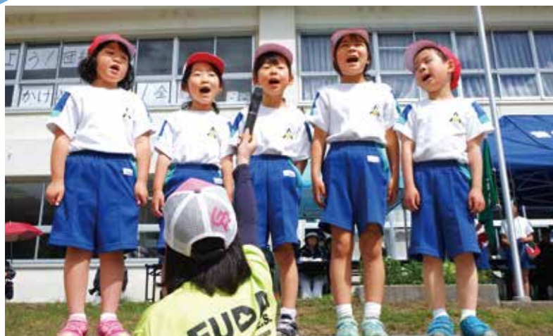
現況届の提出をお忘れなく（普代小運動会から）

▼届出期間：平成29年6月1日（木）から30日（金） ▼届出場所：役場住民福祉課 ▼問い合わせ先：役場住民福祉課 内線1350