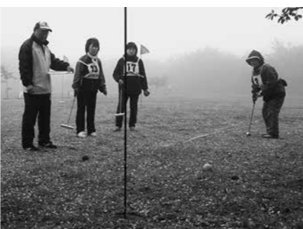
27ホールをはつらつとプレーしました

6月25日には村長杯グラウンドゴルフ大会がB&G多目的グラウンドで行われます。お申し込みは村教育委員会事務局（☎3512711）まで。同大会の団体、個人の部での優勝者は次のとおりです。