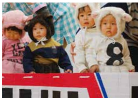
子ども園・子育て支援センター