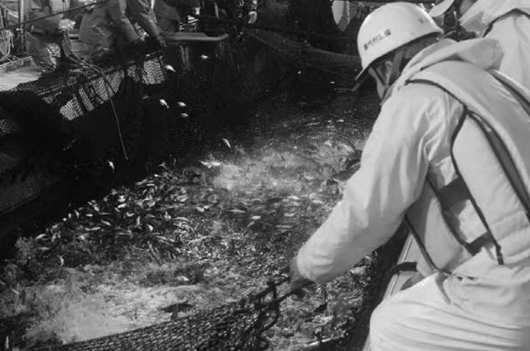
自営定置網の網越しの様子