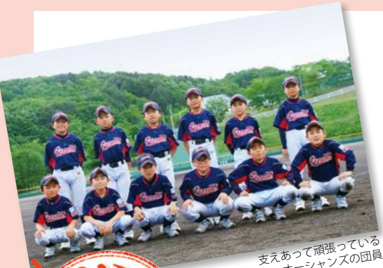
支えあって頑張っている オーシャンズの団員