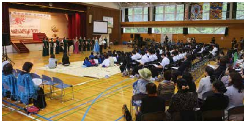
会場となった普代中学校には多くの方が来場しました