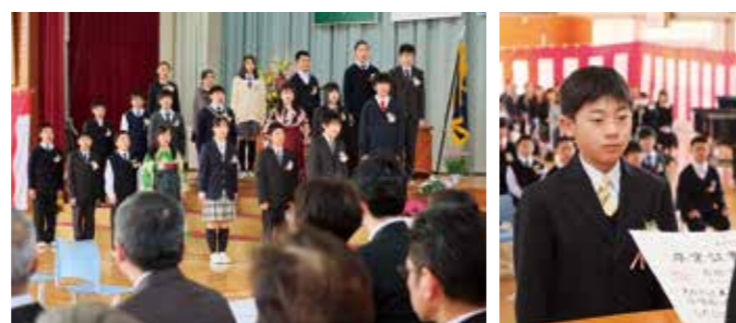
一貫教育は中1ギャップの解消などに効果的です（平成28年度普代小学校卒業式から）

らないことを減らして学力向上につなげています。 行事でも小中学校の垣根を超え、ごみ拾いや合同学年朝会、朝のあいさつ運動などで一緒に活動しています。合同実施により、中学生は頼もしい態度、小学生は中1ギャップの解消など、お互いに学びあい、成長できているといえます。 そしてこの取り組みを例に小学1・2年生とはまゆり子ども園との交流も始まり、村の子どもたちの育ちあいに繋がっています。