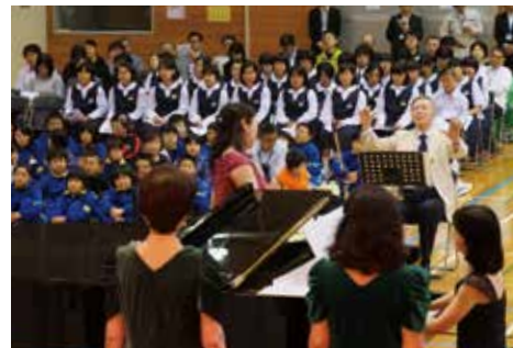
美しい歌声に聞き入る児童ら