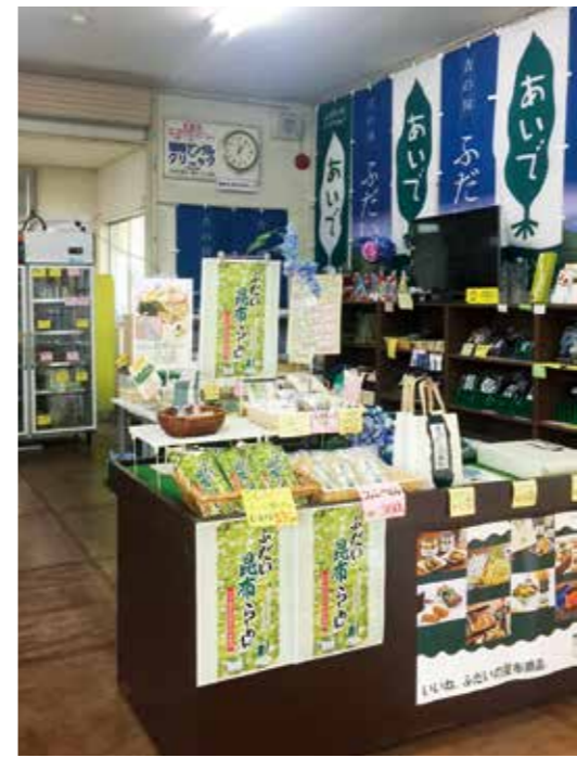
駅の待合室だった場所にはアンテナショップで取り扱っていた商品が並びます

広報クイズ 次の2つの問題を読み、3つの答えの中から正しいものを選び、はがきで応募してください。①は3択から、②は 6択からの出題です。 ①村が目指す15歳の子どもの像は「育ちあい」「助けあい」あと一つは? A わきあいあい B 認めあい C 励ましあい