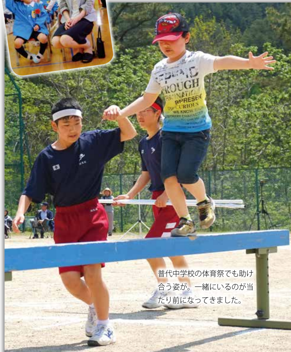
普代中学校の体育祭でも助け合う姿が。一緒にいるのが当たり前になってきました。

「合同実施は減少対応」ではなくお互いに学び合える成長の場の醸成なのではないでしょうか？角掛校長は「将来的には、体育祭の合同実施という可能性も出てくると思います。合同実施に至った際はこれまで以上に、地域の皆さまの協力をいただき、地域の方で子どもたちを育てていただきたいです」と構想を描きます。