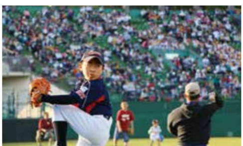
5月17日の楽天VS日本ハム戦の前には大観衆が見守る中、県営球場でキャッチボールを行いました

当時の33人の団員で組織していた普代オーシャンズ。統合効果はすくなく、創部1年目で東北大会に出場したり、各大会の予選会で優勝したりと輝かしい成績を残してきましたが、現在の団員数は12人と半分以下になっています。