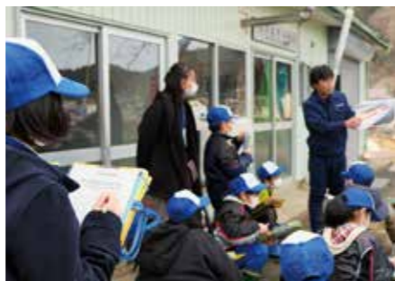
地域の力・地域の教育力