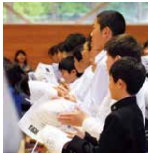
児童生徒も一緒に合唱

平成27年12月には芸術文化の振興に多大な貢献をしたとして「平成27年度文化庁長官賞」を受賞。現在もサカモト・ミュージック・スクールの校長として後進の指導育成に情熱を注いでいます。