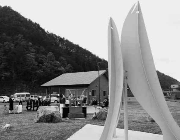
鮭の豊漁に願い込め、供養塔が再建されました

サケを模した供養塔は鉄製で、高さは最大で約4メートル。定置網漁が盛んな村の発展を祈