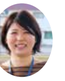
今月は山火隊員です

勤務先が普代駅に変わってからはや2カ月。徐々に仕事にも慣れてきました。今回は最近の普代駅の様子を紹介したいと思います。 まず、かつて駅の待合室だった場所にアンテナショップの商品をもってきました。ここでは、普代のおいしい商品や素敵な工芸品はもちろんのこと、村内から新鮮な野菜が日々入荷しています。ほうれん草、レタス、ふき、うるいなどなど…。何が入荷するかはその日によって違います。 また、普代駅ではソフトクリームの販売が始まりました。こんぶ、バナナ、ミックスの3種類があり、ワッフルコーンかカップかお選びいただけます。スタッフもソフトクリームを作る腕があがっています。ちなみに、待合室はアンテナショップと一緒にありますので、暑い日は涼みに来てゆっくりしていただきたいと思います。