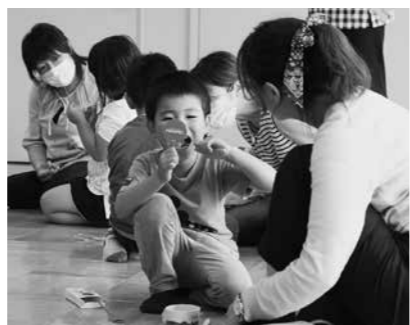
手鏡を使い、染まった箇所を確認します