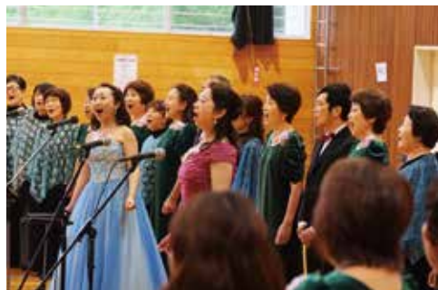
美しい歌声が会場に響きます