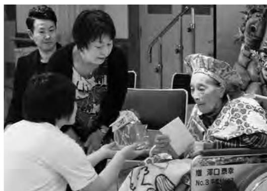
うねとり荘の職員からプレゼントが贈呈