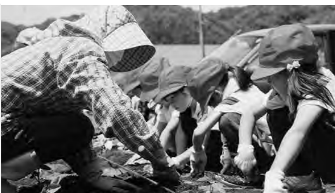
昨年5月の普代小学校1,2年生による苗植え体験

※農振除外とは？ 農業振興地域（農業の振興を図るべき地域）内には、優良な農地の保全のため農業以外での利用が制限される「農用地区域」があります。農用地区域内の農地を農地以外に使用するとき、農地転用の許可申請前に農用地区域からの除外手続きが必要となります。このことを一般的に「農振除外」といいます。