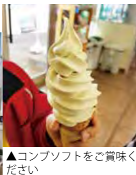
▲コンソフトをご賞味ください