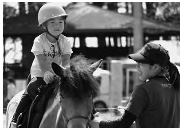
多くの子どもたちの人気を集めたポニーの乗馬体験

村のゴールデンウィーク恒例行事となった「緑の村子どもまつり（同実行委主催）」が5月5日、鳥居地区の緑の村で開かれました。当日の天気は快晴。会場には空気で膨らんだ大型滑り台やポニーの乗馬体験広場などが設置され、たほか、餅つき体験や丸太切り競争などイベントも盛りだくさんで、多くの子どもたちの歓声が響いていました。子どもまつり恒例となった