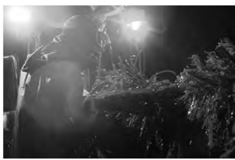
太平洋の外洋近くで立派に成長した養殖ワカメ

また、今年はしけ休みなどの影響で取り止めの回数が多く、例年であれば3月中旬〜4月上旬の間でワカメを採り終えるといいますが、4月下旬までずれ込む漁家が多く、漁家の間では「こんなに遅れたのは初めてだあ」という声がかきこえてきました。