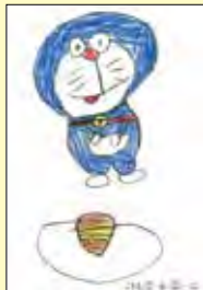
ドラえもん上手だね！