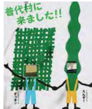
駅にはすつきい、えんぞーの顔出しパネルも設置しています

知人も例大祭の日に、鶴島から普代駅まで歩いてきましたが、神社でももちろん、街中や道中で会う人みんながニコニコあいさつをしてくれたり、一声かけてくれたりしてすごうれ