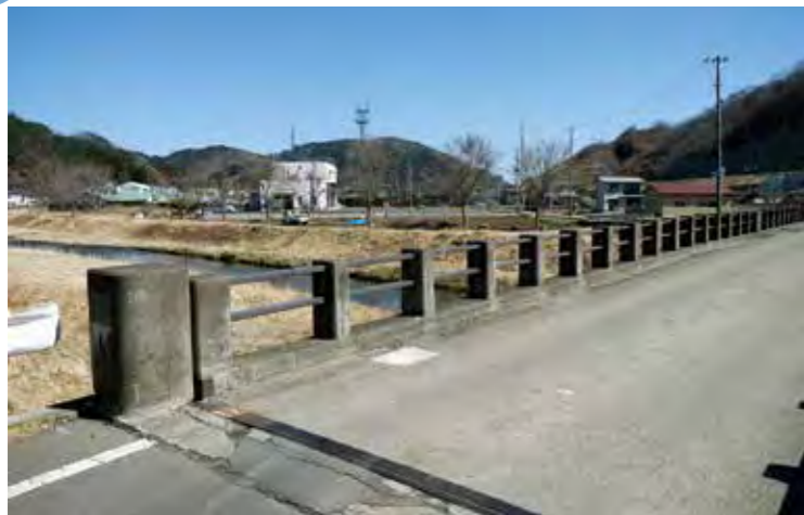
各道路や橋の長寿命化対策を施し、災害に強いインフラ整備を進めます

今年度、村では各道路や橋の長寿命化対策を施し、災害に強いインフラ整備を進めます。強いインフラ整備を進めていきます。その先駆けとして、線越事業の普代駅前1号線(沢山橋)の改良工事が本格着工しました。 沢山橋は4月の下旬から約1週間、基礎のくい打ち準備のため通行止めとなっており、