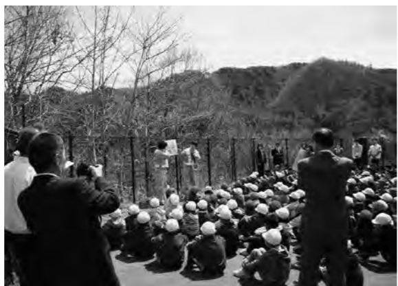
階段を上りきると広場が整備されています

に避難を開始。息を切らしながら真剣な表情で108段の避難階段を上りました。全員の避難は6分35秒で完了。角掛校長と三陸国道事務所の職員が避難時の注意点や津波への備えについて呼び掛けました。小中学校は海から約700mの距離にあり、東日本大震災の津波では周辺が浸水被害に遭いました。合同訓練は2014年から毎年4月に実施していて、今回で4回目の開