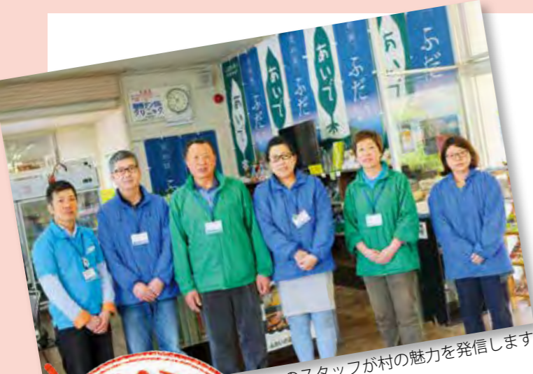
6人のスタッフが村の魅力を発信します