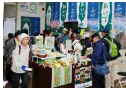
▼三鉄の利用客など多くのお客さまでにぎわいます