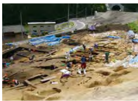
力持での遺跡調査

した。さらに、打ちがはまる今月末ごろから再度通行止めとなる予定です。また年末には橋げたを架ける工事を予定。その際も通行止めとなりますので、ご理解とご協力をお願いします。 沢山橋は有事の際の救急車両の通行が困難であることなどから交付金事業(復興枠)として昨年改良を決定。昨年の台風10号の影響などにより、年度内の完成に向け、工事が行われていきます。既存の沢山橋は取り壊さず、歩行者専用の橋として残す予定です。 このほか、今年度は台風10号で橋脚が流出した羅賀橋の架替え、普代漁協付近の普代橋の補修・補強に取り組みます。