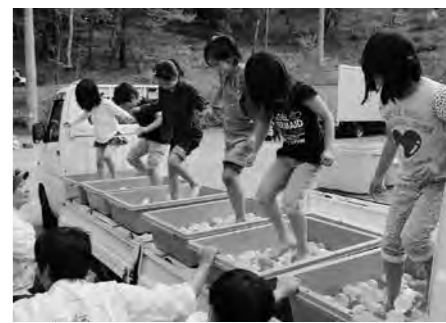
新イベントの「ぶどうまつり」

来年も参加します」と話していました。水風船を踏み潰し、出てきた水の量を競う新イベントの「ぶどうまつり」には39人の子どもが参加し、スタートの