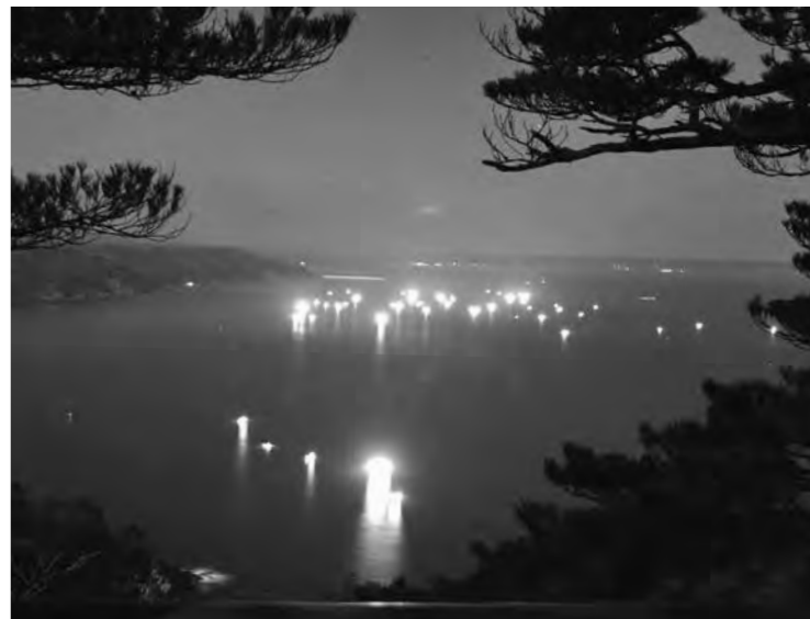
海に浮かぶいさり火がワカメ漁の合図です