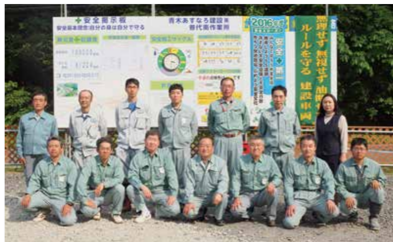
青木あすなろ建設株式会社の皆さん