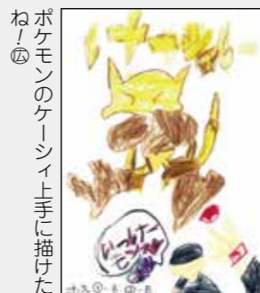
ポケモン のケーキ 上手に描いた ね！ ②