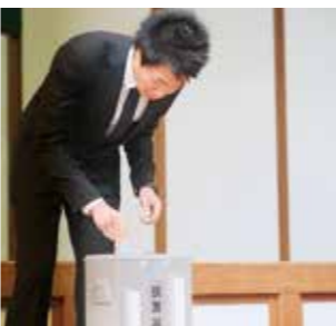
さまざまな制度などを有効活用しましょう

その他、不明な点などは村選挙管理委員会事務局（☎3512111内線323）までお問い合わせください。