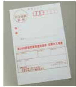
投票所にお出かけになる際は入場券をお持ちください

投票は、村選挙管理委員会から事前に郵送された入場券をお持ちになって、それぞれの投票所で受付を済ませて行きます。