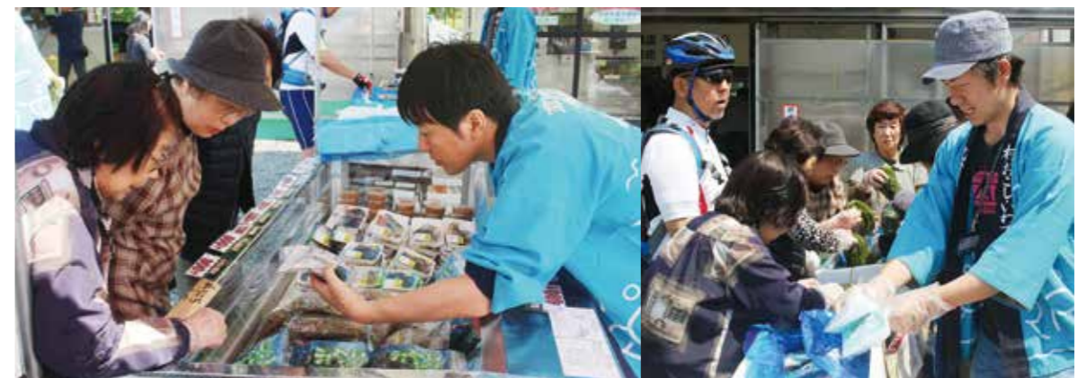
6月4、5日の両日、矢巾町産直石清水にて普代の物販をしてきました。この通り大盛況！