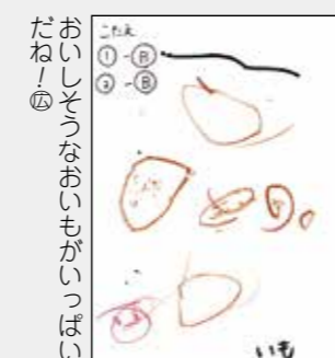
おいしそうなおもがらがっつ だね！ ②