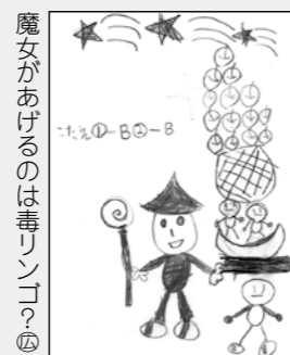
魔女があげるのは毒リンゴ？ ②