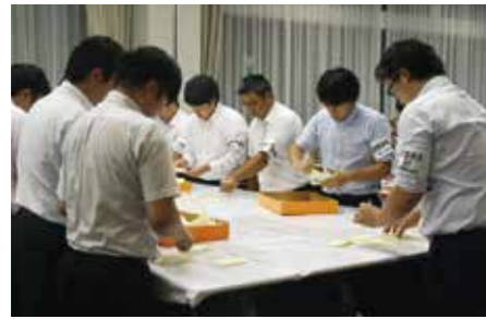
昨年9月に執行された、岩手県議会議員選挙の開票の様子

開票は同日午後8時から、役場3階大会議室で行う予定です。傍聴は自由ですのでお気軽にお越しください。