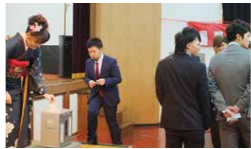
投票は難しくありません！清き一票を投じましょう（平成28年成人式での模擬投票）

選挙権を新たに得た18、19歳の人は投票への不安が大きいのではないのでしょうか？18、19歳は進学や就職でふるさとを離れる人が多く見られますが、そのような人も投票