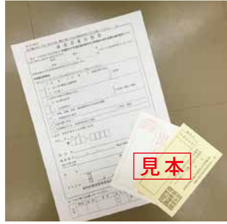
請求書兼宣誓書で投票用紙を請求してください

その他、期日前投票、不在者投票のお問い合わせは村選挙管理委員会（☎35-2111）まで。