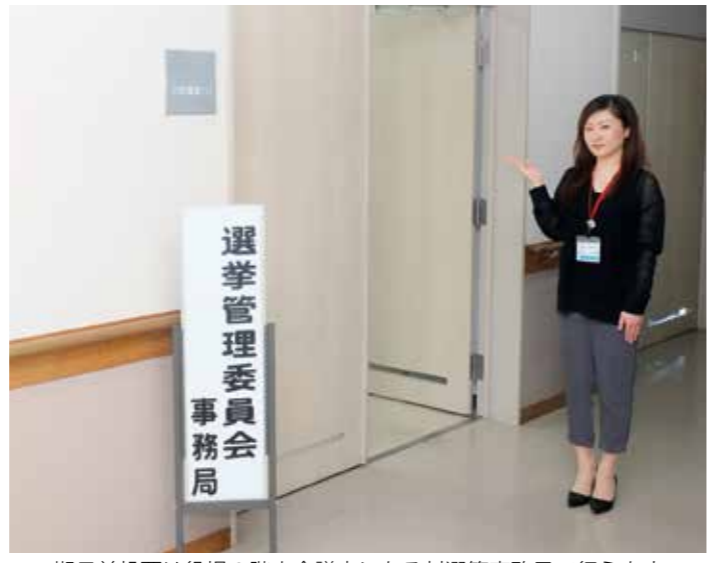
期日前投票は役場2階小会議室にある村選管事務局で行えます