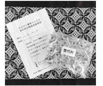
普代区間を踏破すると証明書とピンバッジが贈呈されます

同日からはトレイルのスタンプラリー制度が導入。この制度は普代区間のトレイルルートを歩き、上神田精肉店、スタンプを集めると協力金(800円)と引き換えに、区間達成証明書と村の記念ピンバッジが贈呈される制度です。 スタンプラリーの詳細などについては役場政策推進室(☎35-2111)または久慈広域観光協議会(☎0194-5315756)までお気軽にお問い合わせください。