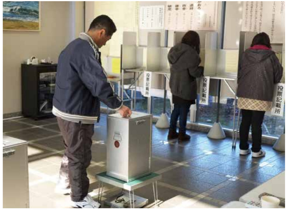
棄権することなく大切な一票を投じましょう！

第24回参議院議員通常選挙の投票が、7月10日、日曜日に行われます。投票所は村内10カ所で投票時間は、午前7時から午後6時までです。棄権することなく大切な一票を投じましょう。また今回の選挙から選挙権年齢の引き下げが適用され、18歳以上の人が投票できます。今月号では期日前投票制度や不在者投票制度、選挙権年齢の引き下げについて解説します。