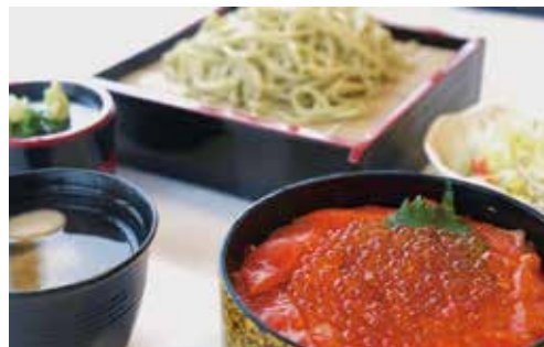
鮭親子丼は1日5食限定で販売しました