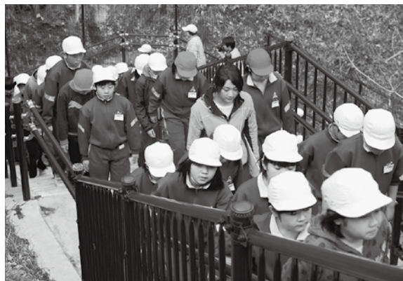
真剣な表情で避難訓練を行う児童

訓練は「午前11時に強い地震が発生。2分後に大津波警報が発令」という想定で実施。それぞれの校内で大津波警報が発令がされ、児童生徒は教職員の指示に従い、一斉にバイパス脇の広場に向かい避難を開始しました。