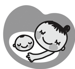
交通費助成をご活用ください

▼ 対象者 ：妊婦健診を受けている医療機関医師から、二戸病院などほかの医療機関でのお産が望ましいという説明を受け、二戸病院産婦人科での妊婦健診を受けた人。 ▼ 助成内容 ：出産後に母子健康手帳で通院回数を確認をし、交通費を助成します。