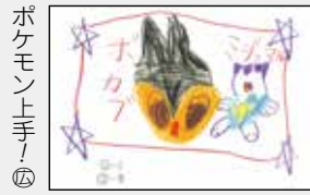
ポケモン上手! ④ 滝澤啓光くん (久慈市・5歳)