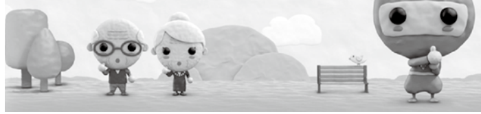
所得の少ない高齢者を支援します！内容をしっかり確認じゃ！