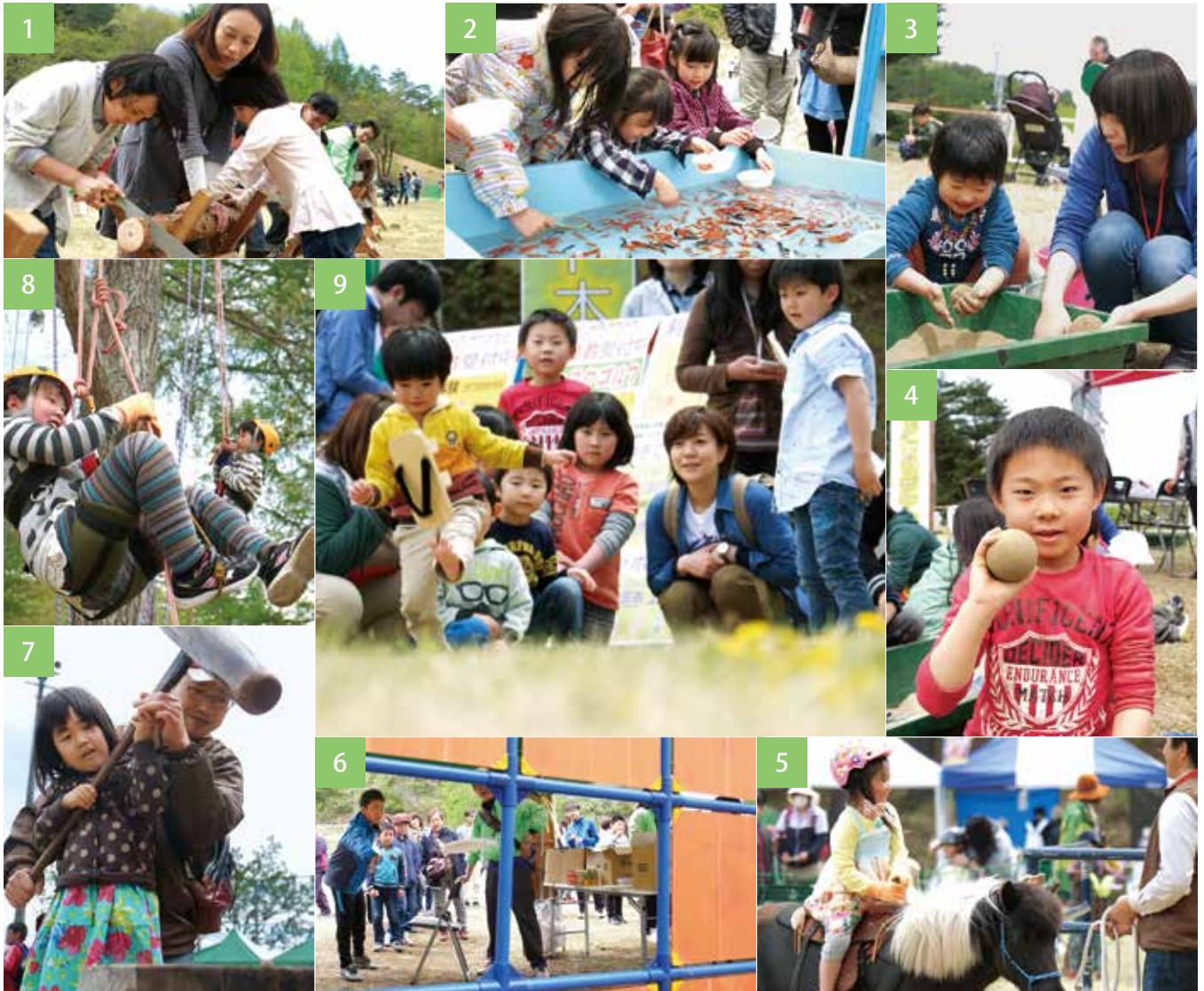
1「切れる〜!」。1位を目指し必死に丸太切り 2「破れないようにそ〜っと…」チャンピオンを目指し金魚すくい 3光どろんどろんごづくりに夢中になります 4「みてみて! 出来たよー!」 5「お馬の背中気持ちいいな〜」 6ビンゴを狙いフライングディスク 7親子仲良く餅つき体験 8「難しいぞ〜」。人気を集めたツリーイング体験 9「飛んでけ〜!」。距離を競ったけた飛ばし大会

村のゴールデンウィーク恒例となった「緑の村子どもまつり（同実行委主催）」が5月5日、緑の村で開かれ、会場にはビニール製の滑り台やゲームコーナーが設置されたほか、けた飛ばし大会や丸太切り競争などのイベントで終日にぎわいを見せました。新しい企画の「金魚-1グランプリ」は、すくった金魚の数を競い、チャンピオンを決めるというもので、幼児の部、小学校低学年の部、小学校高学年の部、中学生以上の部の4部門に分かれて行われ、多くの参加者が優勝賞品目指して金魚を追いました。