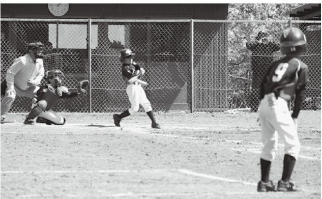
決勝で敗れはしたものの、県大会での活躍が期待されます

決勝戦は田野畑村の田野畑スピリッツと対戦。2回裏に1点先制されると、4回裏には味方のエラーからさらに3点を献上。その後も流れをつかめず、2対5で惜しくも敗れました。