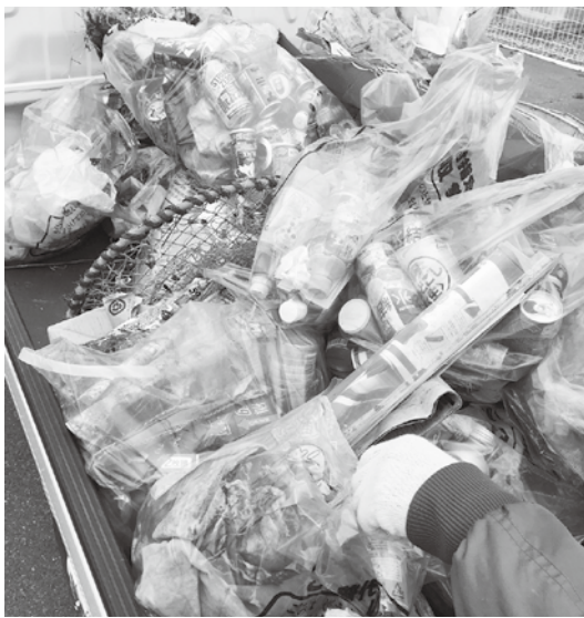
村全域からは約900kgのごみが収集されました