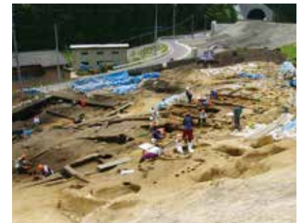
力持での遺跡調査