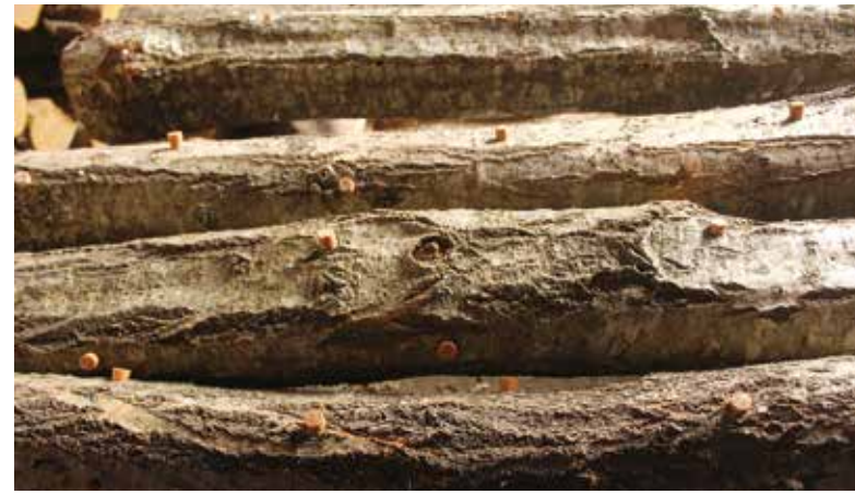
ドリルで穴をあけ植菌。その後金づちで叩き埋め込みます