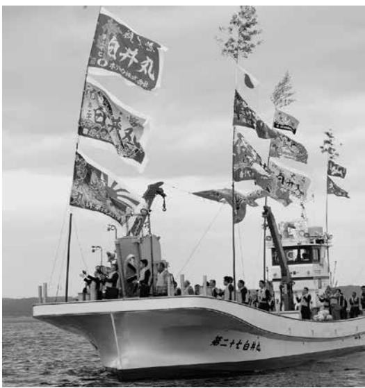
新造船で5つの神様を回り、海上安全を祈願します