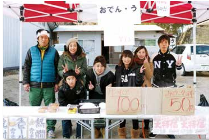
子や孫一同で店を大切に守り続けています