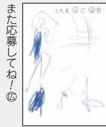
また応募してね! ④ 結城晴くん (盛岡市・3歳)