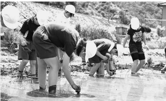
昨年5月の普代小学校5年生による田植えの様子