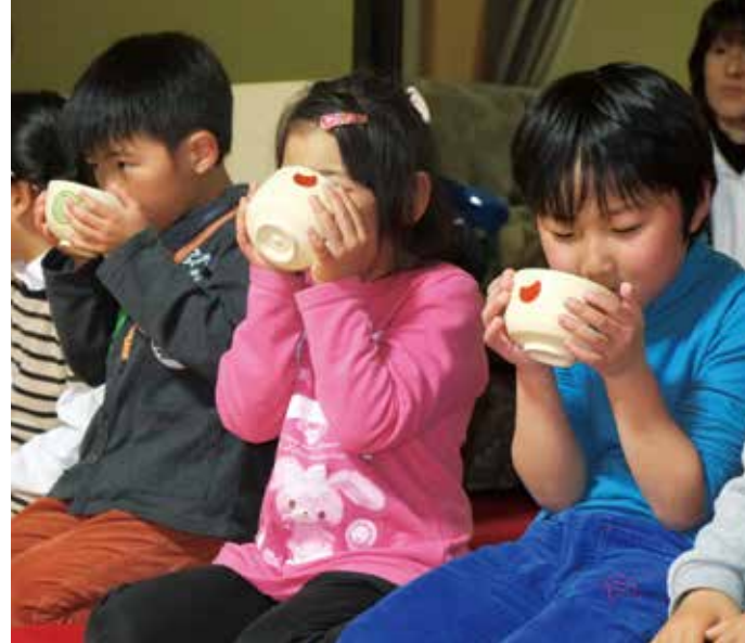
園児たちは正座をし、行儀よくお茶をいただきました

3月6日には27人の生徒が子ども園を訪問。3つのグループに分かれて年少から年長組までの3つのクラスでプレゼントした絵本の読み聞かせをしました。園児たちはお兄さん、お姉さんの読み聞かせに聞き入っていました。