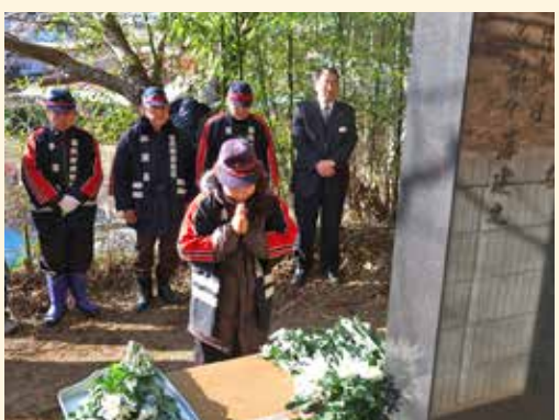
菊の花を手向け過去の教訓を胸に刻む皆さん

3月3日には、明治と昭和の大津波で犠牲になられた人々を追悼する津波記念碑慰霊祭が、中央区の「横町津波記念塔」と太田名部の「津波記念塔」の2カ所で行われました。太田名部地区の津波記念塔には役場や消防関係者、地区住民ら約30人が参列。午前8時のサイレンと同時に、1分間の黙とうをして犠牲者の冥福を祈りました。その後、一人ずつ記念塔に菊の花を手向け、過去の教訓を胸に刻みしました。