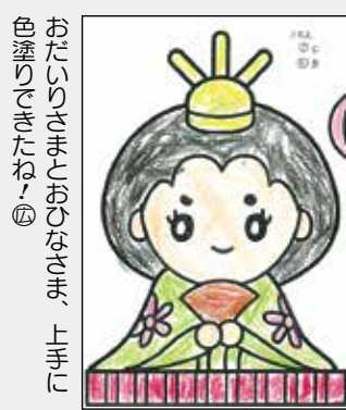
おたのしみとおひなさま、上手に色塗りができたね④