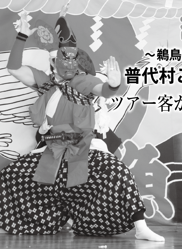
鵜鳥神楽人気演目の一つ「山の神」

株式会社JTB主催によるツアー「普代村こうりゅうものがたり～鵜鳥神楽の神楽宿と交流の旅～」が2月21、22日の2日間、黒崎地区公民館を主会場に行われ、ツアー客の皆さんは鵜鳥神楽の黒崎地区での巡行を地区の住民と一緒に鑑賞したほか、ワカメの芯ぬき体験などとおし交流を深めました。