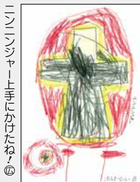
ニンジンジャー上手にかけたね④