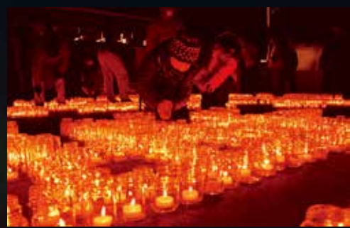
約300人の来場者がキャンドルに火を灯します

同イベントは並べられたキャンドルに火を灯し、大きな文字にするというもので、犠牲者に対する追悼の意を表する2震災を振り返り、震災について考える3震災の風化