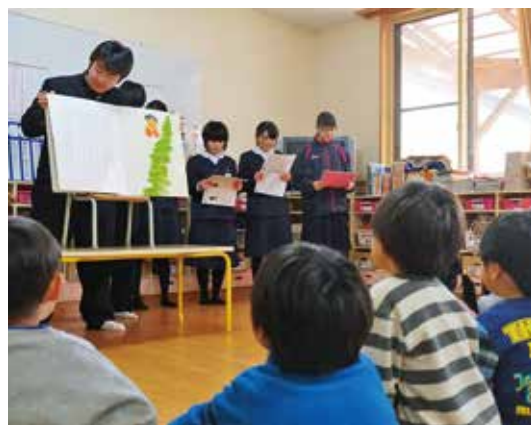
さくら組での読み聞かせ