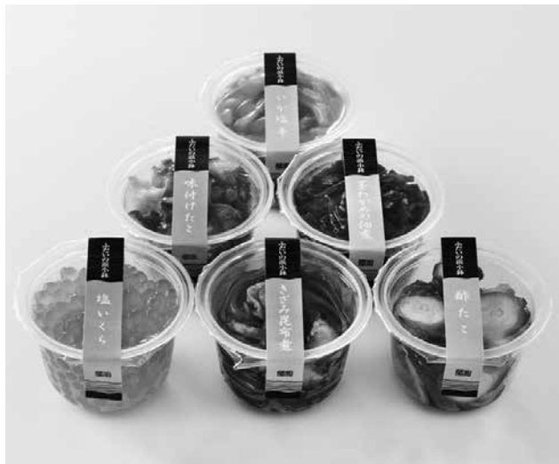
嵯峨商店の新商品「ふだいの浜小鉢」

県水産加工品コンクールが2月2日、水産加工食品の消費拡大と水産加工業の復興を目的に盛岡市のホテルメトロポリタン盛岡で行われ、株式会社嵯峨商店の新商品「ふだいの浜小鉢」が岩手県