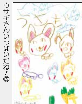
ウサギさんいっぱいだね④