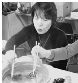
シャブシャブでコンブやワカメを試食

今回の刈採り体験は6次産業化の取り組みに結び付け、地域水産物素材の新たな可能性を生産者・漁業協同組合・行政がともに研究・検証することで、産業を活性化することを目的に平成26年度地域づくりアドバイザー事業として行われました。