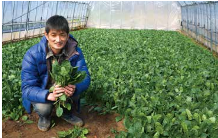
22棟のハウスで年間約10ト以上のハウレンソウを生産します