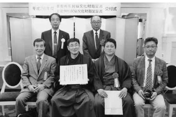
交付式後に関係者で記念撮影

1月16日に国重要無形民俗文化財指定への内定を受けていた鶴鳥神楽が3月2日、文化庁から認定書の交付を受け、正式に国重要無形民俗文化財