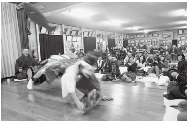
釣り上げたタイに飛びつく恵比寿様

いくつ当てはまったでしょうか? 実は1つでもチェックがあるとそれはメタボの危険信号です。日々の生活に運動を取り入れるなどして生活習慣を整えましょう。