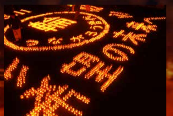
キャンドルの文字を見て来場者は強い絆を持ち復興を進める決意を新たにしました

この日のために各地区から集められたガラス瓶は約3200個。村民の皆さんの協力で、目標の3110個以上のガラス瓶が集ま