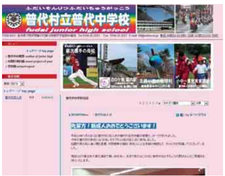
新しいホームページには学校情報が満載

普代中学校ではこのほど、学校のホームページをリニューアルしました。リニューアルしたホームページにはこれまで同様、学校の概要のほか、年間行事計画表や学校報、「普代中の学校日誌」と題した、日々の生活や部活動の情報が掲載されています。