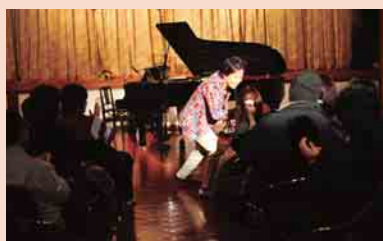
会場を巻き込んでのステージ