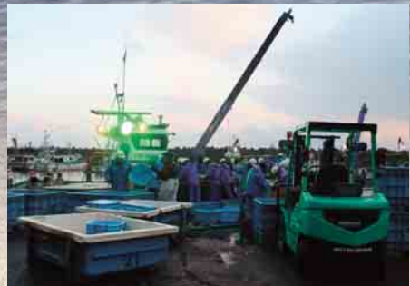
定置網漁で活気づく太田名部漁港(1月4日)

◇ 一方では、東北楽天ゴールデンイーグルスで本村出身の銀次選手が大活躍し日本一に、全農・全国乾椎茸品評会では本村からダブル日本一が誕生するなど本村にとって明るく