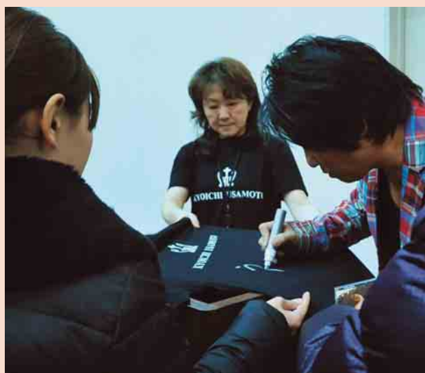
宇佐元さんから直筆サインのプレゼント