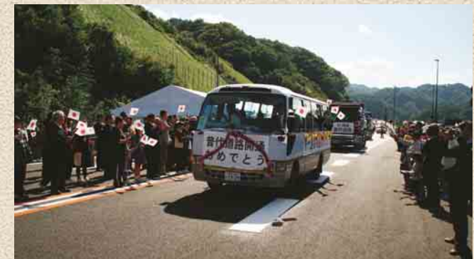
10月13日15時30分から一般供用が開始された「普代道路」