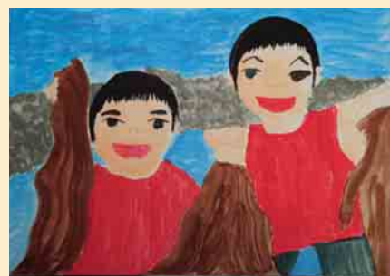
「青い海を未来に残そう」

ぼくは、夏休みにキレイな海で遊びました。とても楽しかったです。キレイな海で遊ぶと楽しかったので、海をキレイにできるように、自分のできることをしていきたいと思います。