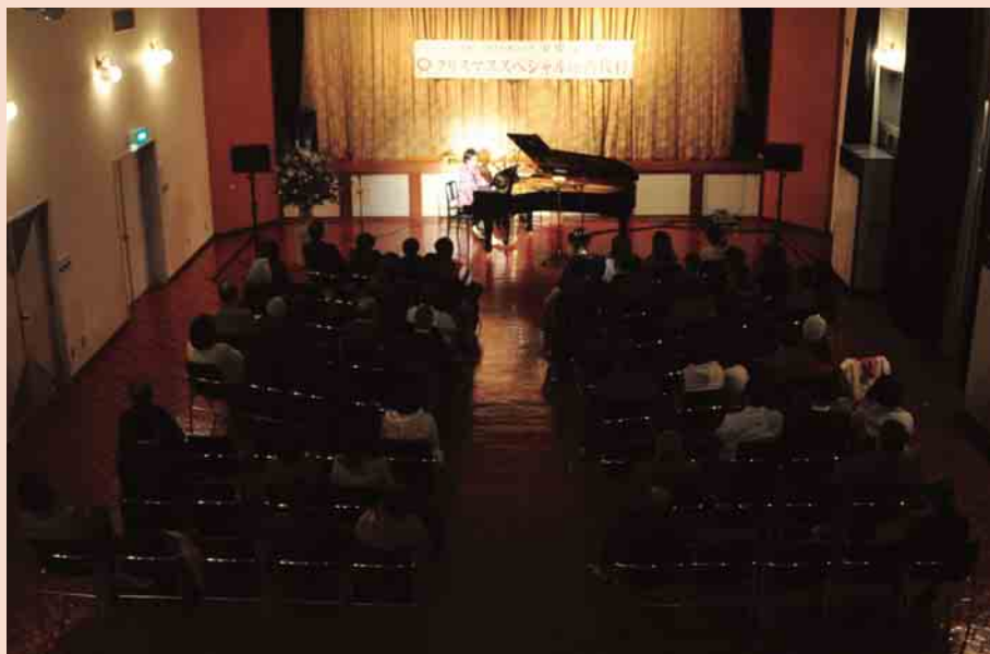
クリスマスムードが漂う会場