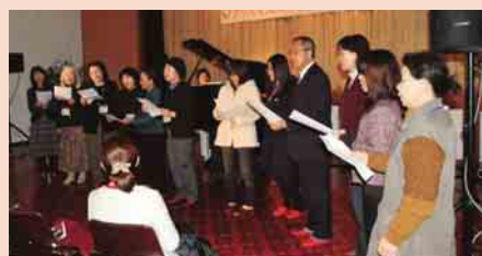
てぼかい合唱団とのコラボも披露