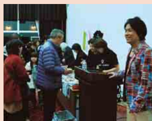
宇佐元グッズには長蛇の列が