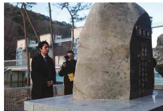
水門や故和村村長の顕彰碑を視察する小泉政務官

衆議院議員の小泉進次郎復興政務官が12月17日、東日本大震災で被災した普代、洋野、