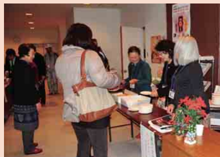
クリスマスプチケーキも