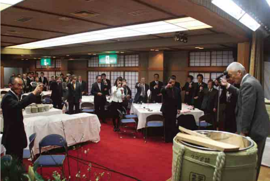
村のさらなる復興、発展を願い「乾杯!!」

平成26年新年交賀会が1月5日、国民宿舎「くろさき荘」で行われ、村の発展を願う皆さんが心一つにしました。交賀会には村と村議会、各産業団体の長をはじめ、鈴木俊一・畑浩治衆議院議員や伊藤勢至・佐々木大和・城内愛彦県議会議員、行政関係者、一般参加者ら約90人が参集。