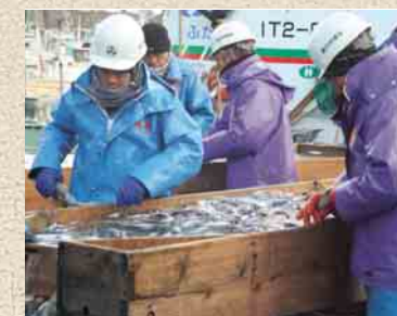
イワシの選別作業に汗を流す漁師たち