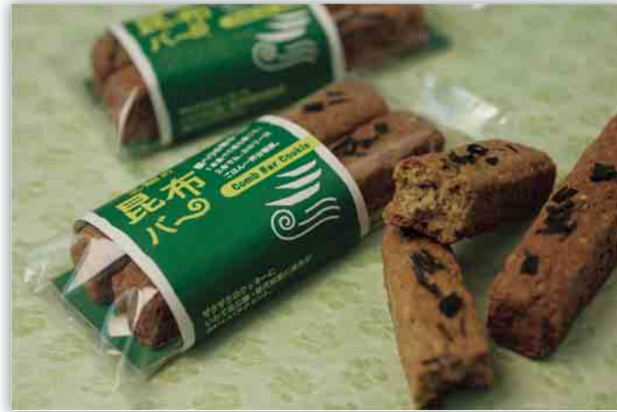
ザクザクとした食感とコンブの風味がたまりません