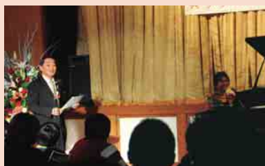
笹屋村長とのコラボも