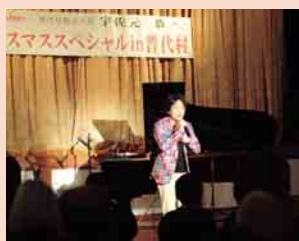
美しい声が響き渡ります