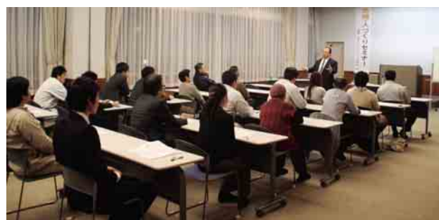
約30人が地域振興や産業振興について学びました

同セミナーは、これからの後継者不足の解消や結婚活動の活性化につなげるためのもので、本年度中に次の通りあと2回開催されます。●第2回セミナー：平成26年1月23日午後6時、役場3階大会議室 ●講演会：平成26年2月2日午後1時30分、自然休養村管理センター大集会室