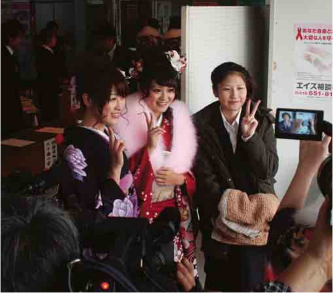
平成26年村成人式から