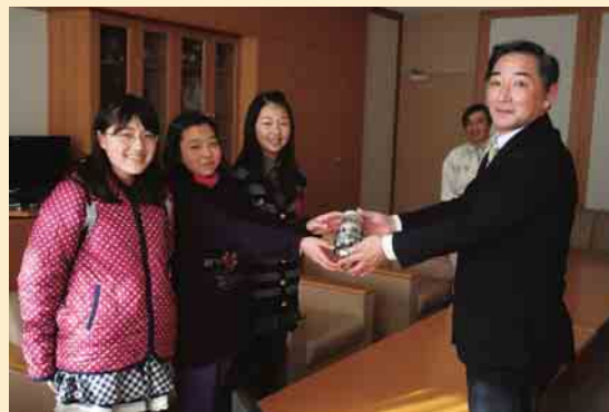
募金を手渡しに来た黒崎、太田名部子供会の児童