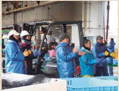
三本締めで大漁を願う漁業者(1月4日)

◇ 年頭には、東北楽天ゴールデンイーグルスで本村出身の銀次選手が大活躍し日本一に、全農・全国乾椎茸品評会では本村からダブル日本一が誕生するなど本村にとって明るく