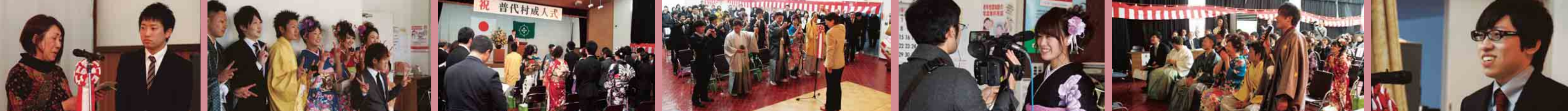
親から子へ手紙の朗読