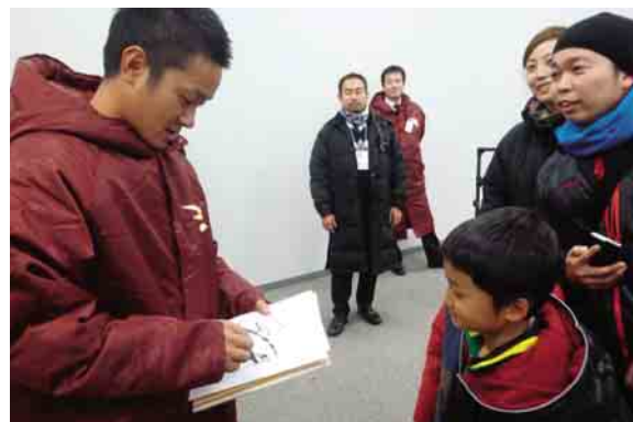
子どもたちのサインに応える銀次選手

サッカーの慈善試合「チャリティーサッカー2013」(日本プロサッカー選手会主催)