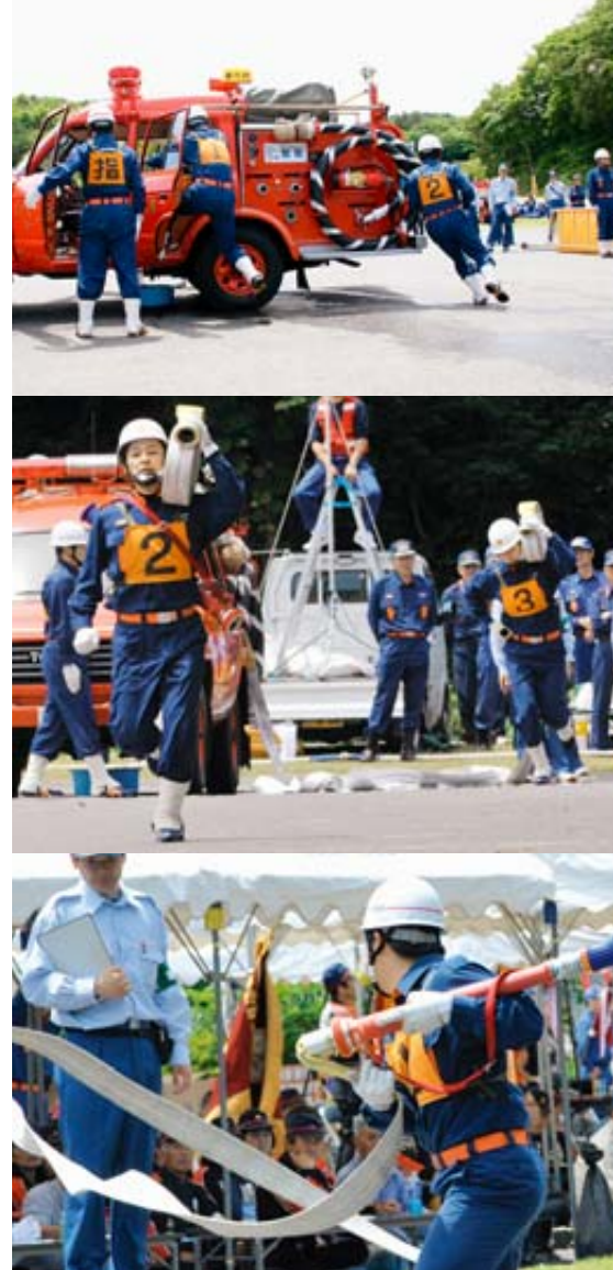
「操作はじめ」「よし」の合図で5人が一斉に下車する