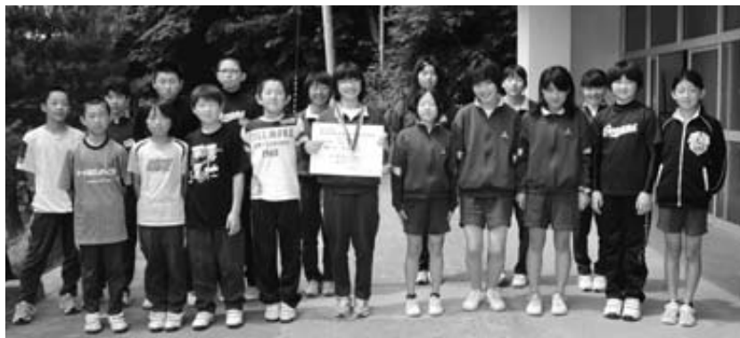
入賞した普代小の5、6年の皆さん

さん(同)も幅跳び11記録3.92で同じく2位に入賞。そのほかの5種目で3位に入賞していた。同大会は久慈地区から18校約260人が参加しました。本大会8位までの入賞者とは各種目の記録は左表の通りです。