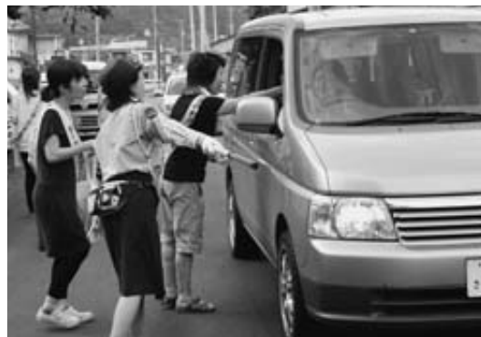
交通安全を呼び掛ける母の会のメンバーら

交通安全街頭指導は夏の交通事故防止県民運動の一環として8月1日、上区の理容銭さん前の旧国道で行われ、参加者がドライバーに安全運転を呼び掛けました。岩手県交通安全協会普代分会員や同シルバー部会、交通安全母の会、交通指導員、久慈警察署員ら30人が参加。路上では「交通安全運動実施中」ののぼりを手に、母の会の会員らが、「安全運転お願いします」と、同運動のチラシや