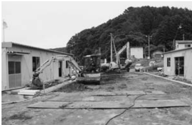
堀内地区では、水産加工業共同利用施設周辺の舗装工事が行われています