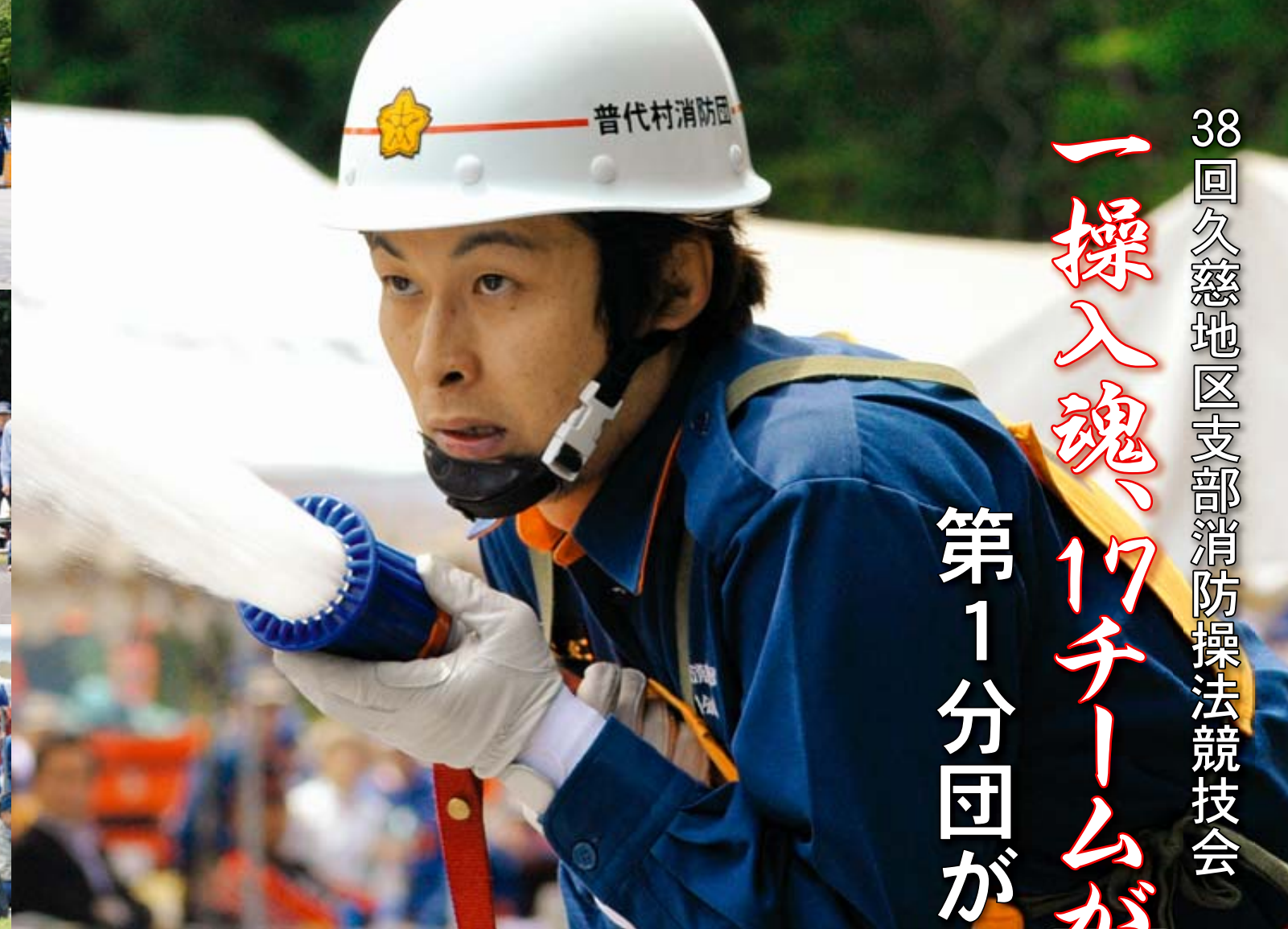
これまでの厳しい訓練の成果と、団の威信を背に（第1分団第1部）