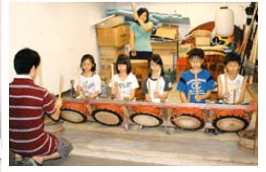
「みんなで揃えるのは難しいなあ」(下組)