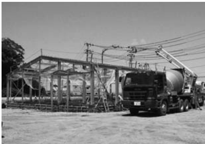
養殖ワカメ・コンブの種苗センターの建設が進む太田名部地区