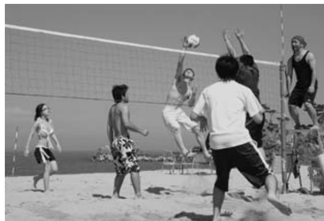
白砂の普代浜で思い切りスパイクを決める参加者

9回を迎える普代浜ビーチバレーボール大会(同実行委主催)が8月5日、普代浜海水浴場で行われ熱戦が繰り広げられました。大津波後2回目の開催となりましたが、村内外から25チームが参加。波の音と軽快な音楽が響く中、選手たちは白い砂浜で思い切りレシーブしたり、豪快にスパイクを決める参加者