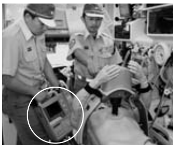
人形に付けている除細動器(円内)と心臓マッサージ

久慈消防署普代分署の救急自動車に配備されている半自動式除細動機器と自動心臓マッサージ器をこのほど最新型に更新しました。2台で約500万円でした。同機器は村が購入し、久慈広域連合消