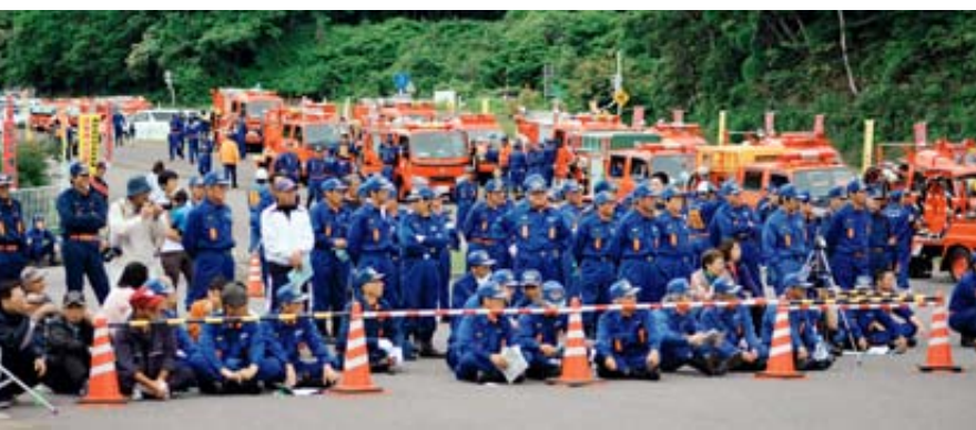
久慈地区の消防団がB & G海洋センターに集結。かたずをのみ見守る