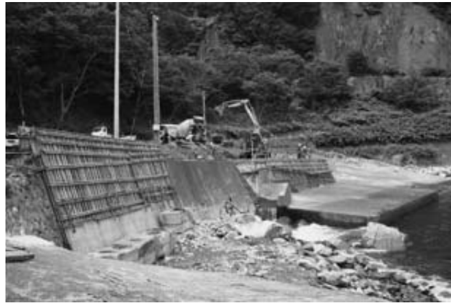
白井漁港は、のり面の復旧工事をし、水産加工業共同利用施設を建設します

今後も村では、復興計画に基づく①産業・経済の再建②住民生活の再生③災害に強い村づくりの3本柱を基に、さらに復旧・復興を進めます。