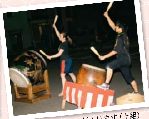
大太鼓も気合いが入ります(上組)