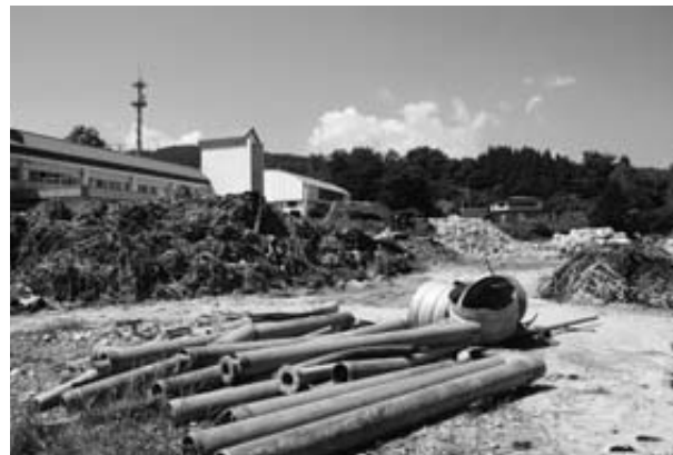
がれきは本年度中に全て処理する予定です（旧堀内小学校庭）