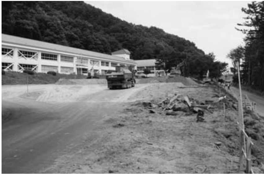
普代小では津波対策としてグラウンドを最大2.5mかさ上げ。普代バイパス工事で発生した土砂を使い現在7.5mの標高を10mまで高くします。村道側のり面は植物を植えることができる「環境ブロック」で補強します