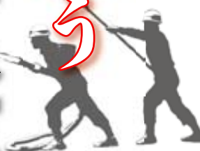
素早く水槽に吸管を投入！