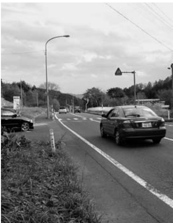
国道45号の白井峠付近(久慈方面から)

子宮頸がんワクチン接種の公費助成は、6月議会の補正予算で議決をいただき、中学生を対象に3回の接種のうち既に2回を終わり、来年1月の3回目の接種を残すところだ。このことについては、ご提言をいただき、子どもた