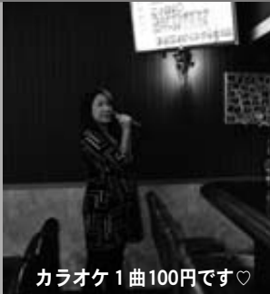
カラオケ1曲100円です♡

CAT'S EYE 忘年会の予約 お待ちしています *OPEN 19:00~ *CLOSE SUNDAY *TEL 090-7061-5337 0194-35-3625