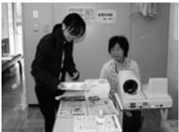
健康コーナーでは血圧や骨密度、体脂肪などを測定し自分の体をチェックしました

平成22年度普代村文化祭が11月5日から7日までの3日間、役場や保健センターなどで行われました。会場には、村民が丹精込めて作った生け花や盆栽、ちぎり絵、パッチワークなどをはじめ、川柳や短歌、写真、油絵など多彩な文芸作品を展示。交通安全ポスターや園児の絵画なども飾られました。 警察・人権擁護・更生保護