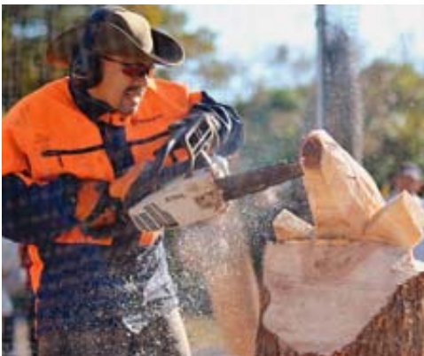
見事な技を見せるチェーンソーアート