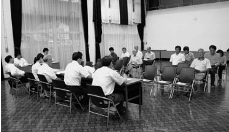
8月に村内10会場で行われた「あすの普代村を語る会」(管理センター)

村では10年後の村を展望するため平成13年3月に新普代村総合発展計画を策定し、本年度はその最終年度となっている。現在、23年度から10年間の新総合発展計画の策定が進められている。この計画は村の将来像の基本をなすものであり、行政と村民の意見と意思の結晶を具現化するものであると理解する。住民の多くの意見が反映されたものであり、場合によっては個別の聞き取り調査の中の意見交換も必要であったと思う。