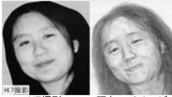
H7撮影 現在のイメージ