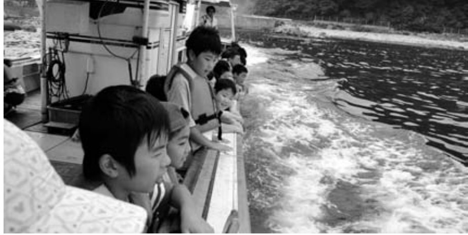
8月に行われた普代村と矢巾町の児童交流