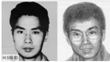
H5撮影 現在のイメージ