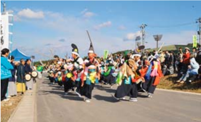
青空の下、元気に舞う普代中生の中野流鵜鳥七頭舞

「青空ショップin普代」が11月3日、北緯40度総合運動公園の入り口付近の特設会場で行われました。同イベントは、道の駅構想が期待される白井地区の国道45号沿いで初の開催。時折強い風が吹く中でしたが、約500人の来場者は新鮮野菜や果物、フランクフルトやおやきなどを買い求めていました。会場内では、村漁協女性部の鮭汁や村生活研究グループ協議会のこんぶひつまみ汁などが振る舞われたほか、アトラクションでは、普代中生の中野流鵜鳥七頭舞やチェーンソーアートのデモンストレーションなどが行われ、来場者は海見える開放的な空間で1日楽しく過ごしていました。