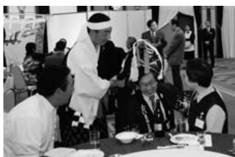
権現様に身固めをしてもらいました

懇親会では鶴島神楽2演目が披露されたほか、神楽衆が権現様を持ち身固めをして会場を回ると、皆さんは無病息災を願いながら古里の舞いを楽しんできました。集いの最後は今後の発展を願い万歳三唱で締めくくりました。