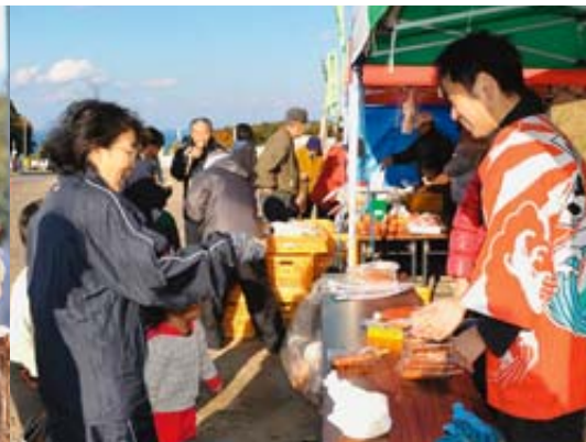
村商工会青年部も揚げ物などで出店