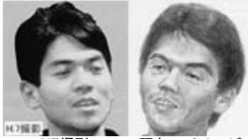
H7撮影 現在のイメージ