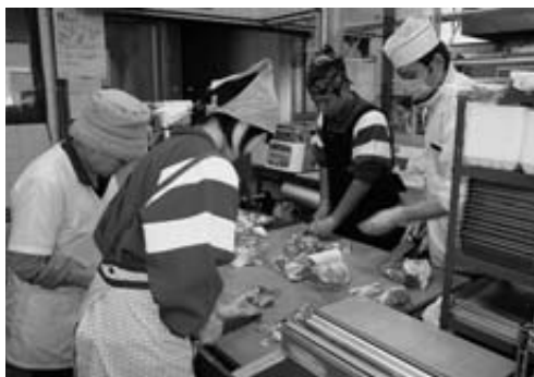
上神田精肉店で100*の豚肉を切る生徒。立ち仕事で「結構大変です」と話していました

産経新聞「朝の詩」で注目を集める98歳の詩人。思わず涙がこぼれた、一步踏み出せそう、宝物にしたい…。トヨさんが紡ぎ出すみずみずしい言葉の数々を収録。