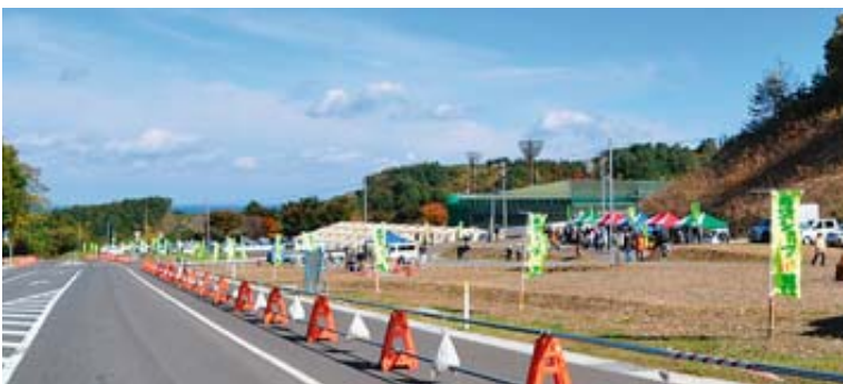
国道45号沿いの海見える北緯40度運動公園付近で初開催となりました