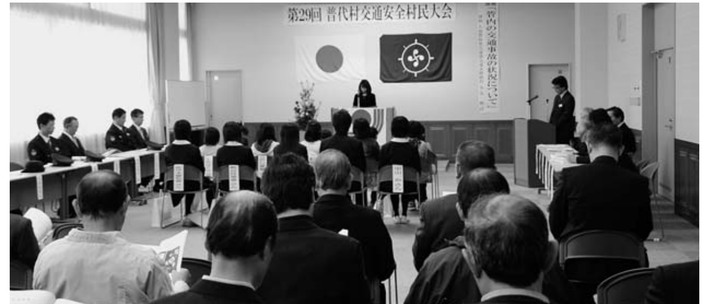
「交通事故のない明るく住みよい郷土を築くため、全村民が力を合わせて一層努力することを誓います」と決意しました

第27回村交通安全村民大会が11月6日、役場大会議室で開かれました。交通安全協会やシルバー部会、母の会ら関係者約80人が参加し、飲酒運転の撲滅やシートベルト、チャイルドシートの着用の徹底などを誓い合い、運転者も歩行者も思いやりの気持ちで全村民が交通ルールを守ろうと、決意を新たにしました。