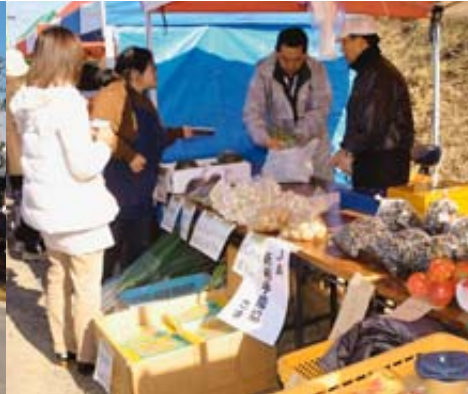
新鮮野菜が大売り出し