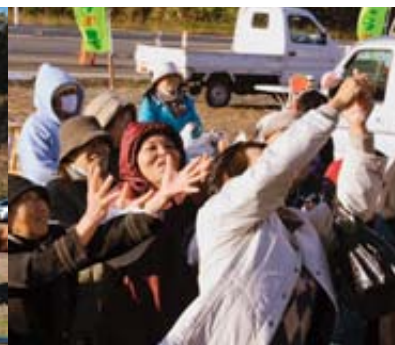
「こっち、こっち」。もちまきも盛況