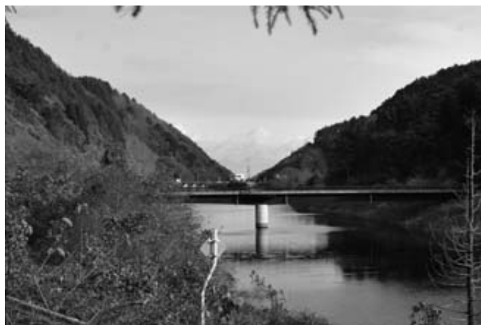
普代ダム上流の新大沢橋

同日午後には、村教育委員会主催事業の「地球村普代っ子学園」の参加者を対象に実施し、ダム本体内部と管理棟のダム管理用操作盤、管理橋を利用しての親水ゾーン・散