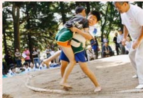
白熱した取り組み見られた相撲大会