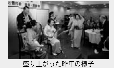
盛り上がった昨年の様子

21回目を迎える「ふるさと普代会」の総会と集いが下記の日時に行われます。お誘い合わせて、ご参加ください。 ◆とき: 10月25日(日) 11:50~ ◆ところ: 東京ガーデンパレス(東京都文京区)