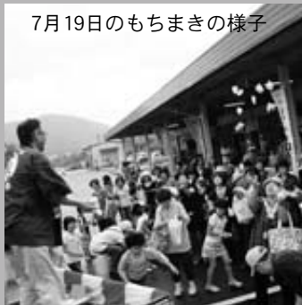
7月19日のもちまきの様子

「もちまき」と「マツタケが当たる抽選会」を企画 やませ朝市 やませ朝市実行委員会では、9月20日開催予定のやませ朝市で、通常の販売に合わせ、「マツタケが当たる抽選会」と「もちまき」を企画しています。ぜひ皆さんお越しください。