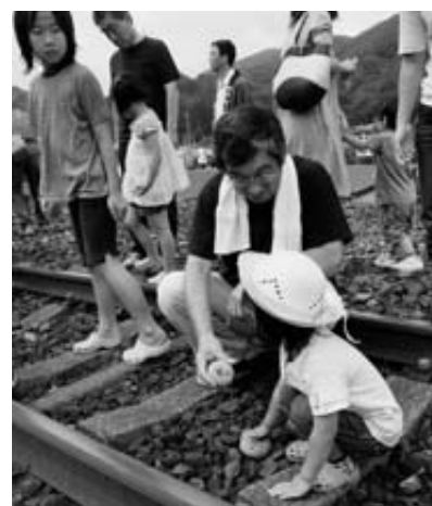
願いを込めた石を線路上に置く皆さん

三鉄アートシリーズ「石に願いを」が8月9日、三陸鉄道普代駅で行われました。参加した親子など16人は、「はやね、はやおき」「やせたい」「元気に育て」などと10センチ程の丸い石に思い思いの願いを書き、それ