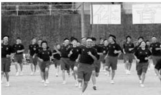
「さあ、いくぞ!」「おー!」。入退場でも全力です