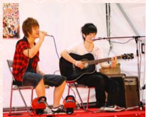
さわやかな歌声を響かせた青年部カーニバル