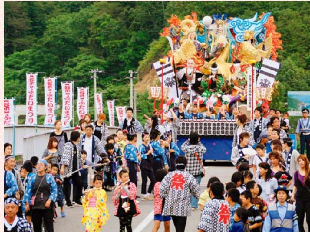
新普代橋を通過する上組の山車。幅3疋ほどの金色の鵜が輝いています