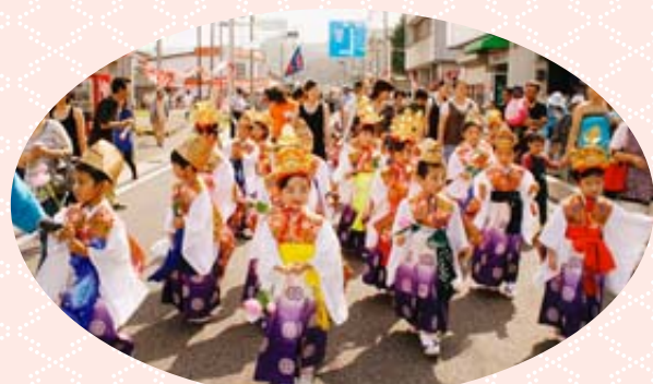
きれいに着飾ったかわいい稚児たち