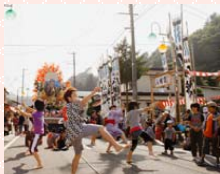
太鼓のリズムに合わせ踊る若者たち