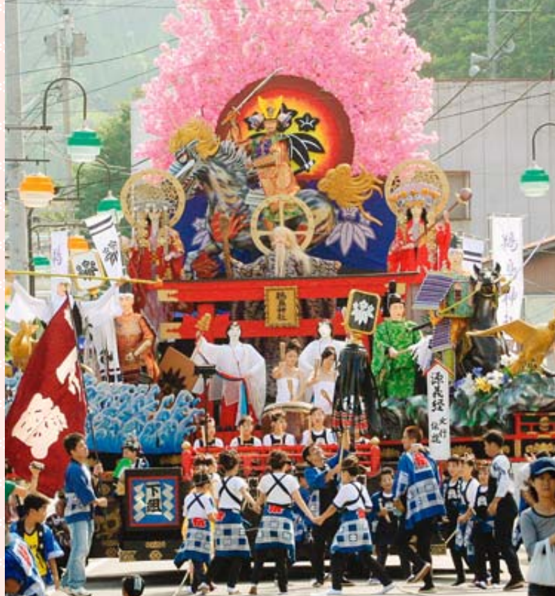
「ソレ、ソレ、ソレ、ソレー!」。沿道で盛り上がる下組若連と子どもたち