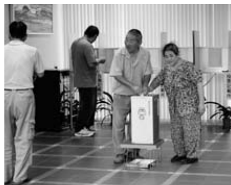
1票に願いを託す有権者の皆さん(役場村民ホール)

第45回衆議院議員総選挙と最高裁判所裁判官国民審査の投票が、8月30日行われました。村の投票率は小選挙区(岩手県第2区)、比例代表(東北選挙区)とも79・51%(男76・70%、女82・18%)と前回17年9月に行われた同選挙の79・38%を0・13ポイント上回る投票率となりました。投票は、30日午前7時から午後6時まで、村内10カ所の投票所で行われ、開票は午後8時から役場で行われました。 衆議院議員、比例代表の選挙結果は左票の通りです。最高裁判官の国民審査の投票率は77・91%(男75・14%、女80・55%)で、全員が新選