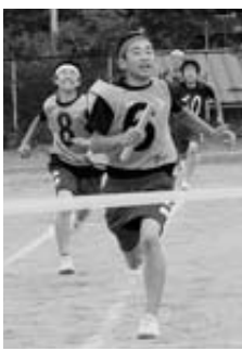
最後の種目・最強リレー