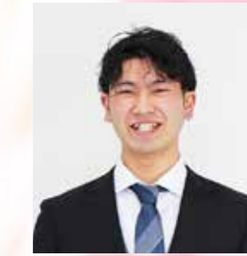
深渡 柁 (久慈市)