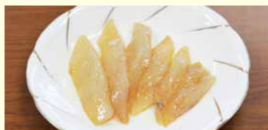
伊豆大島の郷土料理「べっこう」

改めて教わった感じがしています。 普代村に来てからも、魚や青とうがらしは東北のものですが「べっこう」を作っています。