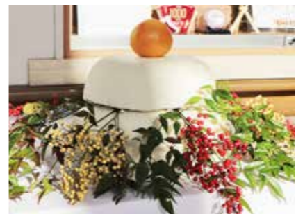
お供えいただいた鏡餅

物産交流などで交流している矢巾町の産直右京の会の皆さんが12月27日、役場を訪れ鏡餅を寄贈しました。毎年寄贈していただいている大きな鏡餅。今年も約15kgとなるよう、役場1階のエントランスホールにお供えいただきました。