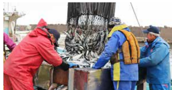
大量の魚が水揚げされ市場に並びました