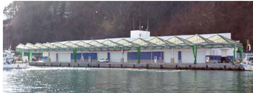
新魚市場は4月に開所となります

り組んできた。卸売市場は、心安安全で新鮮な魚を販売し、刺身文化の支えとなる。さらには、港全体の賑わいの創出へ、誠心誠意努めていきたい」と決意を固めていました。