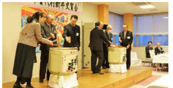
良き一年となることを願い鏡開きが行われました

令和7年村新年交賀会が1月5日、国民宿舎くろさき荘で行われ、出席した90人が発展する年となることを願いました。