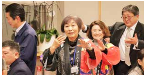
ふだい音頭は出席者も参加し大いに盛り上がりました