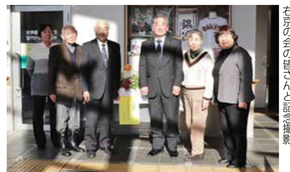
右京の会の皆さんと記念撮影