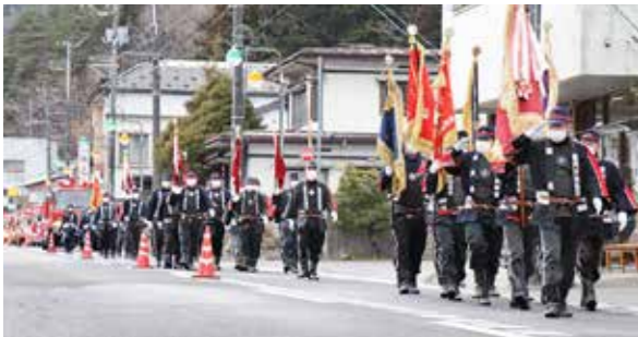
商店街を堂々と分列行進しました

年に2回行いました。技術向上のために、回数を増やしていくことも考えています。今後、少子高齢化の波は急激に進んでいきます。その中で消防団は村民の生命財産を守り、心安安全を届けることが我々の大きな責務です。そのため活動・訓練をこれからも力を入れましよう」と訓示。 式終了後は、商店街を分列行進し、村の防災意識の高揚を図りました。