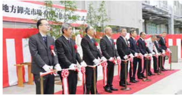
テープカットする関係者

太田名部地区に新しく完成した、普代村魚市場の竣工式が12月25日に行われ、村や県、漁業協同組合、施工会社など49人が出席しました。 榎屋伸夫村長は「普代村は海の恵みとともに、歩み進むことは必須である。近年の海洋環境の変化にも対応しなければならぬ。新魚市場に最新の衛生管理設備を備え、