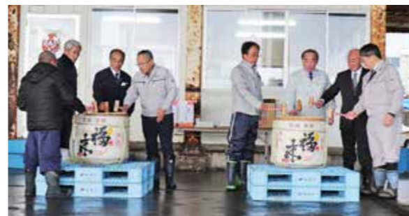
「ヨイショ」の掛け声で鏡開きする関係者