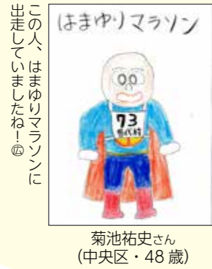
この人は、はまゆりマラソンに出走していましたね！