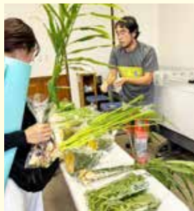
出店販売も行っています