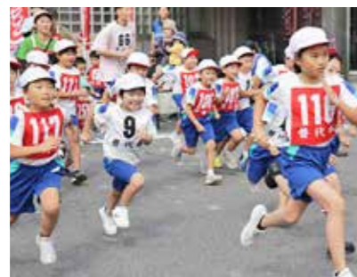
力の限り走り抜きます