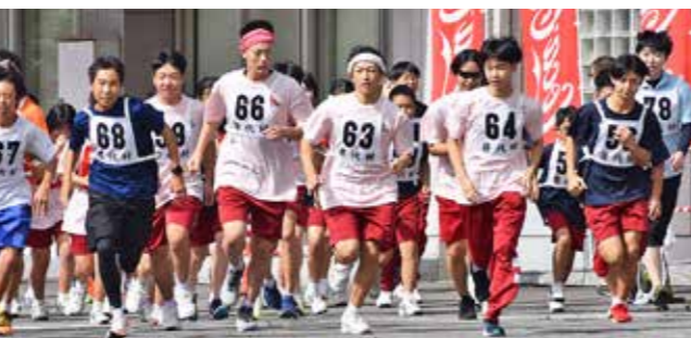
スタートの合図で一斉に走り出す選手たち

大会は、親子、小学校低学年男女、同高学年男女、中学校男女、高校生以上一般男女の9部門に分かれて実施。選手たちはスタートの合図で勢