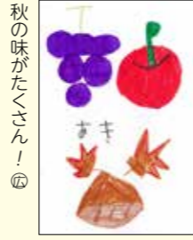
秋の味がたくさん！