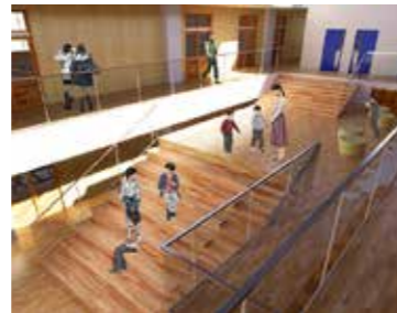
義務教育学校基本計画・基本設計 (8,057万円)