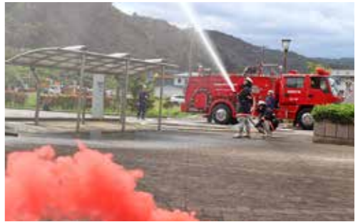
村消防団による火災防ぎょ訓練

防災ぎょ訓練や炊き出し訓練などを行いました。 また、小学生は市街地火災を想定した訓練の見学や避難所施設の見学を、中学生は役場3階で避難所開設訓練し、いつ発生してもおかしくない津波災害に備え、改めて行動を確認しました。