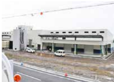
太田名部漁港新魚市場建設工事 (4億2,460万円)