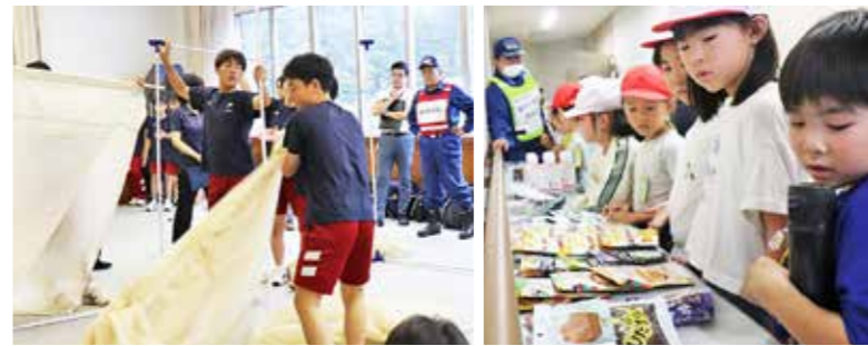
避難所開設の知識を身につけます

三陸沖を震源地とした大地震が発生し、大津波警報が発令したことを想定した村防災訓練が9月15日に行われ、沿岸部の住民や小中学生、村消防団、婦人消防協力隊が参加し、有事に備え行動を確認しました。 午前8時に緊急地震速報や大津波警報発令のサイレンが響き渡ると、次々と避難所等へ避難者が集まってきました。消防団員や婦人消防協力隊は水門閉鎖の操作確認や、各地区及び避難所の巡回、火