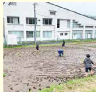
社会体育館裏の田んぼを活用