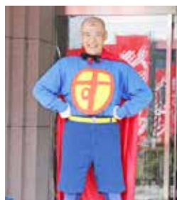
コスプレランナーが会場を盛り上げました