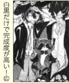
白黒だけで完成度が高い！