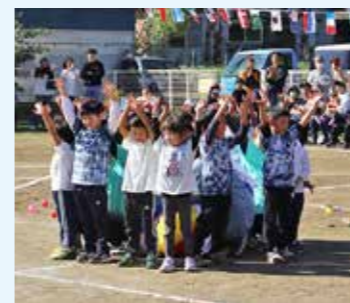
未来ある子どもたちのために

特別会計の資金不足を料金収入の規模と比較して指標化したもの。数値が大きいほど経営状況が悪化していることを表します。