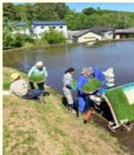
地域の方とも協力