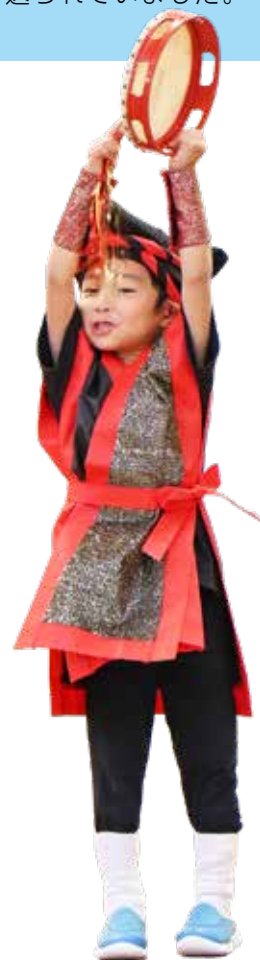
1_元気いっぱいのドンスカパン応援団（うめ・年中組） 2_堂々とはじめのことは！ 3_なかよくミッキーマウスマーチ！（ちゅうりっぷ・1歳児） 4_すてきなぼうしやさん（すみれ・2歳児） 5_ねこのおいししゃさん（もも・年少組、うめ・年中組） 6_ヘンゼルとグレーテル（さくら・年長組） 7_さくら組は着物を着た踊りに挑戦 8_合唱「はまゆりこどもえんのうた」（もも・年少組、うめ・年中組、さくら・年長組）

かわいい園児たちの姿に、会場で見守った保護者などからは、盛んに拍手が送られていました。