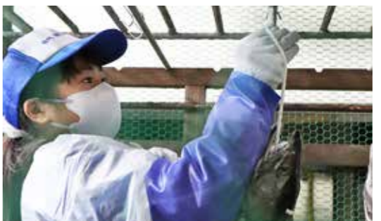
一人一本新巻きザケを作りました