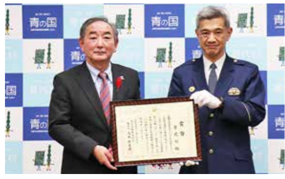
岩間署長から称賛状が村に渡されました。

関係団体や村民の取り組みや協力のたまもの。今後とも交通安全に取り組みます」と意気込みを語りました。路面凍結や雪道などでこれからの季節、より気を付けて運転が必要です。時間に余裕を持った丁寧な運転を心掛け、事故の無い普代村を目指しましょう。