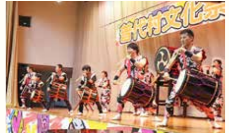
普代村文化祭が開催されました（11月4、5日）