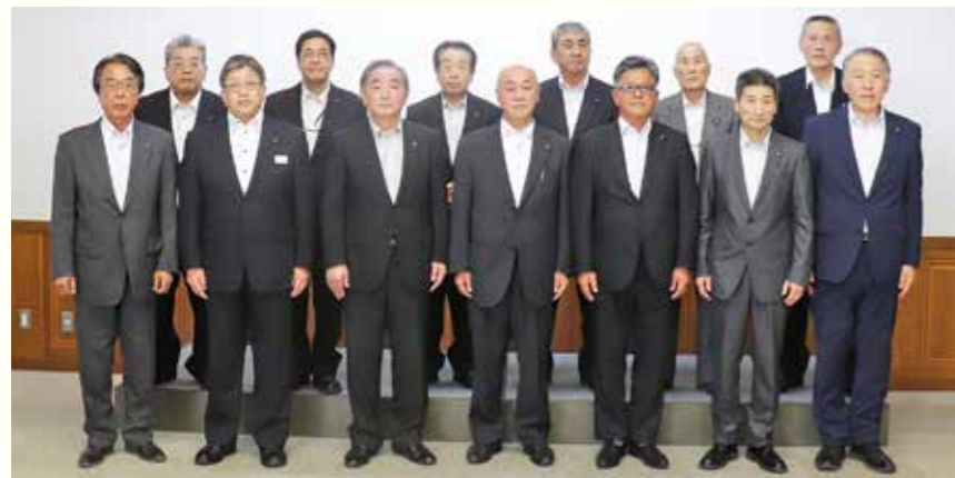
榎屋村長と10人の村議会議員が決定（6月13日）