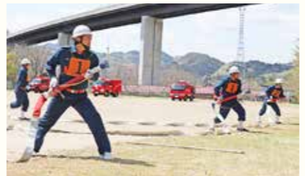
消防団特別点検が行われました（4月23日）