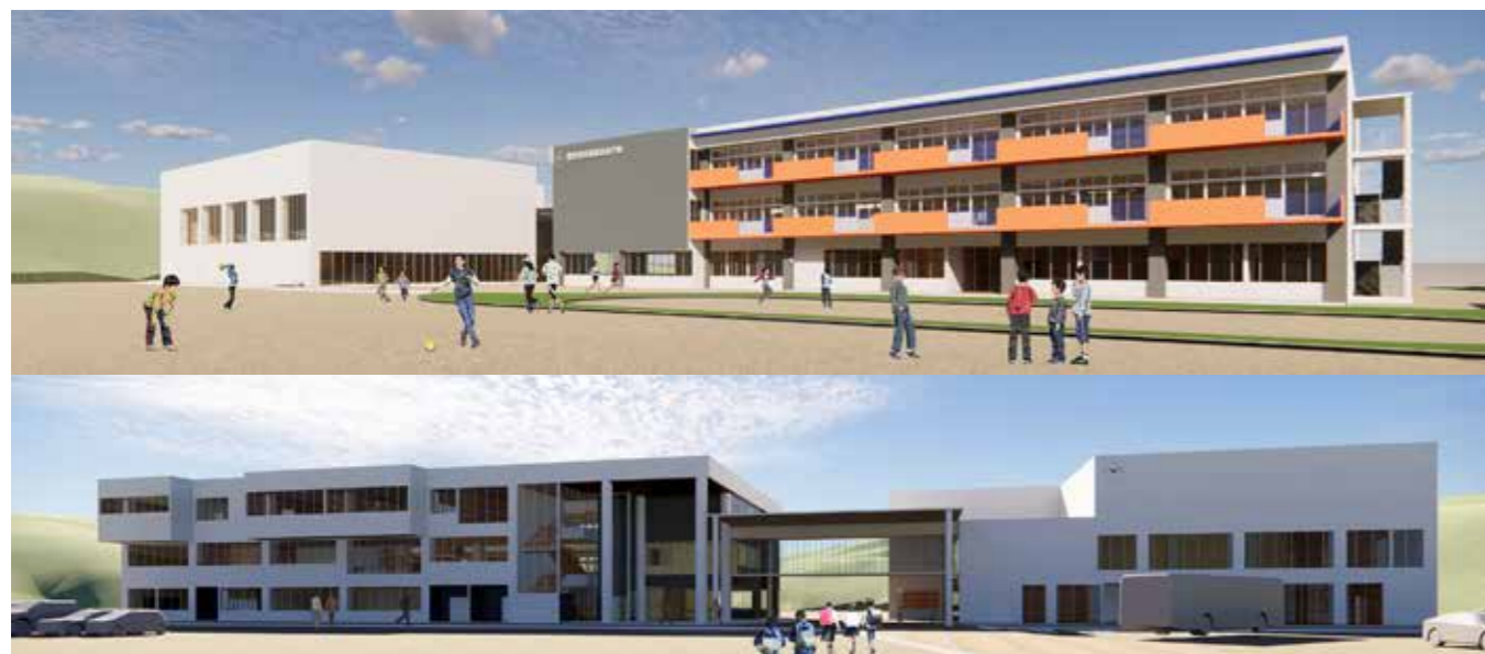
義務教育学校の校舎イメージ。南側外観（写真上）、北側外観（写真下）