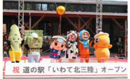
久慈市夏井町に「いわて北三陸」がオープンしました（4月19日）