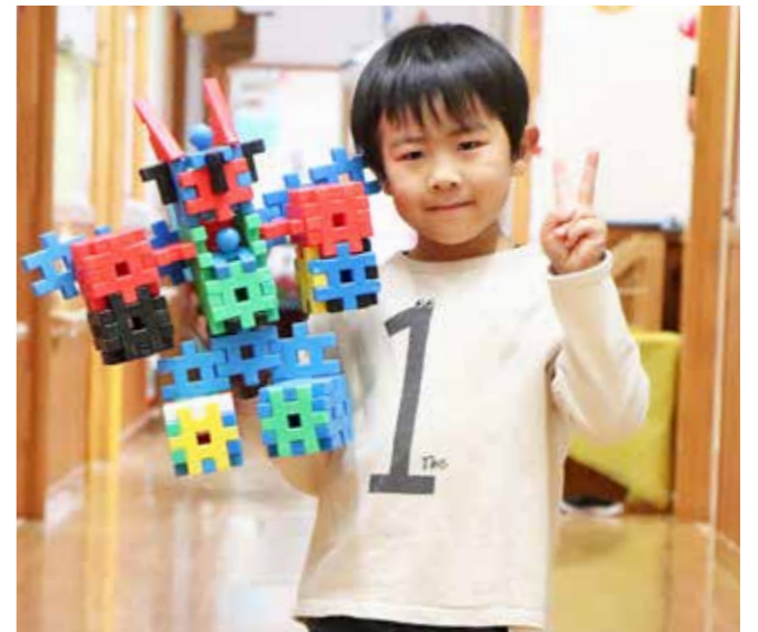
とらいくん (はまゆり子ども園さくら組)