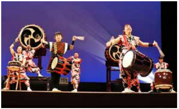
迫力ある太鼓の鼓動は、観客約500人の心を躍らせた