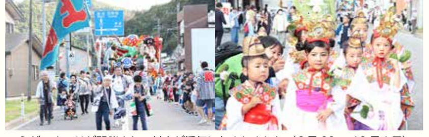
ふだいまつりが開催され、村中が活気に包まれました（9月29～10月1日）