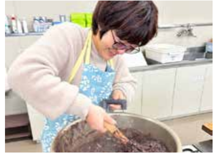
初めてのはっとう作りに挑戦しました

12月10日、村内在住の地域おこし協力隊やその家族などを対象に郷土料理教室が行われました。