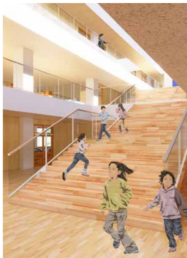
木のぬくもりを生かした校舎内に設計

校舎は3階建てで、県産材を取り入れ、木のぬくもりを生かし、1階には職員室や特別支援室、保健室等を、2階、3階に普通教室や図書室、音楽室等を配置します。また、別棟の体育館へは2階から移動できる設計で、3階からは太平洋が一望できます。また、太陽光、地熱なども利用したエコスクールとします。 体育館は災害時には地域の防災拠点としての機能を持たせ、200人程度は収容でき