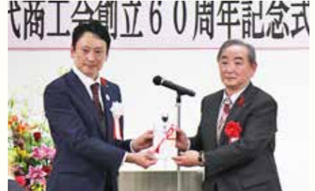
商工会の60周年を祝いました（10月20日）