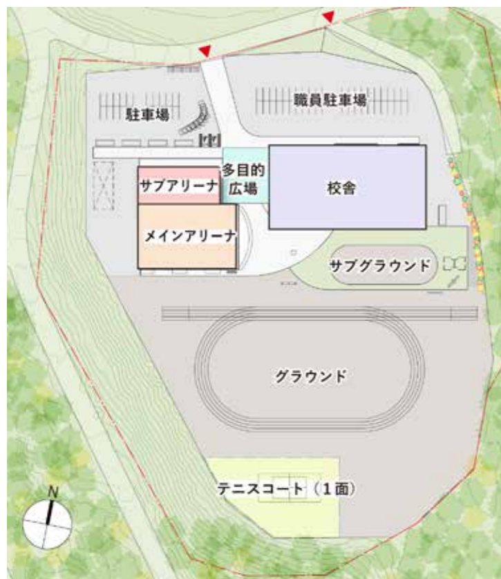
義務教育学校敷地内の配置図

これまでに住民説明会、義務教育学校プロジェクトチーム等々、「本村の児童・生徒により良い学習環境」との思いでさまざまな視点から取り組んできた義務教育学校の基本設計がまとまりました。 全室冷暖房完備し、体育館は災害時には避難所として使用できる設計で、建設地は白井多目的グラウンドとその周辺とし、令和9年度開校を目指します。