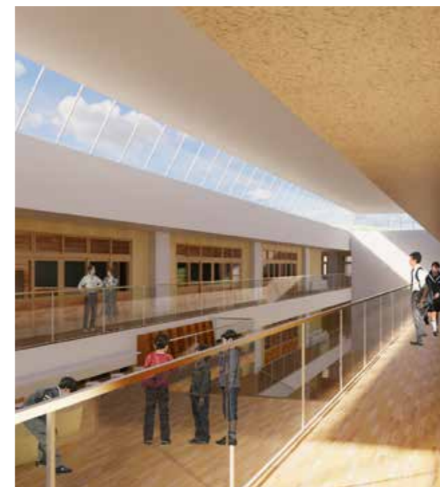
校舎内のイメージ。天井の窓からも光が差し込む校舎に設計

これまでに住民説明会、義務教育学校プロジェクトチーム等々、「本村の児童・生徒により良い学習環境」との思いでさまざまな視点から取り組んできた義務教育学校の基本設計がまとまりました。 全室冷暖房完備し、体育館は災害時には避難所として使用できる設計で、建設地は白井多目的グラウンドとその周辺とし、令和9年度開校を目指します。