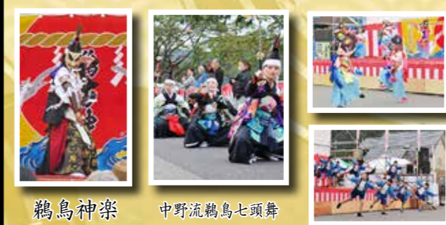
鶴鳥神楽 中野流鶴鳥七頭舞