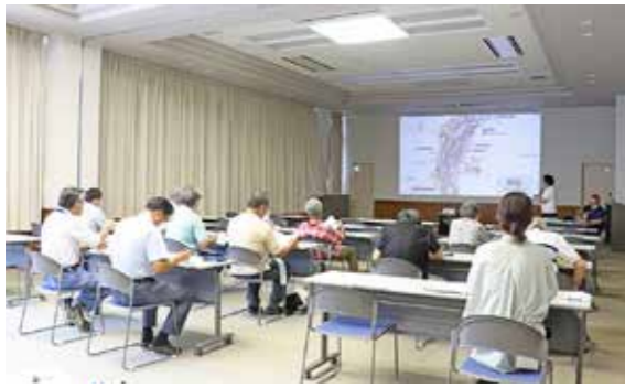
元村地区を対象に行われた勉強会の様子

旭日区から始まった勉強会には延べ55人が参加。防災マップの見方や過去の災害等を踏まえた現状、避難経路の相談などを行いました。役場総務課防災担当は「勉強会でいただいた要望は各課へ共有する等対応していく。災害時は皆様の自発的非難と助け合い避難が不可欠のため、ご協力をお願いしたい」と話しました。