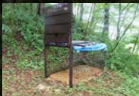
設置された捕獲用の罠