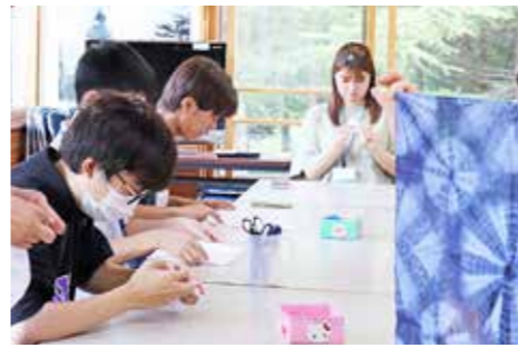
萩牛地区での鉄山染め体験

大阪府にある追手門学院大 学地域創造学部の学生らが「村づくり支援プログラム」で、9月14日から18日の5日間、村を訪れました。今回訪れた学生は、1年生4人。地域おこし協力隊員などの移住者インタビューや鉄山染め体験、普代水門の視察などを行いました。村の観光資源や特産品について学習し、最終日の18日に活動内容の報告を行いました。