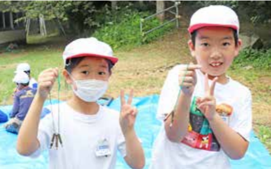
完成した色鉛筆に満足した児童たち

の中でどのような体験をしたことがあるか、友達と紹介しました。その後、クラフトづくりを実施。木の枝を削って小さな色鉛筆を作りました。児童たちは、慣れない作業に苦戦しながらも、出来栄えに満足し「ランドセルにつける!」と楽しみながらSDGsについて学びました。