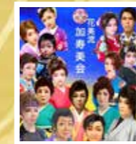
はなみりゅう かすみかい 加寿美会