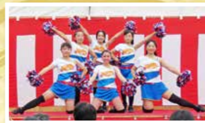
チアダンスサークル Shinys