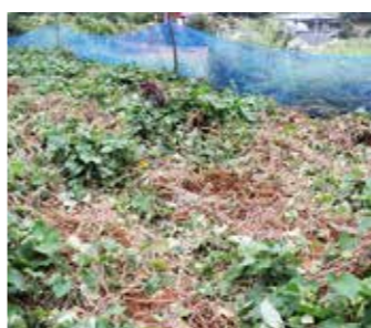
イノシシによる食害

イノシシは繁殖力が強く、一度の出産で平均4〜5頭産むため、他の鳥獣と比べて急速に頭数が増えるのが特徴です。村では普代村鳥獣被害対策実施隊を設置し、被害報告や目撃情報を受けると現場に駆けつけ罠を設置し、被害の軽減に努めています。