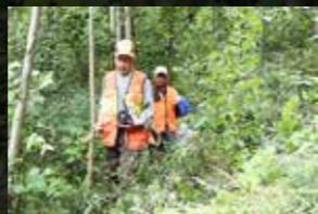
罠を設置に向かう猟友会

狩猟はかつて、「趣味・娯楽」の一環として捉えられていました。しかし、現在では自然環境の変化や、イノシシ・クマなどの生息数の増加により、農林水産業に大きな被害が出ていることから、「増加した個体数を調整する」という社会的役割を担っています。現在、久慈地方猟友会普代支会は11名で活動しています。