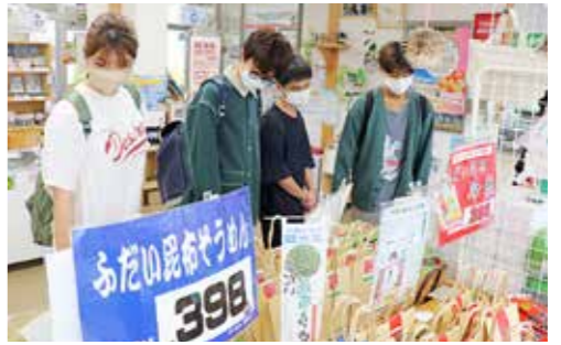
普代村の特産品に興味津々学生たち

でも地域活性化に向けて取り組んでいます。地域活性化について研究したいと思い大学に進学し、今回のプログラムに参加しました。普代村の自然や文化に触れて、課題やその解決策を考える貴重な体験になりました。行政や住民の皆さんと一緒に活性化の方法を考えていきたいと思っています」と力強く話していました。