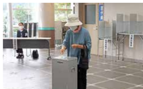
大切な1票を投じる有権者(第3投票所)