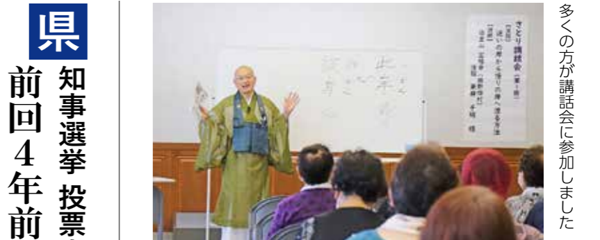
多くの方が講話会に参加しました