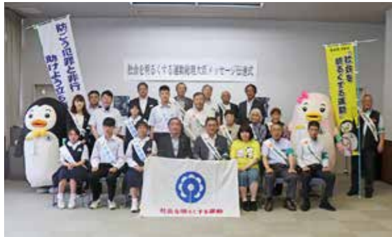
犯罪や非行を防止し、立ち直りも支える地域社会を目指しましょう

日時：7月22日（土）10:00～19:30 場所：普代村社会体育館特設ステージ