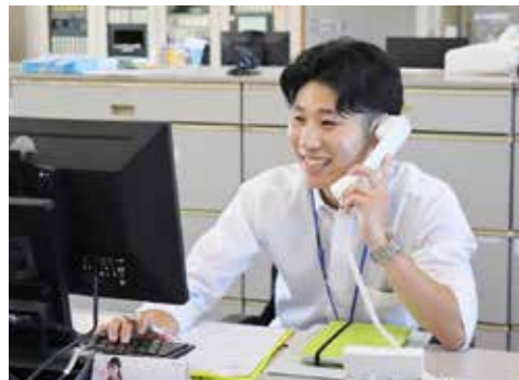
若い職員が頑張っています！一緒に働こう！

令和6年4月1日採用の役場職員採用試験を行います。 ▼職種および採用予定者数 ①上級事務若干名（昭和63年4月2日以降に生まれた人で大学以上を卒業（見込みも含む）した人） ②保健師若干名（昭和58年4月2日以降に生まれた人で保健師の資格を有している人、または資格取得見込みの人）