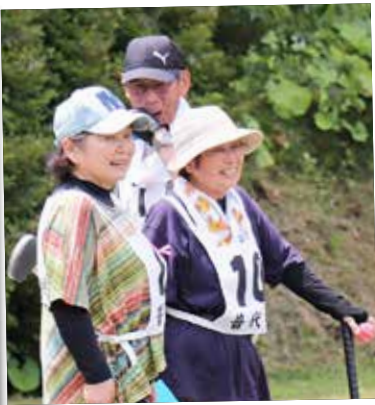
笑顔があふれたグラウンド