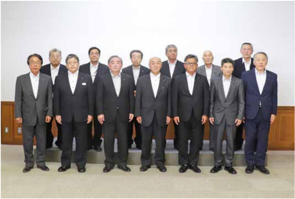
村の3役と10人の新議員で記念撮影