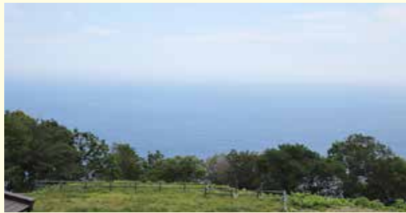
くろさき荘から眺める景色

ての行動を全面に出して、日々の業務に勤めております。来館されたお客様の話を聞きし、静かで、風光明媚な景色は良いし、新鮮な魚料理や昆布等の食事も大変良かったとの事で、大変うれしく思っております。また、ご年配のご夫婦や男性同士、女性同士、バイクでのツーリング、潮風トレイル等様々なお客様に旅館いただき、いろいろな話をし、以前に宿泊した時に良かったとか、旧館のことを知っていらっしゃる等リピーターの方が多数見受けられます。キャンプ利用のお客様にも丁寧に対応して再利用して頂きますよう努力しております。さらに、日帰り温泉の地元住民