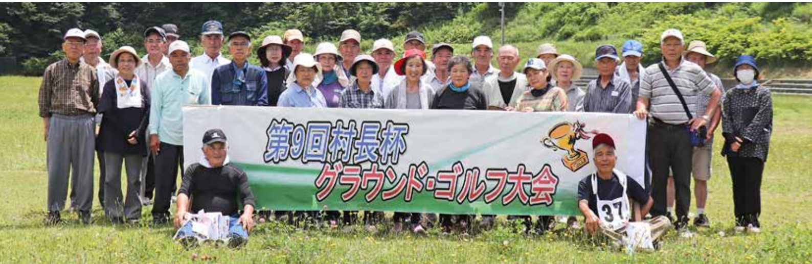
最後に皆さんで記念撮影しました