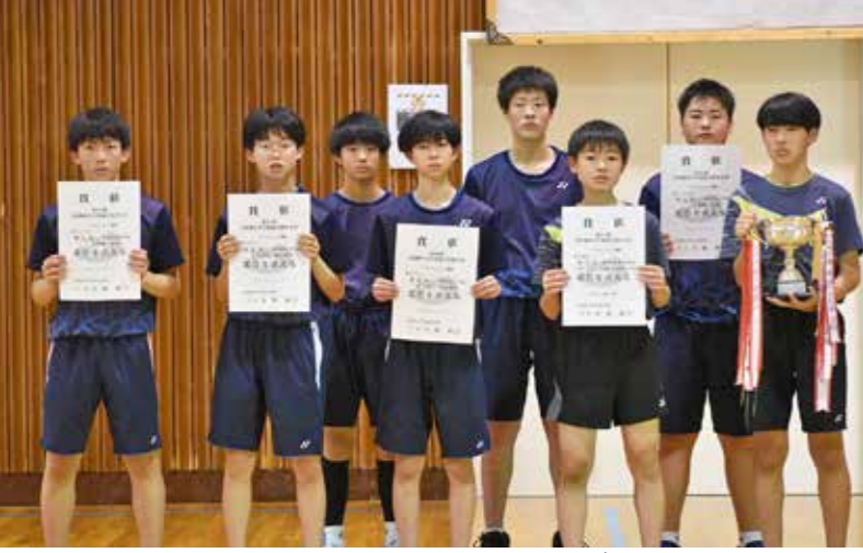
個人団体ともに県大会出場を決めた男子バドミントン部