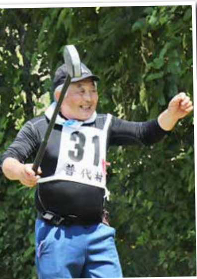
ナイスショットでガッツポーズ