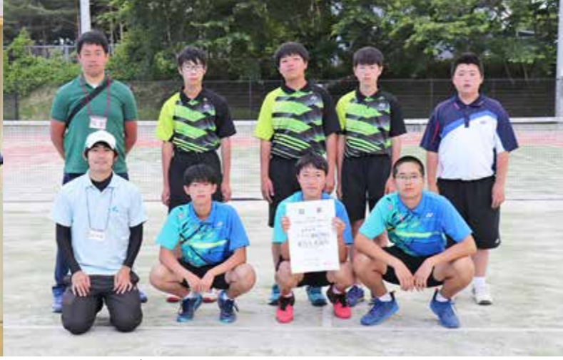
14年ぶりに団体県大会出場する男子ソフトテニス部