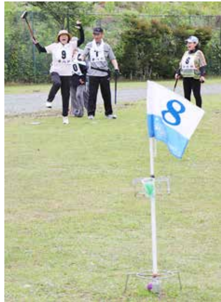
やったー!ホールインワン!

第9回普代村村長杯グラウンド・ゴルフ大会が7月9日、北緯40度運動公園多目的グラウンドで行われました。当日は朝方の雨模様だった天気も回復し、37人が出場。グラウンドには終始笑顔があふれてました。同大会の入賞者は次のとおりです。 ※カッコ内は総打数(敬省略)