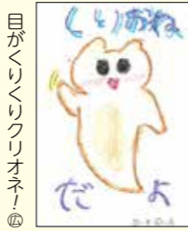
目がくりくりクリオネ！ 滝澤ひびきくん (久慈市・12歳)