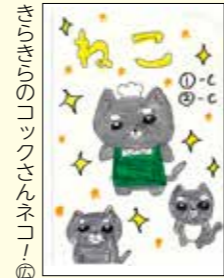
きらきらのコッコさんネコ④