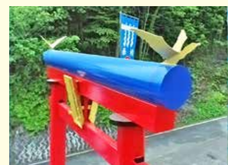
ドローンで撮影した鳥居の金色の鶴

り、ドローンを飛ばすにはDISP(ドローン情報基盤システム)へ飛行情報を登録しなければなりません。それでも飛ばすには理由があります。それは上空からの映像が見られるからです。例えば今度新しく建てられた鶴鳥神社の鳥居は下から見ても、とても大きく立派なものです。上に鶴(う)のオブジェがあり、それを上から見ると、とても大変な事です。そこで行けない場所へ飛ばせる(高度や障害物など色々な制限はありますが)。いつも見慣れている黒埼灯台も海からの映像等、今までは違う視