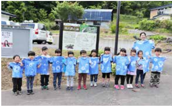
きれいに染まったTシャツに笑顔の子どもたち