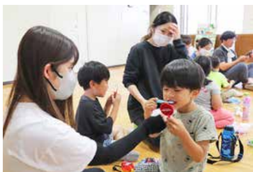
手鏡を使ってピンク色に染まった歯をきれいにしていくなら

シング指導では園児の歯に染め出し液を塗ると、磨き残しのある箇所がピンク色に染まりました。手鏡で確認しながらブラッシングし、保護者や先生が仕上げ磨きをしました。最後に、村の食生活改善推進員から歯に良いおやつ、歯科診療所から記念品をもらいました。