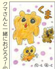
クマさんと一緒におどろろ④