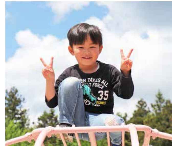
がくとくん (はまゆり子ども園さくら組)