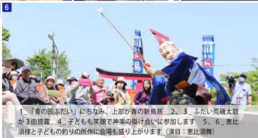
1_「青の国ふだい」にちなみ、上部が青の新鳥居 2、3_ふだい荒磯太鼓が3曲披露 4_子ども笑顔で神楽の掛け合いに参加します 5、6_恵比須様と子どもの釣りの所作に会場も盛り上がります (演目: 恵比須舞)