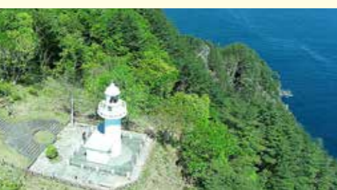
上空 20 mから撮影した黒埼灯台