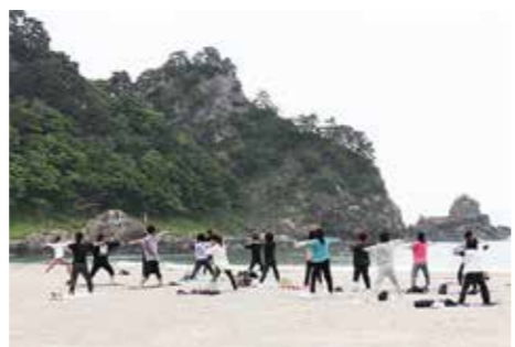
5月28日に開催したビーチヨガの様子

普代浜園地キラウミ南浜（浜の産直きらうみ側）でビーチヨガを開催しております。 ▼開催日時 5月～9月の最終日曜日（5月28日、6月25日、7月30日、8月27日、9月24日） ▼参加料 1回1000円 ※村内で使える1000円分のクーポン付きです。 ▼持ち物 ヨガマット（大きめのバスタオル可）、フェイスタオル、飲み物 ▼その他 予約不要。ヨガマットの貸し出しを希望する場合は、事前予約をお願いします。 ▼問い合わせ先 村観光協会事務局（☎35-2115）