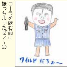
コーラを飲む前に 振っちゃったぜ④