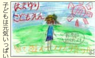
子どもは元気いっぱい④