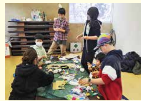
みずき団子作りを開催しました

国籍や文化などがバラバラな人たちが出逢い、選択肢や視野を広げてよりよく過ごせるよう活動していきます。具体的には、村の中にカフェ兼図書室兼キッズスペース兼...という感じで、様々な機能を持たせた憩いの場を作ること。そしてその場所だけでなく村内の様々な場所で、様々なイベントを行うこと。大きくこの二つを軸に活動し、村内をもっと盛り上げていこうと思っています。