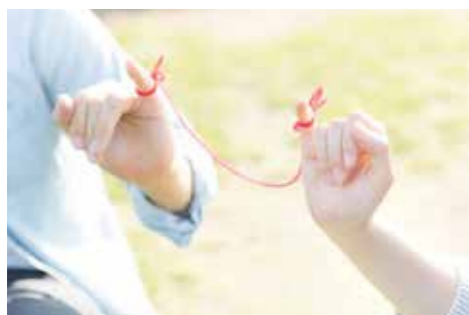
すてきな出会いを応援します

いきいき岩手結婚サポートセンター(i-サポ)は、県や県内全市町村などが連携し、(公財)いきいき岩手支援財団が運営している施設です。会員登録制により、理想のパートナー探しやお見合いの場などを提供しています。 村では、i-サポへの入会登録料1万円(2年間有効)を全額助成しています。 ◆対象者 村に住所登録のある人 ◆入会手続き i-サポで手続きができます。事前に予約(☎0193-65-7222)をお願いします。 ◆問い合わせ先 助成に関する問い合わせは、役場政策推進室(☎35-2114)まで。