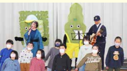
地域活動に参加しながら村民と交流を深めます

作り上げることの楽しさも感じていきます。また、各地区のサロンや集まりに参加して村の中心部以外での活動を増やしています。公民館等でのイベントも企画していますので、近くでイベントをする際はぜひ遊びにいらしてください。