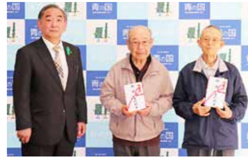
榎屋村長より88歳の長寿祝金の贈呈