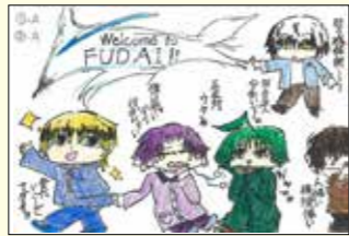
普代はいつでも待っているよ!!