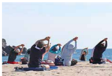
青空の下、波の音を聞きながらビーチヨガ

今年も普代浜園地キラウミ南浜(浜の産直きらうみ側)でビーチヨガを行います。 ◆開催日時 5月～9月の最終日曜日(5月28日、6月25日、7月30日、8月27日、9月24日) ◆参加料 1回1000円 ※村内で使える1000円クーポン付きです。 ◆持ち物 ヨガマット(大きめのバスタオル可)、フェイスタオル、飲み物 ◆その他 予約不要。ヨガマットの貸し出しを希望する場合は、事前予約をお願いします。 ◆問い合わせ先 村観光協会事務局(☎35-2115)