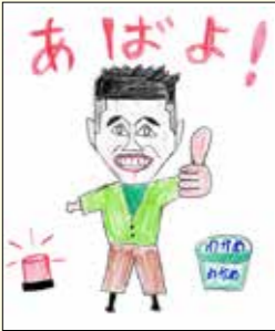
いい夢見ろよ! お前はこれのわかめじゃっ!