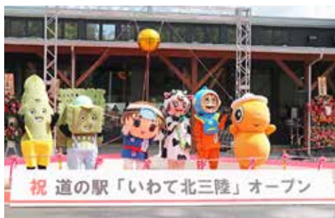
各市町村のマスコットも開業を喜びます。

ズブリと並んでいます。道の駅「いわて北三陸」は北三陸の「海・山・里・ひと」をつなぐ交流拠点を目指します。