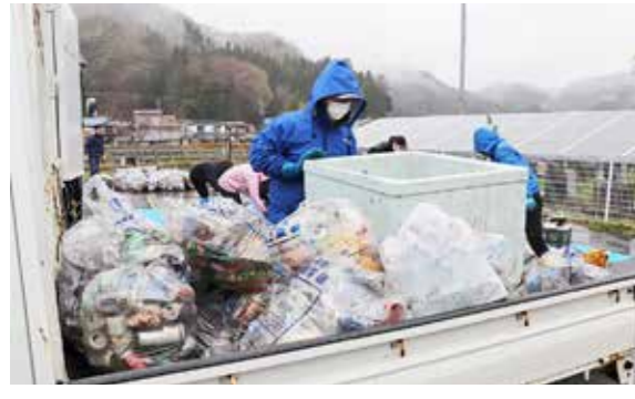
雨の中、多くのごみが役場裏に運ばれました

春のしめやかな雨が降る4月16日、ごみのポイ捨て撲滅を目指した村内一斉ごみ拾い「クリーンアップ大作戦」を行いました。 当日は、あいにくの雨となりましたが、朝早くから各地区では、住民の方々が村指定のごみ袋などを片手に約1時間かけて、道路脇に捨てられた空き缶や紙く