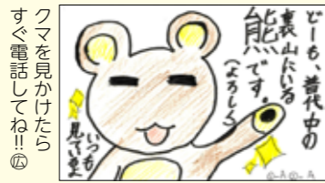
クマを見かけたらすぐ電話してね!!