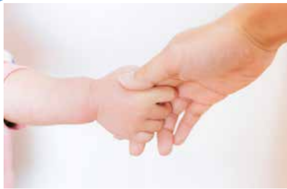
大切な家族のためにも、ぜひ検診を受けましょう

◆子宮頸がん検診 5月29日(月)、30日(火) 女性のがん「乳がん」「子宮頸がん」にかかる人が増加しています。 どちらのがんも、初期は自覚症状がほとんどみられないため、早期発見・治療をするためには検診を受けることが大切です。自分や大切な家族のために、ぜひ検診を受けましょう。