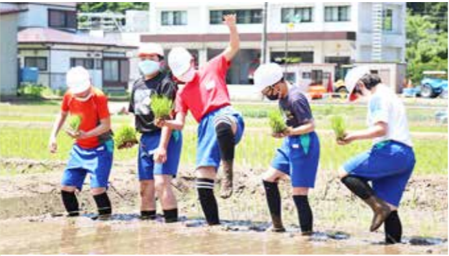
昨年6月の普代小学校5年生による田植えの様子

※農振除外とは？ 農業振興地域（農業の振興を図るべき地域）内には、優良な農地の保全のため農業以外での利用が制限される「農用地区域」があります。農用地区域内の農地を農地以外に使用するとき、農地転用の許可申請前に農用地域からの除外手続きが必要となります。このことを一般的に「農振除外」といいます。