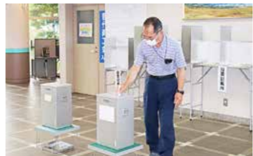
大切な一票を投じる有権者