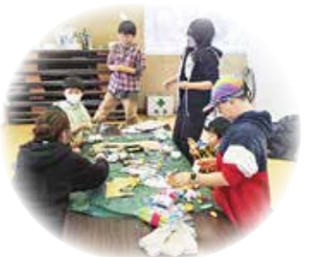
みずき団子作りの様子

もらいながら、アドベントカレンダーを作るイベントやみずき団子作り、映画会などを開催しました。 私は小説を書いたり、絵を描いたり、音楽活動が趣味です。それも生かしながら、今後も地域イベントを開催し、地域の皆さんと交流を深めていきたいと思っています。 今後の目標 地域の皆さんと少しずつ関わりができていく中で、皆さんがどうしたら普代を盛り上げることができるか、楽しい魅力的な場所にできるかを考えていても、それを共有したり話し合う場が少ないことがもったいないなと感じています。もしそれがあつたら、もつといるんなことができると思っています。そのためにも、1カ月に1回ぐらい、みんなが気軽に集まり、話せる場を作っていきたいと思っています。