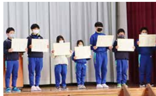
優秀な成績を収めた皆さんが表彰されました