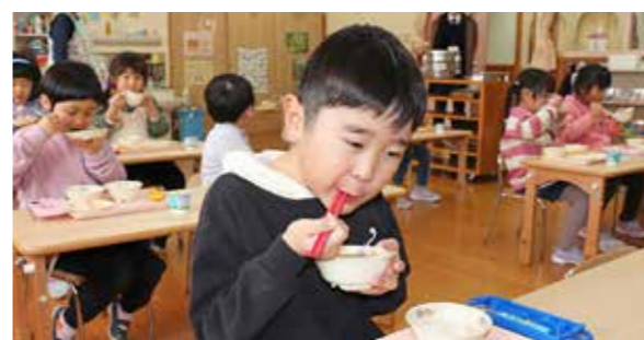
お味噌汁をおかわりする園児もたくさんいました

しましょう」と教えられた園児たちは、立派に成長したハウレンソウを刈り取りました。また、収穫後に中村さんから「今日のハウレンソウの糖度は12度。これはイチゴと同じぐらい甘いんだよ」と教えられ園児たちは驚いた様子でした。 収穫したハウレンソウは、次の日の給食でお味噌汁で提供され、園児たちはおいしそうに頬張っていました。