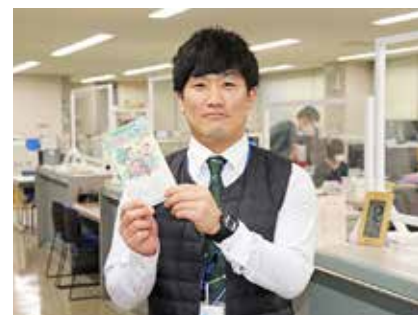
分からないことは、お気軽にお問い合わせください

◆住民福祉課から 国民健康保険の届け出を忘れずに 国民健康保険（以下、国保）は、74歳までの人で社会保険（以下、社保）の被保険者およびその被扶養者、後期高齢者の被保険者を除くすべての人が加入する制度です。退職などで社保から抜けた人は、国保に加入する必要があります。資格取得の届け出が遅れると、社保の資格喪失日まで遡って課税されますので、早めに手続きしましょう。 ▼社保などに加入し、国保から脱退する人 社保などに加入した場合、国保の資格喪失届が必要で、届け出をしないと国保税が課税されたままで社会保険料と両方納めていることになりますので、忘れずに手続きしましょう。 ▼社会保険の被扶養者になれる場合もあります 同じ世帯に社保の加入者がいる場合、被扶養者として認定されることがあります。扶養認定ができるかどうかは、勤務先に相談しましょう。