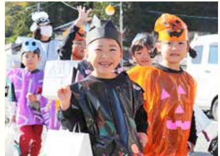
ハロウィンの企画で賑わいました（10月28、29日）