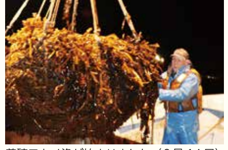
養殖ワカメ漁が始まりました（2月14日）