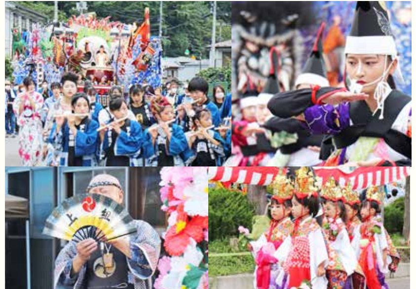
3年ぶりにふだいまつりが開催され、村中が活気に包まれました（9月2～4日）