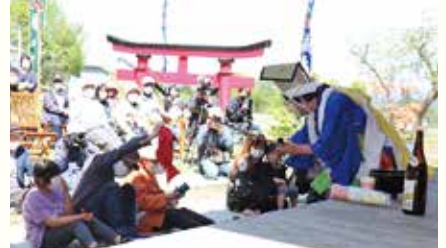
鵜鳥神社例大祭が行われ神楽が奉納されました（5月8日）