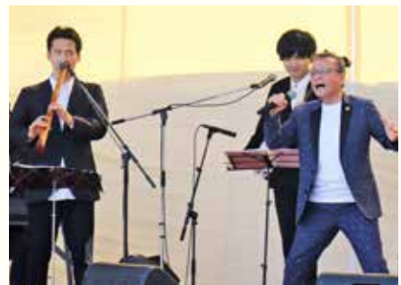
道の駅開業1周年記念イベント開催（9月24、25日）