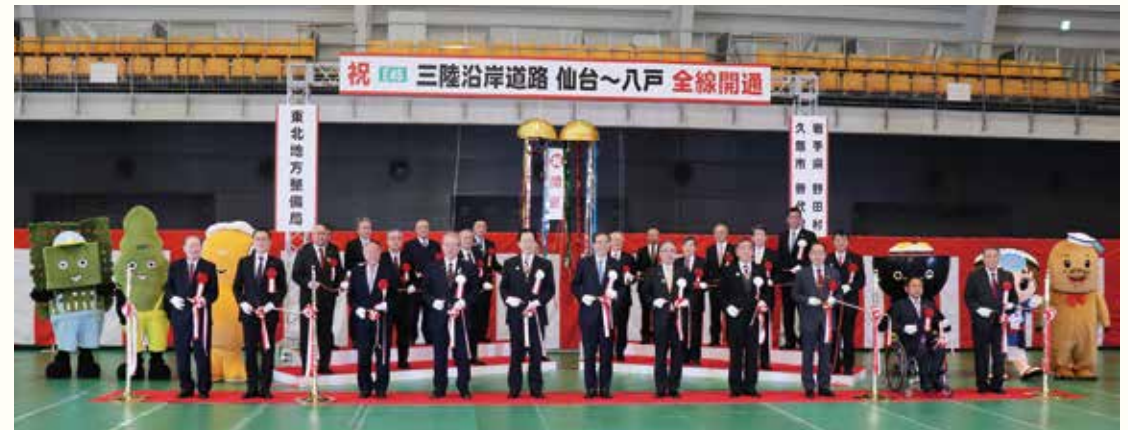
三陸沿岸道路が359km全線開通しました（12月18日）