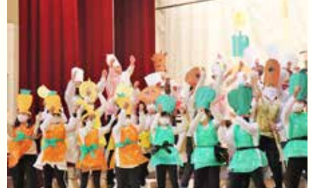
小・中学校合同でスクールフェスタ開催（10月22日）