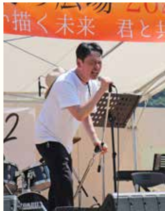
音楽の広場2022「ともに」が商店街で開催（7月30日）