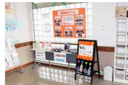
特設コーナーには村内の認知症カフェの活動なども紹介されています

認知症への理解をすすめる、本人や家族への施策の充実を図ることを目的に、9月は世界アルツハイマー月間として世界各国で啓発活動が行われています。 認知症になっても安心して暮らせる社会の実現に向け、理解を深めてみませんか? 村保健センターに、村社会福祉協議会の活動を紹介する特設コーナーが設置されていますので、お立ち寄りの際はぜひご覧ください。