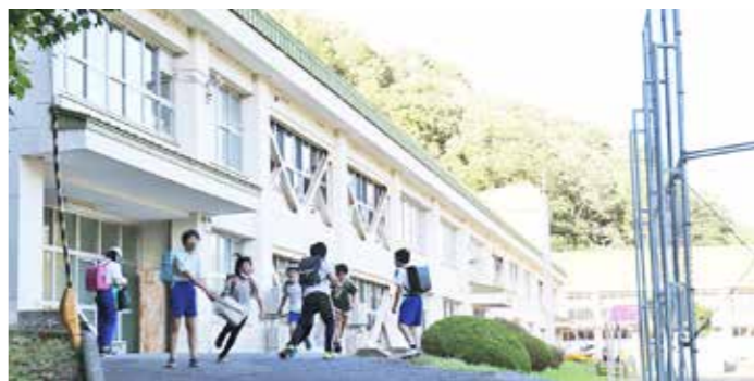
昭和43年に建てられ、子どもたちを見守ってきた普代小学校校舎

村では、2021年12月「義務教育学校建設プロジェクトチーム」(以下「プロジェクトチーム」という。)を、更には「普代村義務教育学校施設用地庁内検討委員会」(以下「検討委