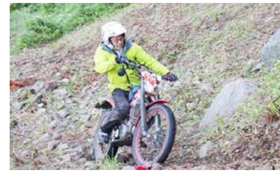
巧みなテクニックでコースに挑戦する参加者