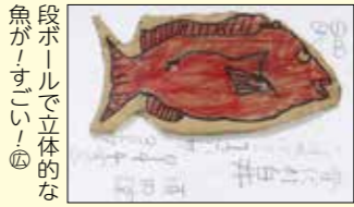
段ボールで立体的な魚が！すごい！ 須田玲皇くん (白井・7歳)