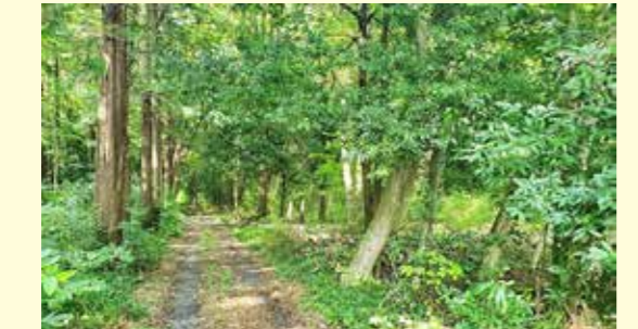
山林などの売買では忘れず届け出をしましょう

国土利用計画法では、乱開発を防ぎ、適正な土地利用のため、一定以上の大規模な土地取引を行った場合に届け出が必要になります。山林などの売買で1万平方メートル以上の取引の場合は、役場総務課（☎35-2111）までお知らせください。