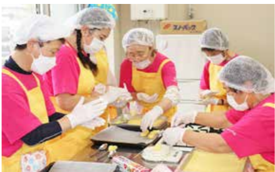
一つずつ丁寧に作りました

高齢者を対象とした配食サービスで手作りおやつを提供することで、利用者の楽しみを増やし季節を感じてもらうため、食生活改善推進委員協議会は9月8日、おやつ作りを行いました。 年3回実施予定で、2回目となる今回のおやつは「スイートポテト」。会員の皆さんは気持ちを進めながら、丁寧に料理を進めていました。また、秋の甘味がたっぷり詰まったさつまいもが使用され、調理室はおいしそうな香りでいっぱいでした。 ご家庭でも簡単に作れますので、ご家族で秋の味覚を堪能してみたいかがでしょうか。