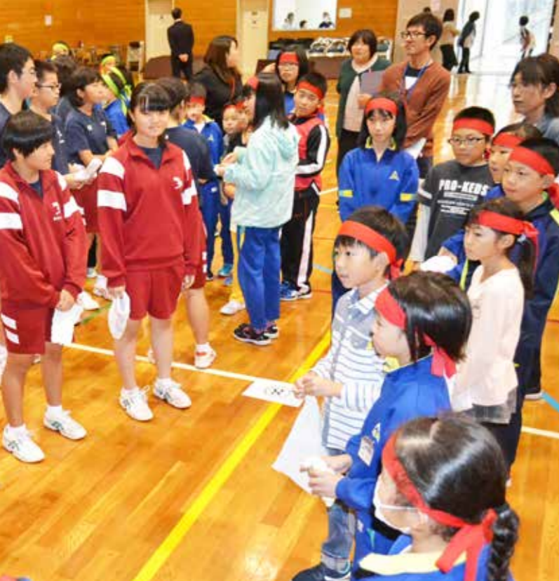
小中学生一緒に、様々な活動に取り組んでいます(写真はコロナ禍以前の活動の様子)