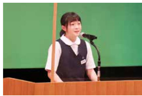
力強い語りで訴えかけます

皆さんは、ウミガメの性別がどのように決まるのかを知っていますか?卵の中にあるときの周りの砂の温度で性別が分かれるそうです。29度よりも低ければオスになりやすく、それよりも高いとメスになる可能性が高くなります。現在、ウミガメの性別比がメスに偏り、生態系が崩れ始めています。その原因は、私たち人間が大量のエネルギーを使用することによって引き起こされる地球温暖化で