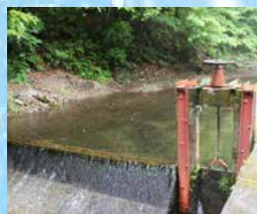
河川から原水を取り込みます