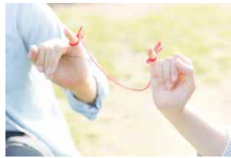
すてきな出会いを応援します

▼対象者 村に住居登録のある人 ▼入会手続き i・サポで手続きができません。事前に予約（☎0193・65・7222）をお願いします。 ▼問い合わせ先 助成に関する問い合わせは、役場政策推進室（☎35・2114）まで。