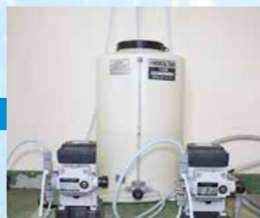
最後に塩素を入れます