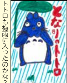
トトロも梅雨に入ったのかな？ 滝澤ひびきくん (久慈市・10歳)