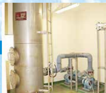
地下水は鉄分を取り除きます

原水に含まれている濁りやごみなどを取り除き、安心して飲めるきれいな水道水をつくっていきます。きれいになった水には、最後に塩素(次亜塩素酸ナトリウム)を入れて消毒し、配水池に送ります。