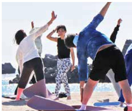
気持ちいい潮風の中でストレッチ