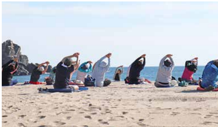
青空の下、波の音を聴きながらビーチヨガ