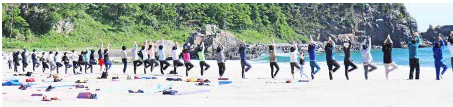
海を眺めながらバランス感覚アップ！