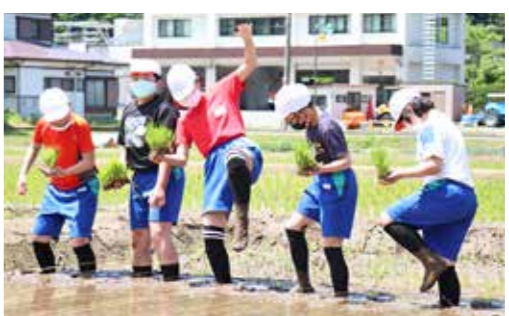
ぬかるみに足を取られながら田植えを体験

さを見せつけ、優勝しました。県大会は6月4日、大船渡市で行われ、釜石ファイターズと対戦。どちらが勝ってもおかしくない展開が続きましたが、3-4で惜しくも敗れました。それでも、県大会出場チームで一番少ない12人で戦い抜いた選手たちに、スタンドからは大きな拍手が送られていました。