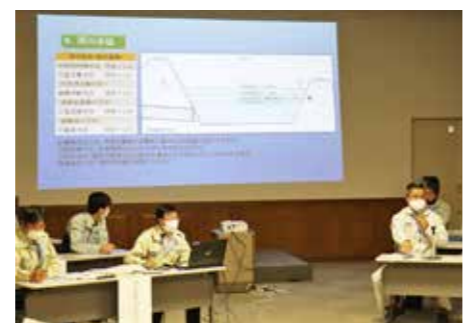
排水の仕組みについて説明しました