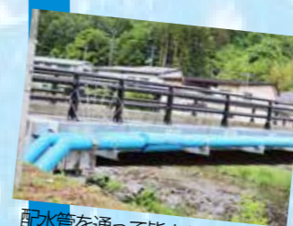
配水管を通過して皆さんのもとへ