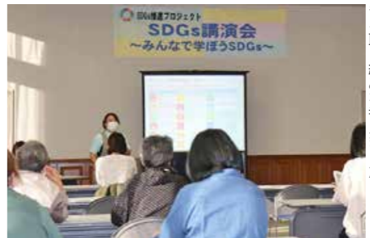
17の目標を聞き、日常生活で実践できる取り組みを考えました

紹介。参加者は自らが優先的に取り組みたい目標を選び、今できることを考えました。村内から参加した女性は「よく考えると日常生活に關わっていることが分かった。畑に出て体を動かすことは、健康になるし自給自足にもつながる。これもSDGsですね」と関心を高めていました。