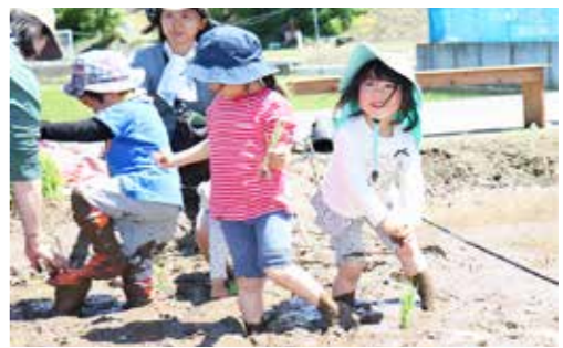
目を輝かせながら苗を植えました