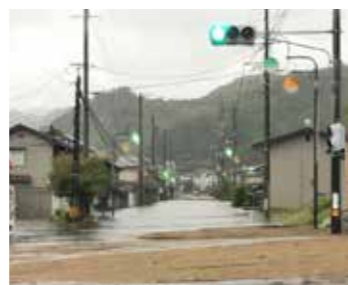
令和元年台風第19号災害で浸水被害が発生した上区地区

村は6月6日、役場大会議室で「上区地区排水施設整備事業説明会」を開催しました。昨年度に引き続き2回目の開催となった説明会では、設置する排水施設の仕組みや排水経路、整備前後の浸水範囲シミュレーション、今後の工事のスケジュールについて説明しました。整備完了は今年度末を予定