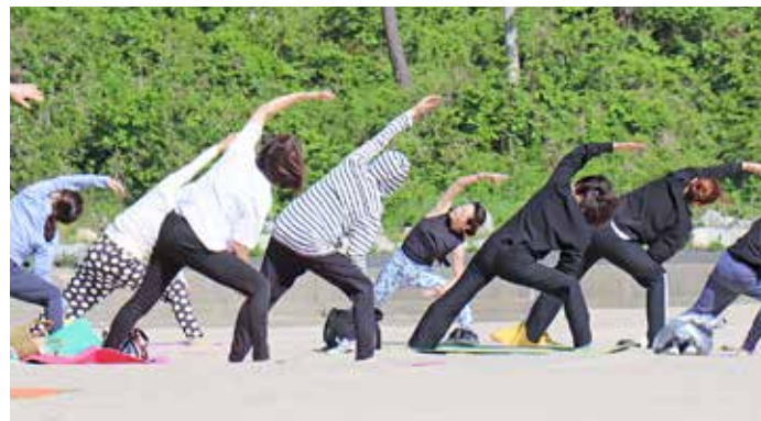
体の側面を伸ばしながら脚やせの効果も！