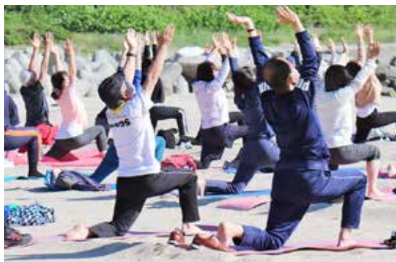
朝日を浴びながら三日月のポーズ