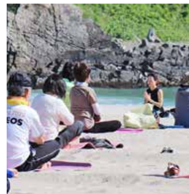
瞑想で自然に心を落ち着かせます