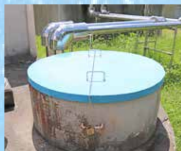
普代水源の浅井戸

水道水のもとになる水を原水といいます。村では、地下水と河川の水を利用しています。