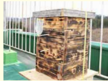
ミツバチの入居をお待ちしております!

早いもので普代に来て10か月が経ちました。鳥茂渡小学校跡地を使わせてもらえることになり、屋上に巣箱を置いてミツバチの入居を待っています。テレビや議会などによりなど取材していただいたこともあり、皆さまから「頑張ってるね!」などとお声がけいただけうれしいです。