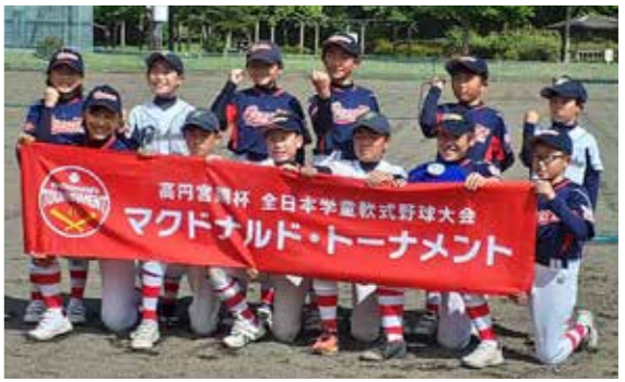
県大会に出場した普代オーシャンズと大川目わかば連合チーム