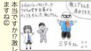
本当ですか!? 激レアすぎますね④