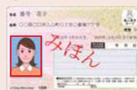
表 顔写真付き！対面での本人確認書類に

皆さんが申請をして、無料で交付されるプラスチック製のカードです。マイナンバーの他に、氏名、住所、生年月日、性別が記載されています。