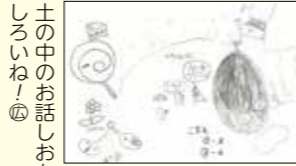
土の中のお話しおもしるうねー④