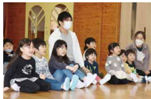
元氣よく「うれしいひなまつり」を歌う園児たち