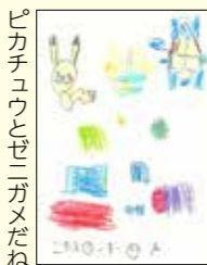
ピカチュウとゼニガメだね④