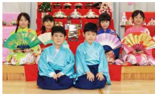
みんなで集合写真を撮りました