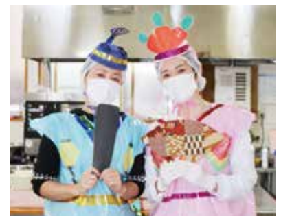
給食室のお内裏様とおひなさま