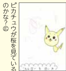
ピカチュウが桜を見ているのかな?④