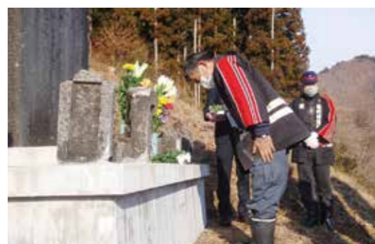
津波記念塔に菊の花を手向け、犠牲者の冥福を祈る消防団員