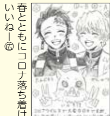
春とともにコロナ落ち着けばいつねー④