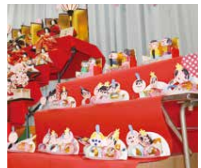
ステージに飾られたお内裏様とおひなさま