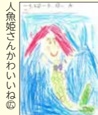
人魚姫さんかわいいね④