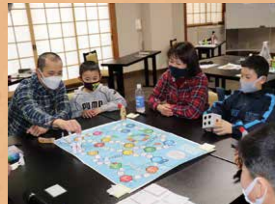
すごろくでSDGsについて学びました

学びました。 午前中は、村の人口や自然、産業について学んだあと、黒崎園地に繰り出し、森林の役割について学習しました。 午後からは、国連地域広報センターが作成したSDGsすごろく「ゴー・ゴールズ」に挑戦。地球規模で直面している課題や未来を考えるクイズに答えながらゴールを目指し、SDGsについて関心を深めました。