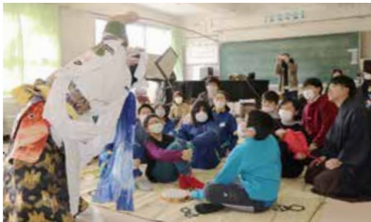
恵比寿様とタイのやり取りを楽しむ児童たち