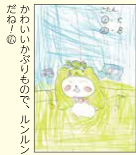
かわいいかぶりもので、ルンルンだね！④