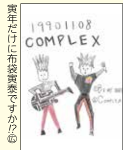
寅年だけに布袋寅泰ですか？④