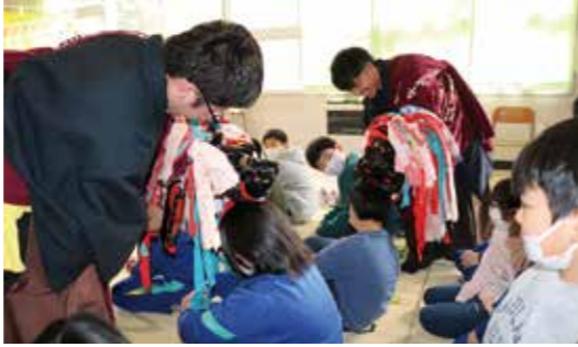
頭をかじってもらい、邪気を払いました

普代小学校の4年生14人の総合的学習「子ども神楽宿」が1月25日、同校の音楽室で行われました。