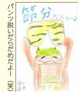
パンツ脱いだらだめだよー(笑)④