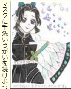
マスクに手洗いうがいを続けよう！④