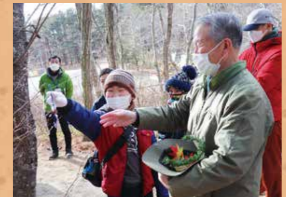
森林の動きをゲームで学ぶ子どもたち

SDGsすごろく「ゴー・ゴールズ」は、国連広報センターのホームページから、遊戯版やコマ、サイコロの手作りキットをダウンロードできます。みんなで楽しく遊びながら、SDGsについて学んでみませんか？