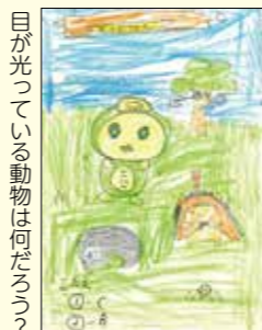
目が光っている動物は何だろっ？④