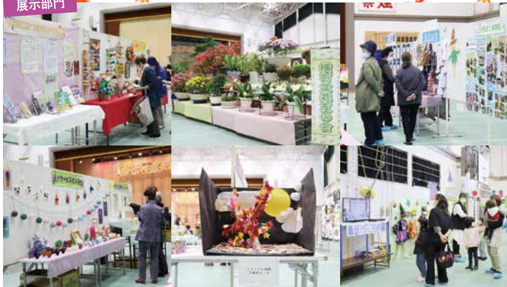
普代社会体育館には、1,115点の作品が展示され、はまゆり子ども園運動会や普代スクールフェスタのビデオ上映も行われました