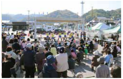
アトラクションには多くの観客が詰め掛けました