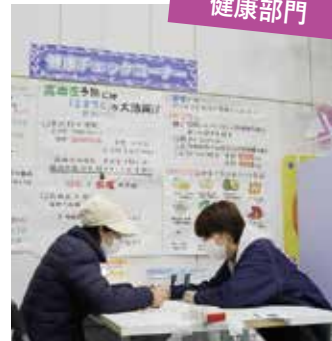
健康相談をする来場者