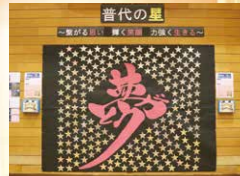
村民の皆さんから、人生や生き方のメッセージを「星」に描いていただきました