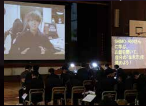
Shimo-Ren(下長根蓮)さんとの学習会