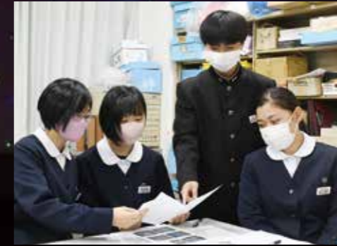
企画を練る生徒会執行部のメンバー