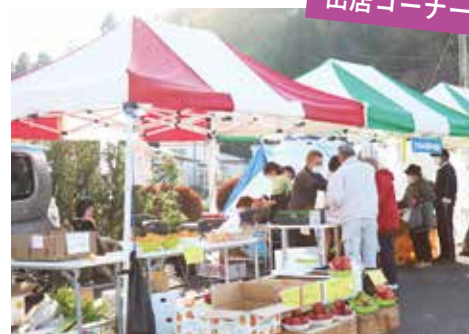
お買い物客でにぎわう商店