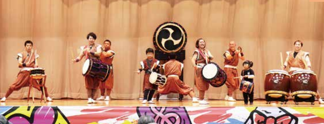
一糸乱れぬばちさばきで、観客を魅了したふだい荒磯太鼓