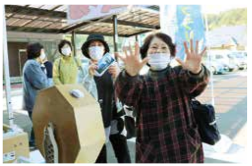
目玉企画ガラガラ抽選会。当たりが出て喜び来場者

新型コロナウイルス感染症の影響で延期となっていた「道の駅青の国ふだい」の開業記念イベントが10月30、31日の両日行われました。 会場では、静岡県河津町の特産品販売や矢巾町産直右京の会による矢巾町フェア、村生活研究グループのコンプレックス汁販売（いずれも30日）、アンテナショップあい