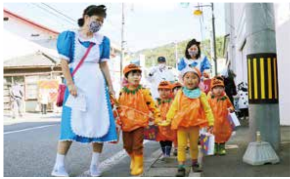
仮装をして商店街を練り歩く園児と先生たち