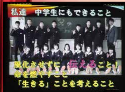
自分たちができることを胸に刻んだ普中生