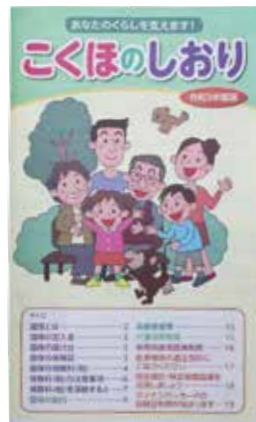
手続きをお忘れなく!