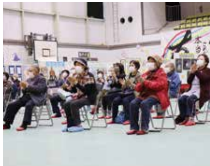
ステージ発表に拍手喝采