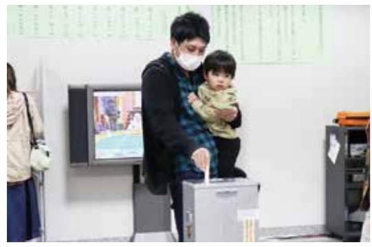
大切な一票を投じる有権者（第3投票所）

第49回衆議院議員総選挙と最高裁判所裁判官国民審査の投票が10月31日、村内10カ所の投票所で行われました。村の投票率は71・85%で、前回を0・65%上回り、県内で2番目に高い投票率でした。 開票は午後8時から役場の3階で行われ、小選挙区（岩手2区）選出議員選挙では、