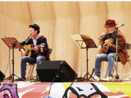
アンコールが沸き起こった the meat & police とりもバンド plus の音楽演奏