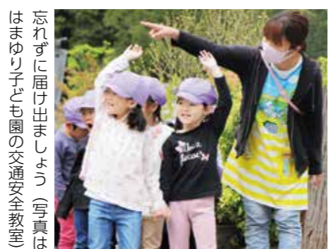
忘れずに届け出ましょう(写真ははまゆり子ども園の交通安全教室)

▼届け出に必要なもの 郵送する現況届、受給者本人と対象児童の健康保険証の写しまたは年金加入証明書、印鑑(認印可)※その他必要に応じた書類 ▼届け出期間 6月1日(火)～30日(水) ▼届け出・問い合わせ先 役場住民福祉課(☎35・2113)