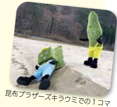
昆布ブラザーズキラウミでの1コマ

乗務してきました。その中で、地方ならではの人の温かさや食の美味しさを魅力的に感じていました。そして私自身、富山の地方出身であることから「いつか地方に身を置いて仕事したい」という思いがありました。現在は、ラジオやSNSを使い、観光分野の情報発信や「昆布ブラザーズ」関連の仕