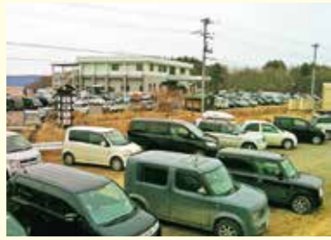
車で埋め尽くされた高台の運動場

当時私は久慈市の印刷会社に勤めていました。午後2時46分、大きな揺れを感じ、誰かが「大津波警報が出た！」と大きな声で叫びました。それからみんな仕事を止めて急いで車に乗り、長内町の高台にある運動場に避難しました。停電のため信号機は機能しておら