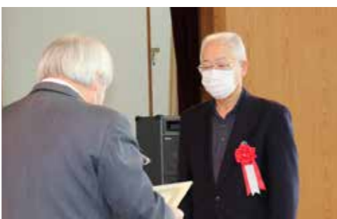
福祉活動に貢献している16人が表彰されました