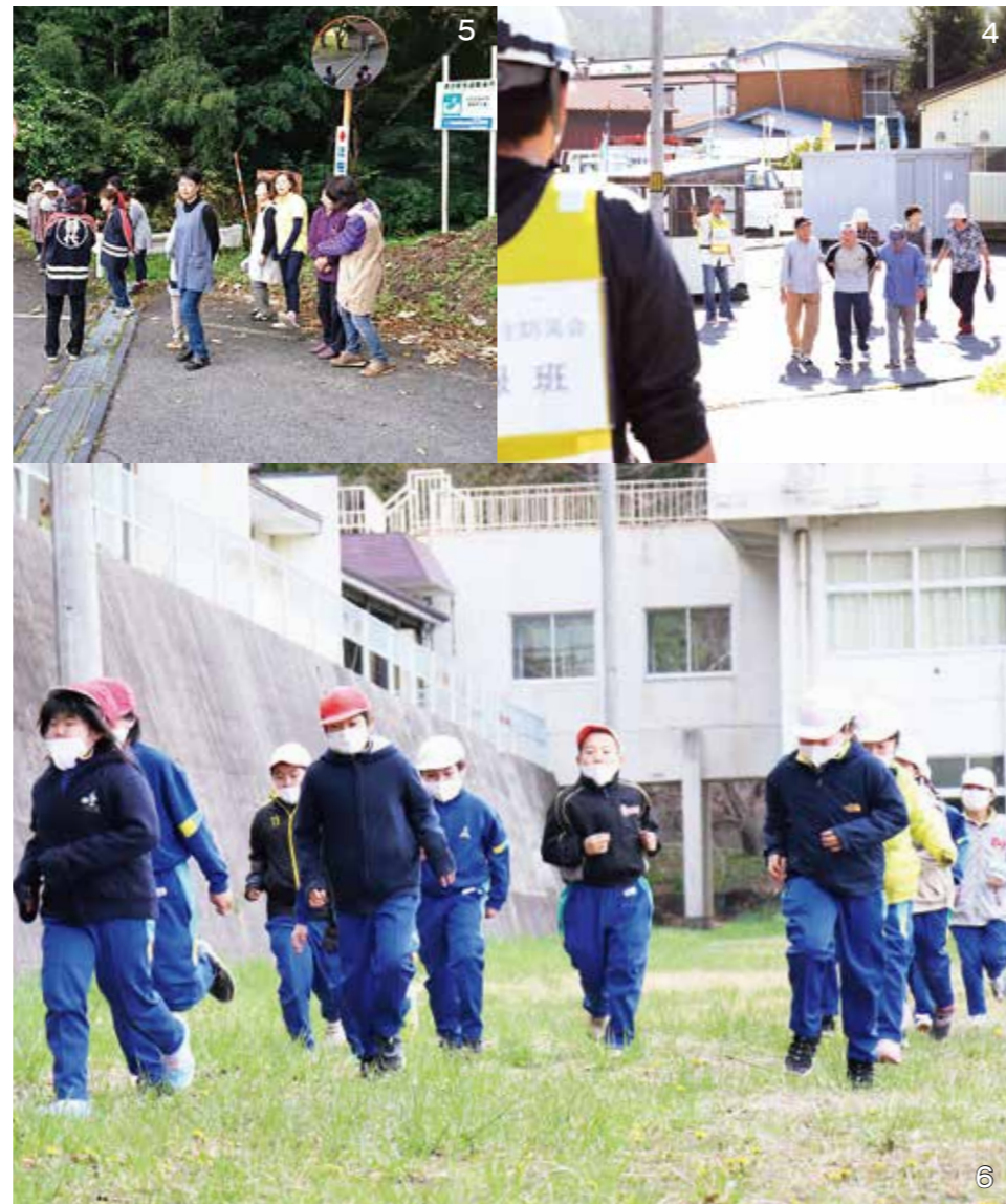
1_震災から6年目。追悼イベント「キャンドルナイト～鎮魂の灯り～」(H29.3.11) 2_キャンドルの灯りを見つめる子どもたち (H28.3.11) 3_防災を考える日イベントでの避難所運営ゲーム(HUG)研修会 (H30.3.11) 4_久慈広域で連携して行った総合防災訓練 (H27.9.27) 5_村防災訓練で緊急指定避難場所に避難する太田名部地区の皆さん (H29.9.24) 6_普代小の津波避難訓練 (R2.4.22)