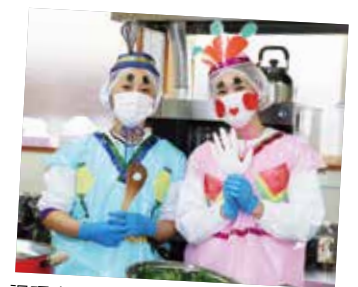
調理室のイケメン？お内裏さまと美しい？おひなさま