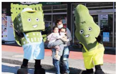
普代駅で来場者と記念撮影

村のご当地キャラクター「昆布ブラザーズ（すつきい、えんぞー）」が3月2日、TBS、JNN系列の全国放送「マツコの知らない世界」に出演しました。