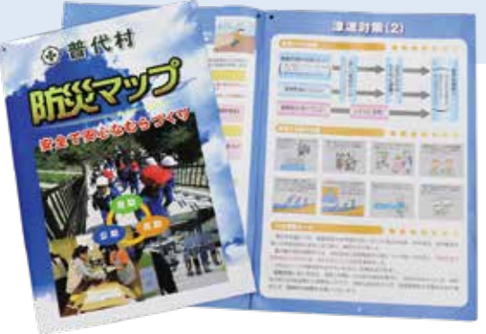
村の防災マップを今一度確認してみましょ

す。「どこに避難するか」「どこに集まるか」など確認しておきましょ。小さい子どもがいる家庭では、地域を実際に歩いて避難経路を確認することも大切です。 大災害が起こると、電話が被災地に集中してつながりにくくなります。自宅に避難場所を書いた張り紙を張って安否を確認する、災害用伝言ダイヤルを利用するなど、家族で連絡を取り合う方法も考えましょ。