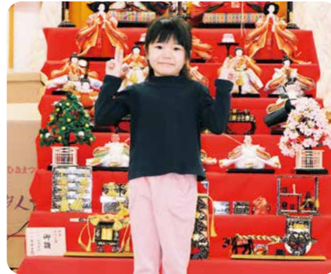
るりせちゃん (はまゆり子ども園さくら組)