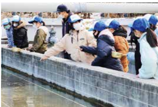
餌をまき、指をさしながら観察する児童たち

の後ふ化場に移動して給餌体験を行いました。 餌をまくと一斉に群がる稚魚に興奮した児童たちは、水槽をのぞき込んだり、遠くに餌を投げたりしていました。 その後漁協の職員から、ふ化の仕組みなどの説明を受けた児童たち。熱心にメモを取り、学びを深めた様子でした。