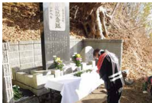
津波記念塔に菊の花を手向け、犠牲者の冥福を祈る消防団員

津波記念塔に刻まれた教訓 一、大地震の後には津波が来る 一、地震があったら高い所へ集まれ 一、津波に追われたら、どこでも此所位より高い所へ 一、遠くへ逃げては津波に追付かる、近くの高い所を用意しておけ 一、県指定の住宅適地より低い所へ家を建てるな