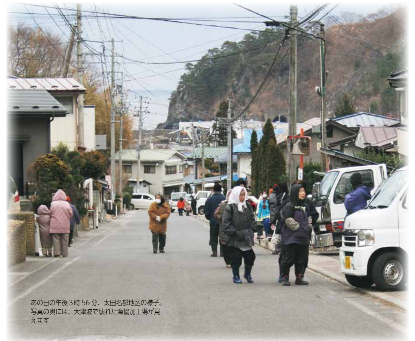
あの日午後3時56分、太田名部地区の様子。写真の奥には、大津波で壊れた漁協加工場が見えます

3月11日で東日本大震災から10年が経過しました。当たり前前の日常が一変したあの日。人々はどうのよう行動し、どのような今を過ごしているのでしょうか。あの日を今一度思い出し、共に明日を考えたい——。ここでは、7人の皆さんに当時を振り返ってもらい、今、そしてこれからのを伺いました。