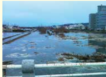
久慈川を遡上する津波