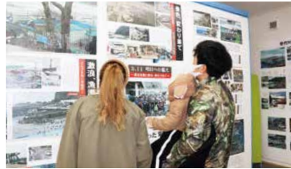
震災記録写真を見つめる来場者（普代駅）

役場1階のエントランスホールと普代駅の情報発信スペースで、震災記録写真と災害備蓄品を展示（3月31日まで）。写真展では、大津波の記録写真や復旧作業、復興の様子を撮影した写真約100枚を展示しています。