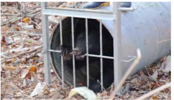
捕獲されたツキノワグマ