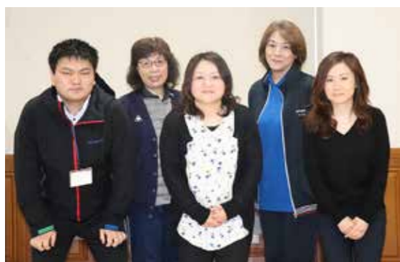
私たちと一緒に村の皆さんの健康を守りましょう

▼合格発表 ①1次試験：7月上旬 ②2次試験：7月下旬 ※採用予定日は10月1日ですが、欠員の状況によっては、別の日に採用される場合があります。 詳しくは、役場総務課(☎35-2111)まで。