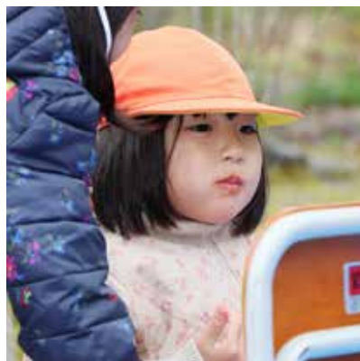
園児の口はオレンジ色に