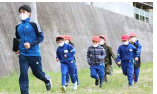
先生に誘導され、真剣な表情で避難する児童たち

普代小と普代中の津波避難訓練が、4月22日と27日にそれぞれ行われました。児童生徒は、三陸沿岸道路普代バイパス沿いにある避難場所までの経路を再確認するとともに、素早い避難行動の大切さを学びました。