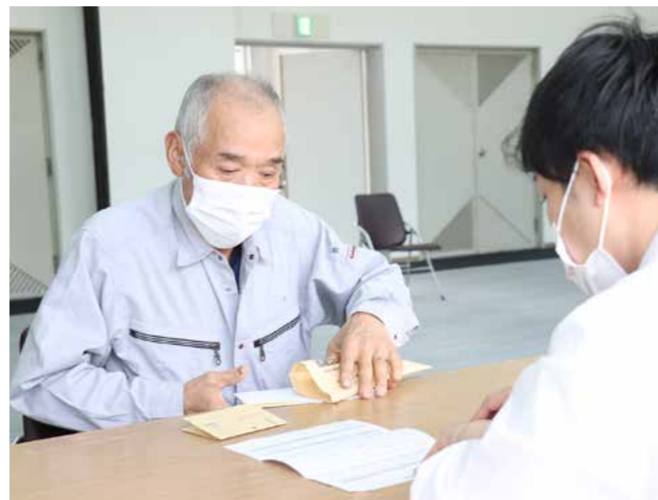
5月12日、13日に行われた地区巡回受け付けの様子（自然休養村管理センター）