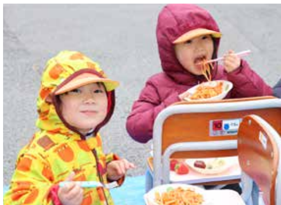
スパゲッティおいしいな～