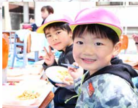
お友達と仲良く食べました