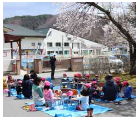
和やかな給食時間になりました