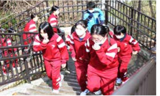
避難場所を目指し階段を上る生徒たち