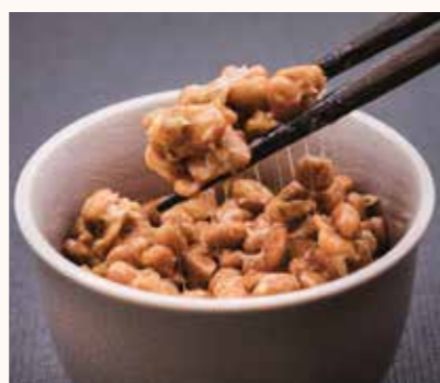
発酵食品を食べて、腸内環境を整えましょう

毎日の食事は免疫力に大きく関係します。免疫細胞の多くは腸にいます。腸内には免疫細胞を活性化させる食べ物を食べれば、免疫力を高めることにつながります。そこでぜひ食べてほしいのは「キノコ類」とみそや納豆、ヨーグルトなどの「発酵食品」。