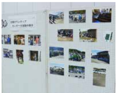
ボランティア活動の写真展示

第17回歳末たすけあいチャリティー演芸会・第16回ボランティアフェスティバル（村社会福祉協議会など主催）が12月15日、社会体育館を会場に行われ、各地区の婦人会や各種団体がこぞって芸を披露しました。 ふだい荒磯太鼓のメンバーによる威勢のいい掛け声と迫力ある太鼓の音で始まった演芸会は、歌や踊り、音楽演奏などが次々に繰り広げられ、詰めかけた約200人の観客を魅了しました。 体育館の後方には、村民生児童委員の皆さんにより休憩スペースが設置され、台風19号災害ボランティアセンターの様子やボランティア活動の写真展示も行われました。また、災害義援金の募金箱も設置され、多くの募金が寄せられました。 この演芸会は、毎年歳末たすけあい運動の一環で実施されていて、演芸会の入場料や皆さんから寄せられた募金は、地域福祉の向上に役立てられます。