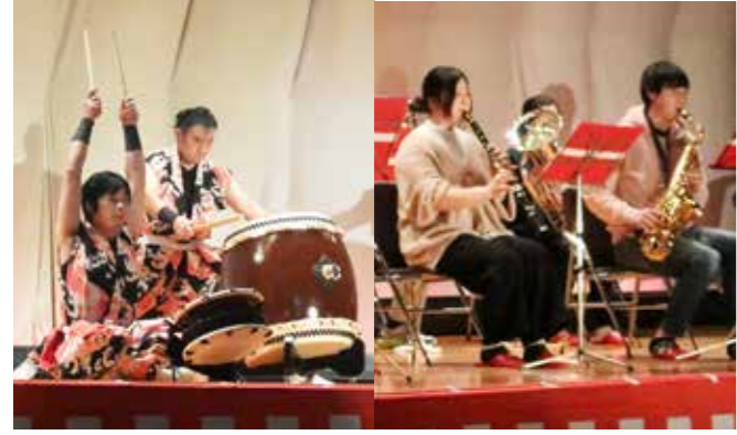
ステージでは、多彩な催しが繰り広げられました

第17回歳末たすけあいチャリティー演芸会・第16回ボランティアフェスティバル（村社会福祉協議会など主催）が12月15日、社会体育館を会場に行われ、各地区の婦人会や各種団体がこぞって芸を披露しました。 ふだい荒磯太鼓のメンバーによる威勢のいい掛け声と迫力ある太鼓の音で始まった演芸会は、歌や踊り、音楽演奏などが次々に繰り広げられ、詰めかけた約200人の観客を魅了しました。 体育館の後方には、村民生児童委員の皆さんにより休憩スペースが設置され、台風19号災害ボランティアセンターの様子やボランティア活動の写真展示も行われました。また、災害義援金の募金箱も設置され、多くの募金が寄せられました。 この演芸会は、毎年歳末たすけあい運動の一環で実施されていて、演芸会の入場料や皆さんから寄せられた募金は、地域福祉の向上に役立てられます。