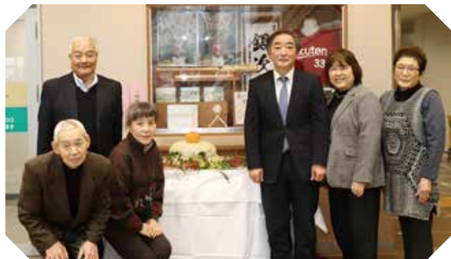
今年も大きな鏡餅を寄贈した産直右京の会の皆さん