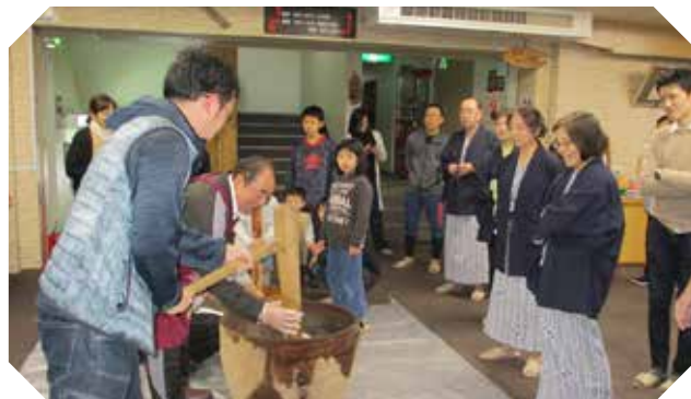
くろさき荘で行われた大みそか恒例の餅つき