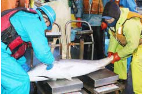
この日は特大のヒラマサが水揚げされました

「ヨイショ」の掛け声で鏡開きする関係者 その後関係者らによる酒だるの鏡開きと三本締めが行われ、今年一年の大漁を祈願しました。