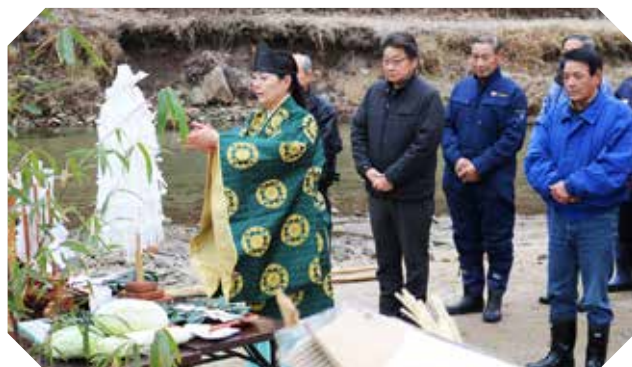
旭日区のだんと祭。無病息災と五穀豊穡を祈りました