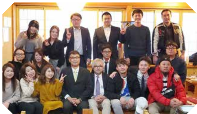
久しぶりの再会も。33歳の年祝いを迎えた皆さん