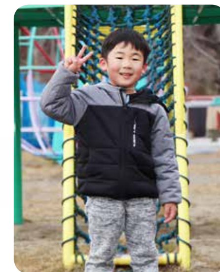
くまもとりはくくん (はまゆり子ども園さくら組)