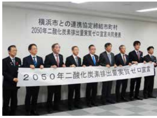
岩手県北9市町村の代表者が共同宣言しました

横浜市と再生可能エネル ギーに関する連携協定を締 結している岩手県北9市町 村（久慈市、二戸市、葛巻 町、普代村、軽米町、野田 村、九戸村、洋野町、一戸 町）は12月2日、2050 年までに二酸化炭素の排出 量ゼロを目指す共同宣言 しました。 平成31年2月、岩手県北 9市町村を含む東北の12市