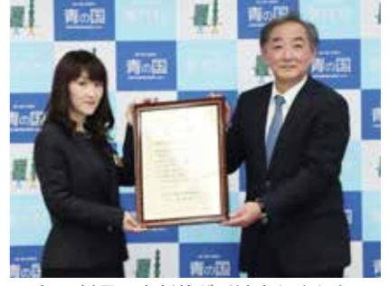
榎屋村長に表彰状が手渡されました

また、12月17日には、第 36回村交通安全ポスター コンクールの表彰式が、役 場3階大会議室で行われ ました。安全教育の一環と して、小中学生に交通安全 の意識を高めてもらう目 的で行っている同コン クールの今年度は横断歩道 の安全な渡り方や飲酒運 転の撲滅などに関するポ スターを描いた小中学生 14人が表彰されました。