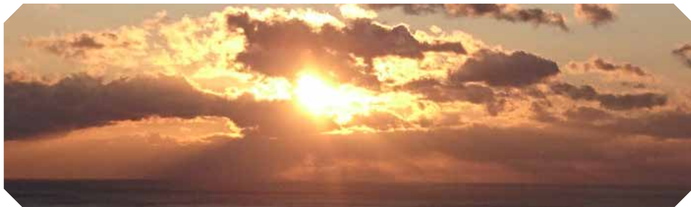
雲の切れ間から鮮やかな陽光が差し、清々しい新年を迎えました