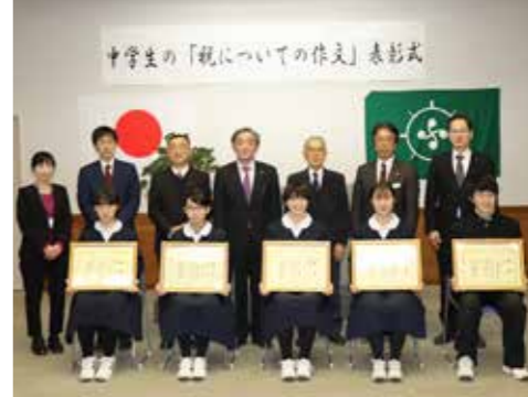
税の作文で表彰された皆さんと関係者

び、それぞれの思いを文章 に起こしていることを頼も しく思いました」と講評。 その後入賞者それぞれに表 彰状が伝達されました。 同コンクールは、中学生 の皆さんに税に関する正し い知識を養ってもらうこと を目的に、昭和58年度から 実施されています。 表彰された人は次のとお りです。 ◇税の作文▽最優秀賞