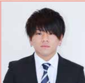
上下 一総 (上区)