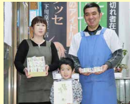
復興支援に感謝する下川原商店の皆さん

昨年10月、村に甚大な被害を及ぼした台風第 19号。その復興支援として、日本航空（JAL） グループのジェイエア（大阪府池田市、高木淳取 締役）は1月10日から大阪伊丹発花巻行き の飛行機内のドリンクサービスで、下川原商店が製造 している「鼓舞焼き」を提供しています。