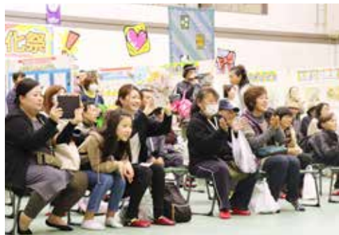
ステージ発表に拍手喝采