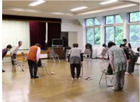
みんなで輪になり、音楽に合わせて体操