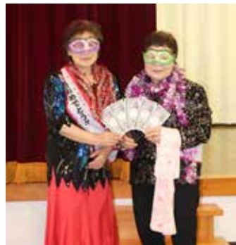
誕生月の人は派手な衣装で登場