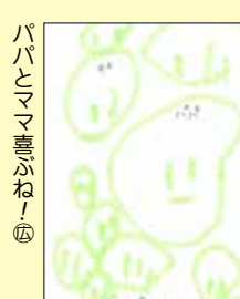
パパとママ喜ぶね⑥