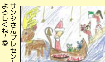
サンタさんプレゼント なっ⑥