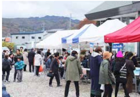
来場者でにぎわう村内の各商店