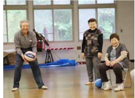
ボーリングゲームに挑戦