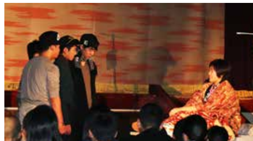
笑いと感動に包まれた演劇「さっちゃんの白い桜」