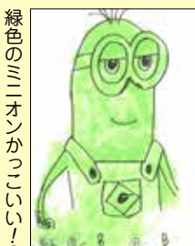
緑色のミニオンかっこいい⑥