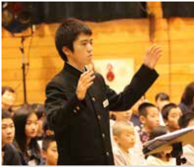
指揮者のもと、息の合った合唱を披露