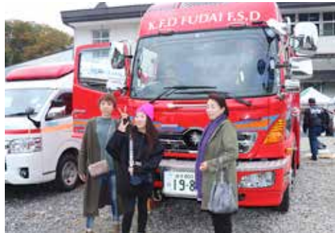
消防自動車乗車体験も行われました