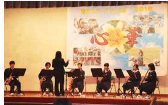
吹奏楽部は美しい音色を響かせました