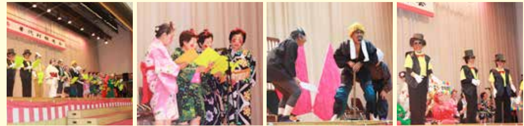
村敬老会では、迫真の演技を披露しました

介護予防教室「行くべえ〜」は、高齢者の仲間と一緒にシルバーリハビリ体操やレクリエーション（歌や演劇）などに取り組み、年齢と共に衰えてくる筋力や気力、認知機能の低下予防につなげることを目的に行っている事業です。仲間と練習に励み、作り上げた演劇は、9月20日の村敬老会で披露しました。