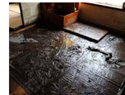
土砂流入による住家被害が深刻