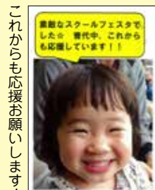
これからも応援をお願いします④