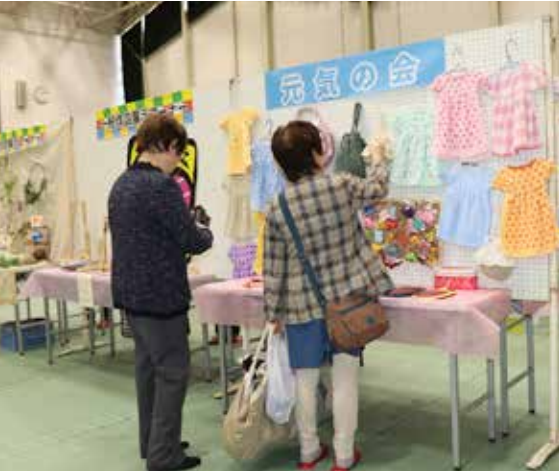
社会体育館には、多種多様な作品が展示されました