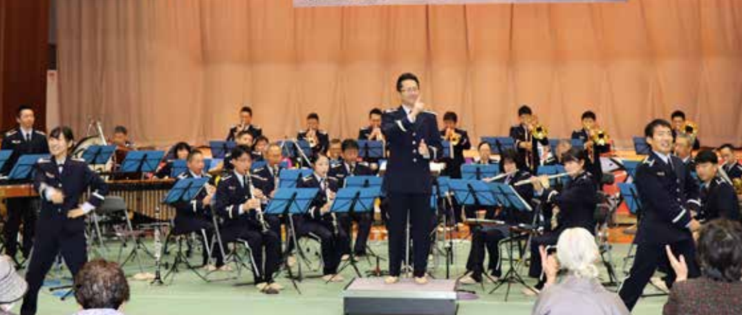
航空自衛隊北部航空音楽隊の演奏に、多くの観客が魅了されました