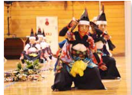
勇壮な鴉鳥七頭舞を披露