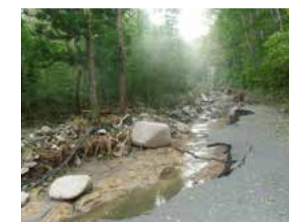
道路被害が多発しました