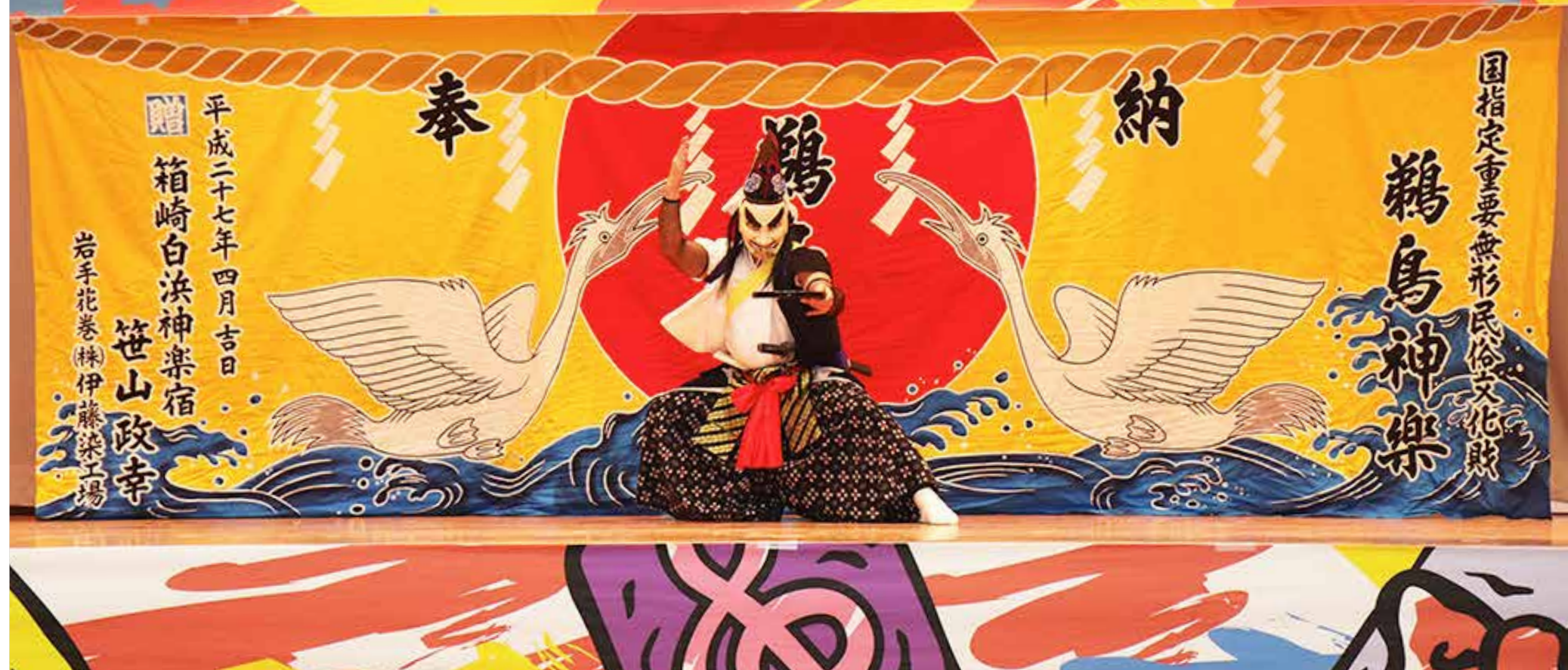
勇壮に舞う鶴鳥神楽の演目「清祇」

台風19号による災害の影響で、開催が危ぶまれた今年の文化祭。そのような中「復興支援普代村文化祭」として、多くの皆さんからご支援とご協力をいただき、開催することができました。