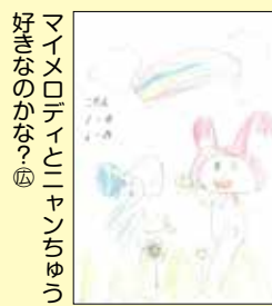
好きなのがなっ⑤ 大マイメロディ・ニヤンちびっ⑤