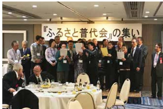
ふるさとに思いを馳せながら、普代中の校歌を歌う皆さん

まつりの様子をまとめた映像上映や村漁協、村商工会から提供を受けた景品が当たる福引き抽選会が行われたほか、普代中学校の校歌も歌われ、大いに盛り上がりました。