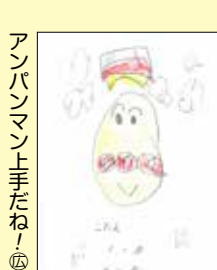
アンパンマン上手だね⑥