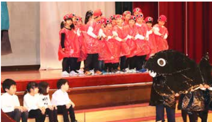
小学校1・2年生の劇「スイミー〜ちいさなかしていさかなのはなし〜」