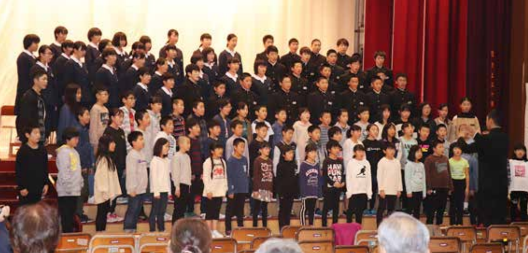
高い歌唱力を披露した小中合同合唱「この星に生まれて」