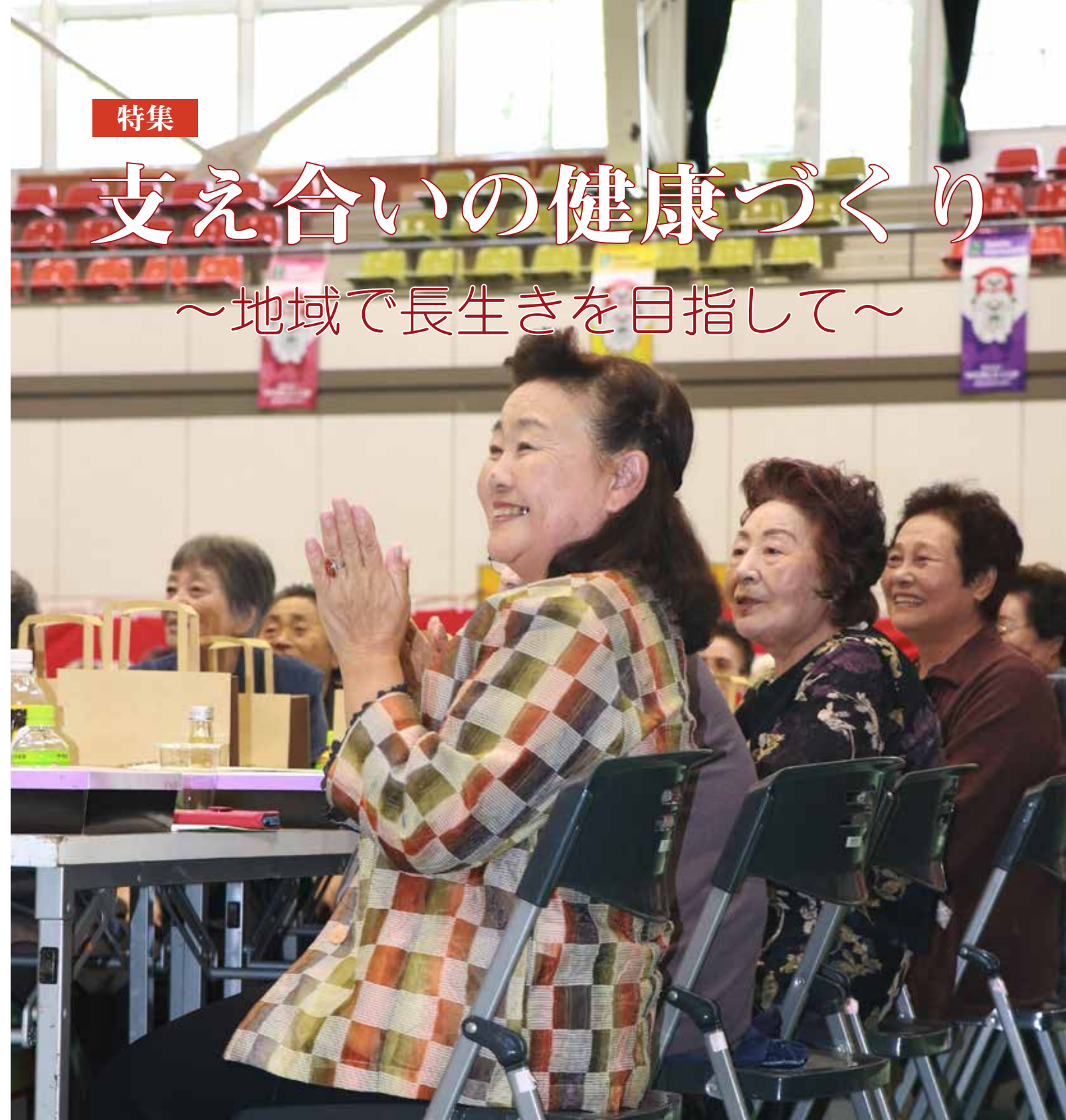
9月20日に開催した令和元年度村敬老会の様子

住み慣れた地域や自宅ですまでも元気に暮らしたい。高齢者の皆さんの願いではないでしょうか。そのためには、自分自身の健康や家族の支え合いや助け合いが必要不可欠です。 村の65歳以上人口は10月末現在で1086人(男467人、女619人)。高齢化率は41・21%となっています。なお、国立社会保障・人口問題研究所によると、2040年には、村の高齢化率が50%に達すると推測されていて、高齢者世帯も増えることが予想されます。