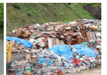
山積みになった災害ごみ