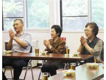
持ち寄ったお菓子で一休み