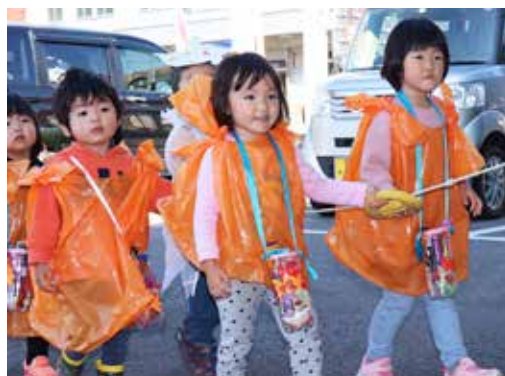
お菓子をもらいながら商店街を歩く園児たち