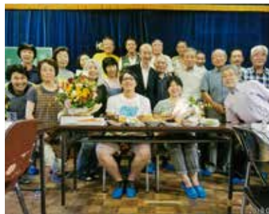
これからもよろしくお願いします