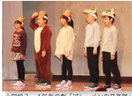
小学校3・4年生の劇「プレーメンの音楽隊」