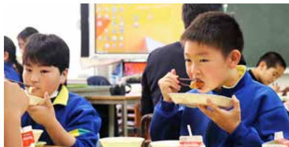
サケのアーモンドフライを美味しく口に頬張る児童たち

11月11日の鮭の日に合わせ、学校給食メニューに秋サケを取り入れた「鮭の日学校給食」が提供されました。