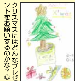
クリスマスにはどんなプレゼントをお願ひするのかなっ⑥