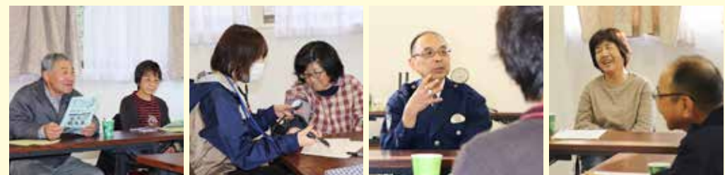
11月6日に堀内机地区で行った秋・冬健康教室の様子。栄養指導や免許返納の講話などを行いました

春、夏、秋・冬の3回に分け、各時期に全13行政区の公民館などで健康教室を開催しています。この健康教室は、地域の仲間同士の交流や生きがいづくりの機会を持つこと、認知症予防に自ら取り組む地域を支援することを目的に、村保健センターと連携して取り組んでいる事業です。今年度はクラフトものづくりや体操脳トレ、各種講話などを行っています。