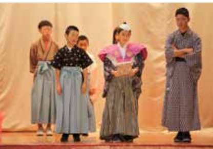
小学校5・6年生の劇「まぬけ村物語」