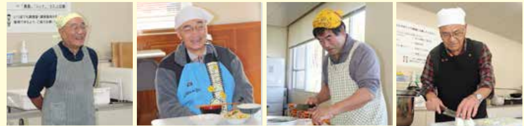
11月12日に開催された料理教室の様子。この日はサバの味噌煮や白菜の和え物などを作りました

高齢男性の介護予防の一環として、生活習慣病や認知症の予防や自宅から外に出て仲間との交流を持つことにより、健康づくりへの関心を高めてもらうために行っている事業です。栄養士の指導を受けながら、栄養バランスが良くて簡単な料理をみんなで作る料理教室です。