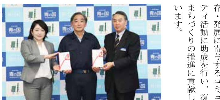
今後も郷土芸能の継承を通じた地域活性化に努めます

アサヒホールディングス株式会社は、東日本大震災で被災した市町村の郷土芸能の保存・発展に寄与するコミュニティ活動に助成を行い、復興まちづくりの推進に貢献しています。