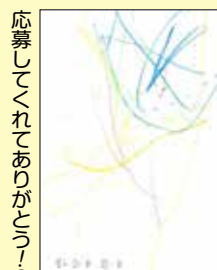
応募してくれてありがとう⑥