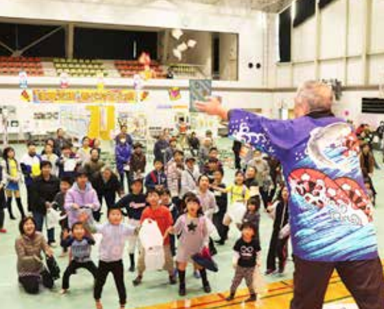
夢中にお餅とお菓子を拾う来場者の皆さん