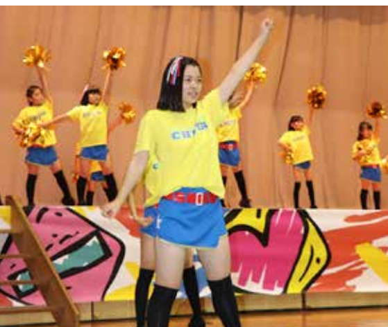
チアダンスチーム Shiny's は元気いっぱいのダンスを披露