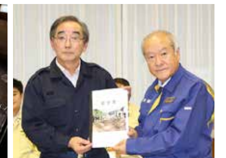
鈴木俊一衆議院議員が被害調査に来村