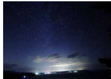
星空が大好きな黒崎展望台

とりひとりの大切さが目に見えて分かる。この村では、お互いを思いやる気持ちはそのままに、個人が自立し、輝きを発揮できる場所であって欲しいと願っています。