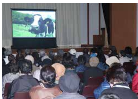
映画「山懐に抱かれて」には多くの人が来場