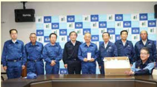
矢巾町議会から温かい支援金などをいただきました

台風19号で大きな被害が出た村には、発災以後、多くの義援金や支援金が寄せられており、10月末現在で68件、7,462,672円となっています。皆様からの温かいご支援に心から感謝申し上げます。一日でも早い復旧・復興に資するよう各事業に活用させていただきます。義援金、支援金をいただいた皆さんは次の通りです。ご芳名のみのご紹介になることをご了承願います。