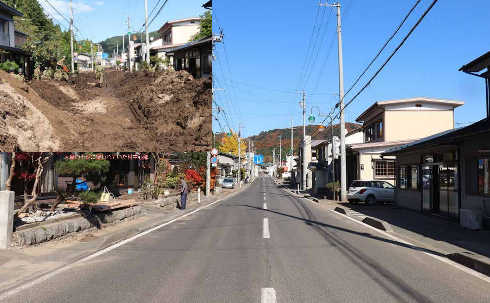
大量の土砂に覆われていた村中心部