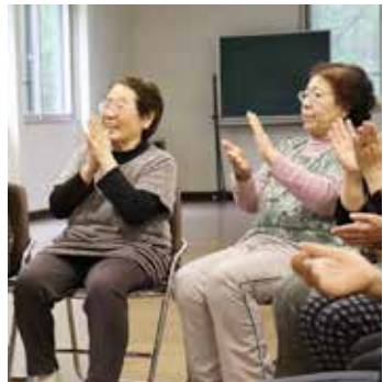
会場を盛り上げる皆さん