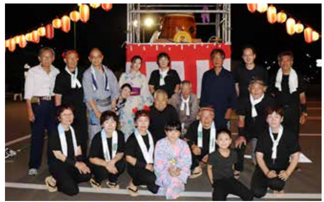
盆踊り保存会の皆さんとその関係者ら