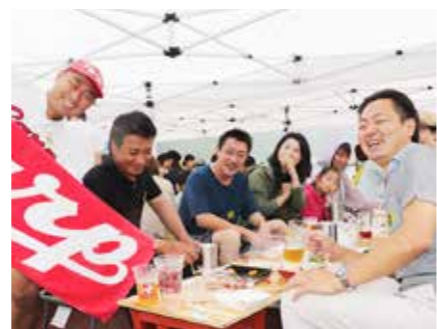
ビール片手に盛り上がる参加者

ベアレンビールフェストinふだい2019(株式会社社ベアレン醸造所主催)が8月11日、普代浜園地キラウ