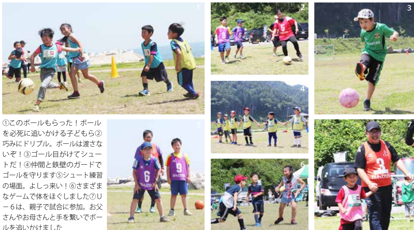
①このボールもらった！ボールを必死に追いかける子どもら②巧みにドリブル。ボールは渡さないぞ！③ゴール目がけてシュートだ！④仲間と鉄壁のガードでゴールを守ります⑤シュート練習の場面。よしっ来い！⑥さまざまなゲームで体をほぐしました⑦U-6は、親子で試合に参加。お父さんやお母さんと手を繋いでボールを追いかけてました