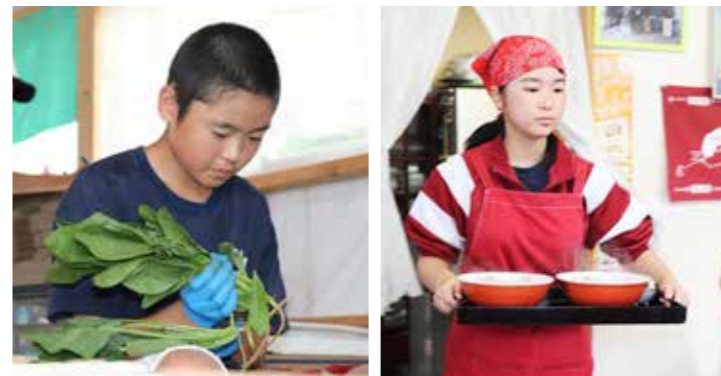
ほうれん草の根を丁寧に切りました お客様のところへ慎重に運びます

ミを会場に行われ、村内外から約100人が来場しました。当日は、あいにくの小雨模様でしたが、午前11時から4時間の飲み放題がスタート。参加者らは用意された5種類のビールをかわるがわる味わうとともに、特設のフードコーナーに出店した村内の飲食店や商店からお目当てのつまみを買って、仲間との会話を弾ませていました。