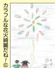
カラフルな花火綺麗だね！ 滝澤ひびきくん (久慈市・8歳)