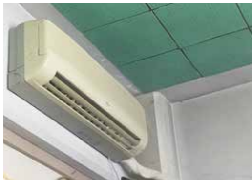
エアコンを設置して快適になりました