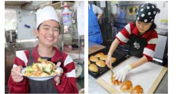
生たれ肉炒め完成! パン作りに挑戦

普代中学校(瀬川勝司校長、生徒50人)の2年生12人は7月17日、18日の両日、村内の公共施設や各事業所で職場体験学習「GOOD JOB(グッドジョブ)」を行いました。訪問したのは、図書室やはまゆり子ども園などの公共施設や飲食店、商店、水産加工場、