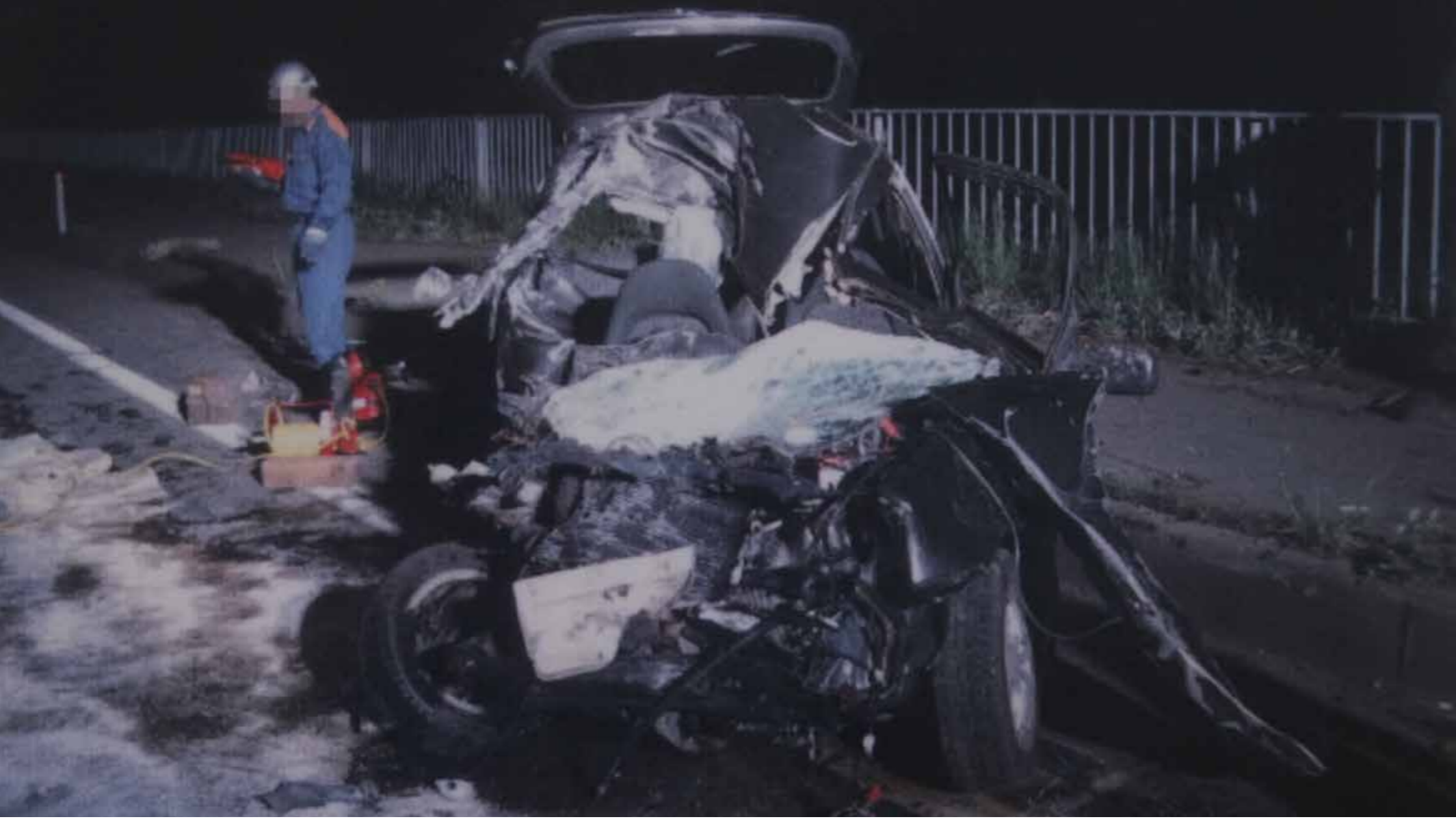
飲酒運転による死亡事故率（死亡事故件数÷交通事故件数×100%）は5.9%で、飲酒なしと比べ、約8.3倍に及びます。飲酒運転による交通事故は、悲惨な現場が多いです。（久慈警察署内事故パネルより）

村の飲酒運転検挙率は県内ワースト（悪い方から）2位。今一度、飲酒運転について考えてみましょう。