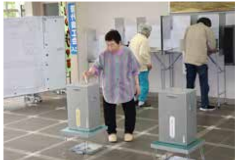
大切な1票を投じる有権者（役場村民ホール）

第25回参議院議員の通常選挙が7月21日に行われ、村の投票率は岩手県選出議員が64・05%、比例代表選出議員が64・01%で、平成28年7月10日に行われた前回同選挙と比べ、岩手県選出議員は4・22ポイント、比例代表選出議員は4・26ポイント下回りました。 地区別投票率は、茂市が75・68%でトップ、続いて萩牛の75・00%、黒崎の71・67%となっています。 県内の投票率は56・55%で前回同選挙を1・23ポイント下回りました。 投票結果は、左表1、比例代表での党派別得票数は左表2のとおりです。