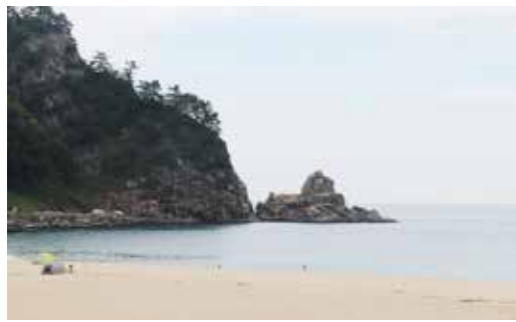
普代にも夏が到来！（写真はキラウミの砂浜）

8月に入りとても暑い日が続いていますね。みなさんは体調崩していませんか？思えば私が普代村で初めて過ごした夏はとても過ごしやすかったです。北の夏はこんなに過ごしやすいのかと驚きましたが、その年によって違うものですね。私が子供のころは30℃を超えることはめったになく、驚くべきことでした。年々暑さが増えているからこそ暑らす環境を整えなくてはと思っています。