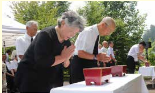
犠牲者の冥福を祈る参列者

村戦没者追悼式が8月5日、旭日区の村英霊塔の前で行われ、式に参列した遺族や子ども園の園児などが不戦と平和を誓いました。