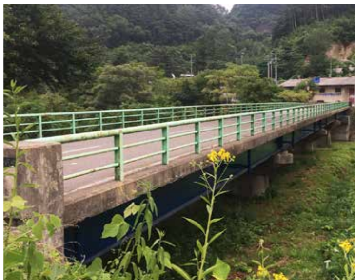
まもなく工事が始まる普代橋

村内にある橋は、多くが高度経済成長期から80年代に作られ、全体的に橋の老朽化が進んでいます。橋を安全に利用し、道路交通の安全性を高めるため、村では「普代村橋梁寿命延長修繕計画」により計画的に修繕などをして、維持管理を進めていきます。