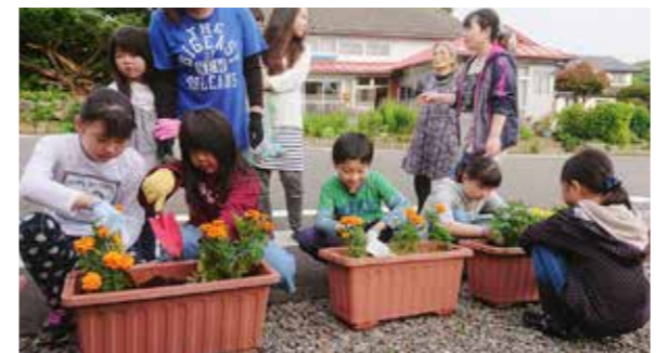
色とりどりの花を丁寧に手植えました

黒崎地区で7月14日、地区の清掃活動に合わせて花植えを実施しました。この日は早朝から黒崎地区の子ども会メンバーやその保護者ら約20人が集まり、サルビアやマリーゴールドの苗を植栽しました。子どもたちは大人に教えもらいながら作業し「こんな感じかな」