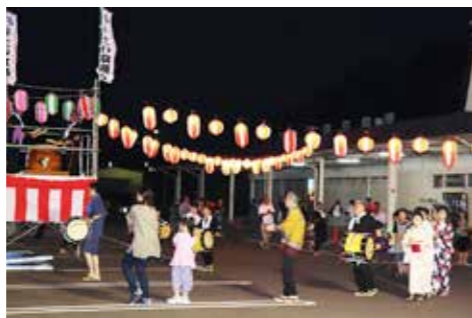
復活したお盆の風物詩 盆踊り大会

だが、様々な技術を持つ方が身近にいることはとてもありがたいことです。これからお祭りなどイベントも続くので夏を満喫しましょう！