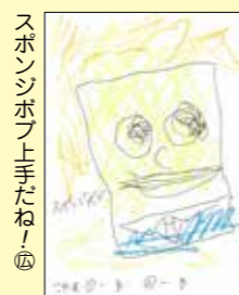
スポンジポップ上手だね！ 大坪楓くん (久慈市・3歳)