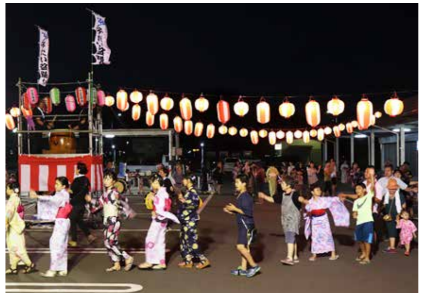
勇壮な太鼓の音に合わせて踊る参加者

ふだい盆踊り大会（ふだい盆踊り保存会主催）が8月15日、普代駅前駐車場を会場に行われ、子どもたちやふるさとに帰省した人など村内外から約300人が参加しました。 約20年ぶりに復活したお盆の盆踊り。心配されていた天候にも恵まれ、午後6時を過ぎると、続々と浴衣や甚平を着用した人が集まり始めました。歌や太鼓の音が鳴り響く中、次から次へとやぐらの回りに列をなし、老若男女が踊りを楽しみました。