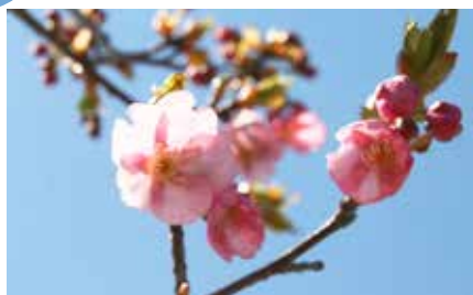
今年最も早く開花した黒崎展望台の河津桜