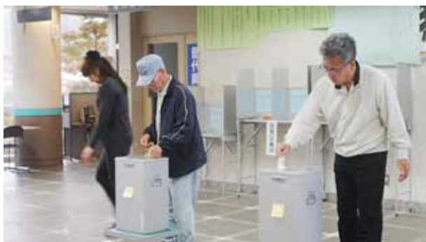
大切な一票を投じる有権者の皆さん

普代村長及び村議会議員選挙の投票日が近づいています。本選挙の日程は、6月11日(火)告示、6月16日(日)投開票です。投票は、下表の10カ所の投票所で、時間は午前7時から午後6時までです。18歳以上の村民一人一人の一票が村の未来を担います。棄権せずに投票しましょう！