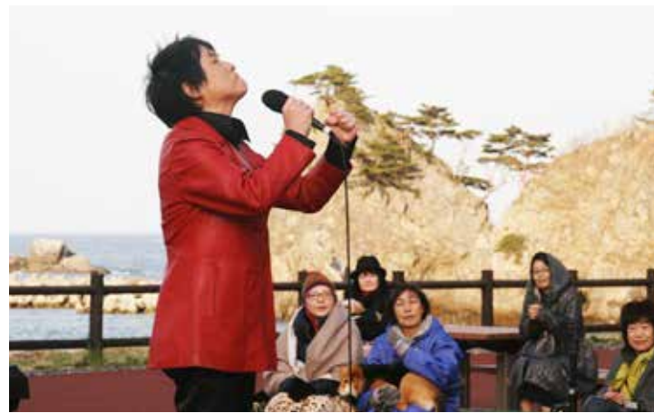
海辺のステージで熱唱する宇佐元観光大使

今年度の養殖ワカメ漁の水揚げ量は509トでした。平成30年の水揚げ量3240トと比べると、2731トの減となり、昨年の水揚げ量を大きく下回る不作となりました。早いところ