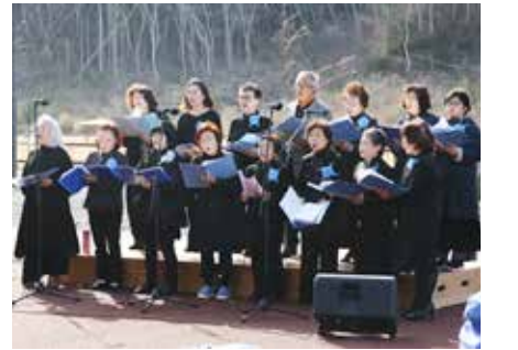
美しい歌声が海辺に響き渡りました

「華のまち・普代村」プロジェクトとして、「河津桜開花記念事業」キラウミ音楽フェスティバル」が4月20日、普代浜園地で開催されました。