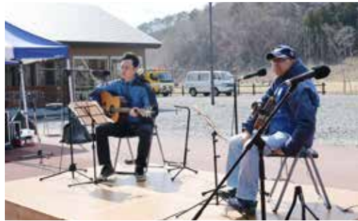
the meat & policeのメンバー

4月22日に山菜採りプチツアーを行いました。初めての試みでしたが、村内外からご参加いただき無事に終えることができました。「山菜」は内陸出身の私にとって珍しいものではありませんが、自分で採って食べるという流れはとても素晴らしい体験でした。ガイドさんからどういった状態が食べごろなのかや毒を持つた似ている食物との違いを教えてください、下処理の後、調理をして美味しくいただきました。