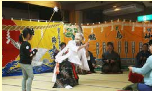
会場が大きな拍手に包まれた恵比寿舞の一場面

鶺鴒神楽定期公演「神楽の日～青の国編～」が4月21日、国民宿舎くろさき荘で行われ、約60人が伝統の舞を堪能しました。午前の公演では、舞処を清める「岩戸開」から始まり、4演目を披露。午後からは「鞍馬」などが披露され、会場が一体となった舞に、大きな拍手が送られました。今年度、残りの定期公演は、6月23日、9月15日、11月17日。皆さんも神楽の魅力に触れ、楽しいひと時を過ごしてみたいか。問い合わせは、村観光協会(0194-35-2114)まで。観客は神楽の魅力に魅了されました