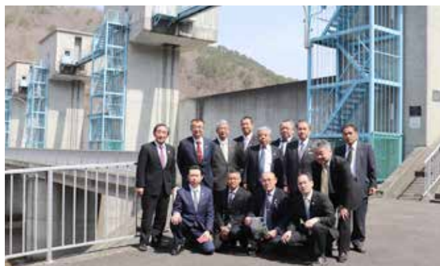
津波から村民を守った普代水門を視察しました

◆議会事務局・政策推進室から 「華のまち」絆深める 静岡県河津町議会議員の方々が4月22、23日の両日、村で視察研修を行いました。今回の視察研修は、平成28年度から村内9カ所に植樹した河津桜の苗木を、河津町から譲り受けたことがきっかけで実施。東日本大震災からの復興やそれを教訓とした防災の状況を視察しました。 研修では、村内9カ所の植樹場所へ、今年最も早い4月13日に開花した黒崎展望台の河津桜を見学した後、太田名部防潮堤や普代水門、普代浜園地を視察しました。