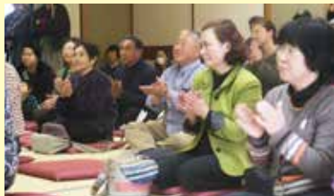
観客は神楽の魅力に魅了されました

鶺鴒神楽定期公演「神楽の日～青の国編～」が4月21日、国民宿舎くろさき荘で行われ、約60人が伝統の舞を堪能しました。午前の公演では、舞処を清める「岩戸開」から始まり、4演目を披露。午後からは「鞍馬」などが披露され、会場が一体となった舞に、大きな拍手が送られました。今年度、残りの定期公演は、6月23日、9月15日、11月17日。皆さんも神楽の魅力に触れ、楽しいひと時を過ごしてみたいか。問い合わせは、村観光協会(0194-35-2114)まで。観客は神楽の魅力に魅了されました