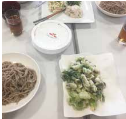
天ぷらなどにして美味しくいただきました