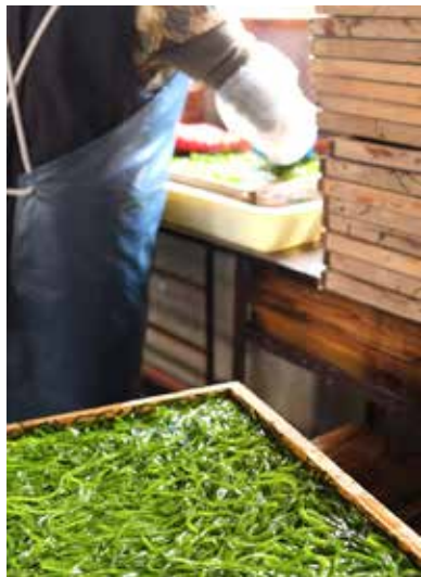
村特産のすき昆布づくりも盛んです

今年度の養殖ワカメ漁の水揚げ量は509トでした。平成30年の水揚げ量3240トと比べると、2731トの減となり、昨年の水揚げ量を大きく下回る不作となりました。早いところ