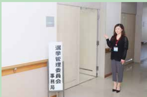
役場2階小会議室の選管事務局で簡単に投票できます！