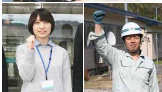
若い職員が頑張っています！やる気のある職員求む！