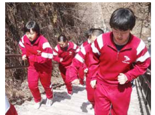
避難階段を駆け上がる普代中の生徒

訓練は「午前11時ごろ、巨大地震が発生し、大津波警報が発令」との想定で実施。揺れが収まり、それぞれの校内で、大津波警報発令の放送が流れると、教職員の指示に従い、高さ約16メートルの避難場所を目指し、息を切らしながら108段の階段を駆け上がり、中学生は3分43秒、小学生は6分49秒で、昨年より早く避難を終えました。