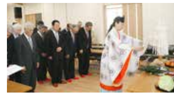
大ホールで行われた竣工式