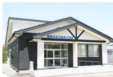
完成した黒崎地域活動拠点施設

が5月8日に、同施設の大ホールで行われました。旧黒崎小学校校舎の跡地に建てられた同施設は、延べ床面積188.8平方メートルで、大ホールのほか、小会議室や調理室などが整備されています。また、屋外発電機用接続口が整備されており、停電時は接続口へ発電機を接続することでガスヒートポンプエアコン稼働させたり、非常用照明を点灯させることができ、避難所としての機能も十分に有し