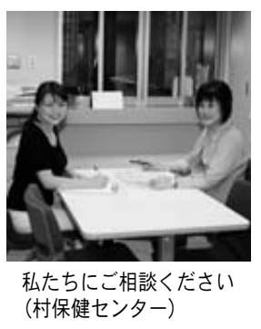
私たちに相談ください(村保健センター)

つづ病は早めの治療で約8割が治るといわれています。悩んだら話してください。悩んでいる人に気付いたら、声を掛けてあげてください。あなたの一言を待っている人がきこっています。