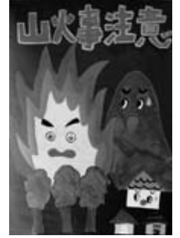
小学校高学年の部 優良賞