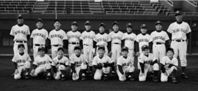
惜しくも優勝を逃したものの次の大会に闘志を燃やす堀内スポ少