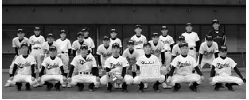
下閉伊北部予選で優勝し県大会へ出場する普代クラブ