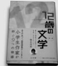
水野隆 企画・編集 あすなる書房