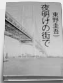
東野 圭吾 角川書店