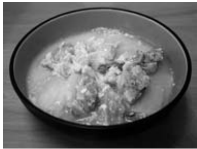
鶏肉と白菜の クリーム煮