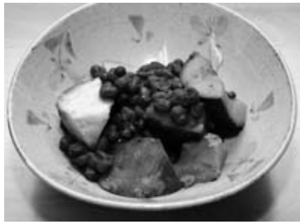
カボチャと小豆のいとこ煮