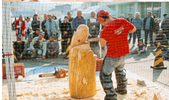
これぞまさしくプロの技。チェーンソーアートの実演

ーナー、太田名部物語原稿集のコーナーなどが人気を集めていました。駐車場では地場産品や矢中町の特産品の販売も行われたほか、初日の午後からはチェーンソーアートの実演が行われ、巧みなチェーン