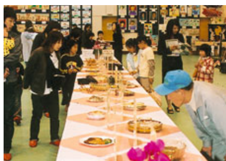
普代の特産品を使った料理がずらり