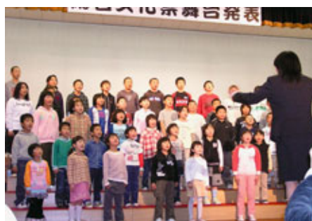
合唱や劇などが披露された舞台発表

ソーアートの実演 2日目の午前9時からは村内各小中学校などの吹奏楽の演奏や合唱、劇などが披露され、約150人の観客が盛んに拍手を送っていました。