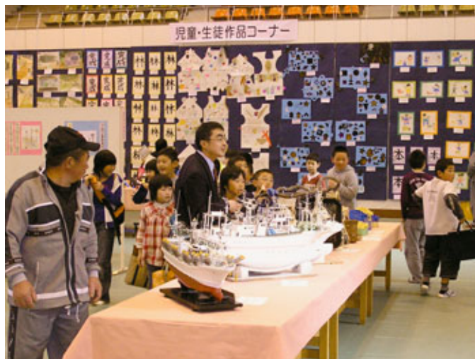
村民の力作が揃った展示部門