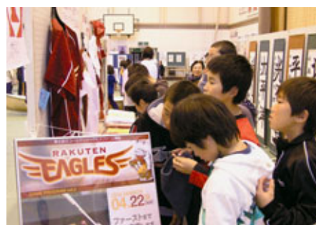
子どもたちに人気を集めた銀次コーナー