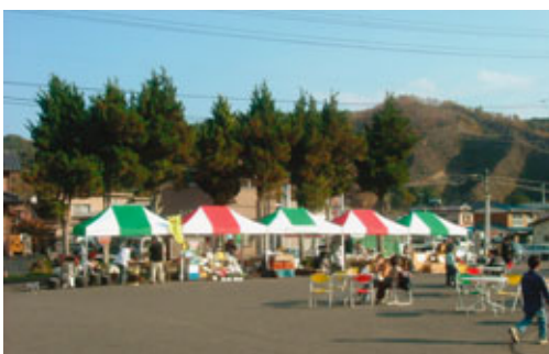
村総合文化祭で活用されたイベントテント