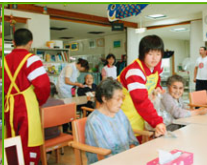
デイサービスセンター