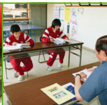
久慈消防署普代分署