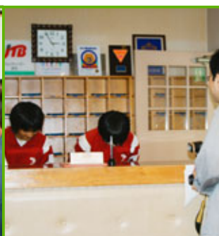
国民宿舎くろさき荘