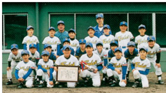
県大会の切符は逃したものの準優勝と頑張った普代スポ少