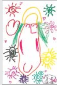
上方 こももちゃん (堀内・4歳)