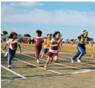
青空の下、子どもたちは元気に走ります