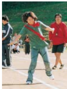
“目が回る”ゴールはどっち?