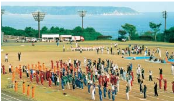
海が見えるグラウンドでしっかり準備運動