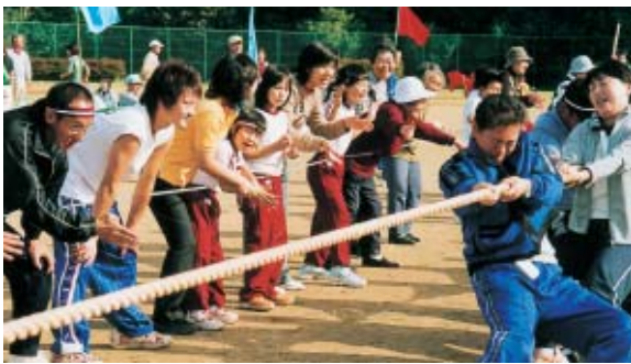
大声援でとりもチームは「綱引き」3位と大健闘