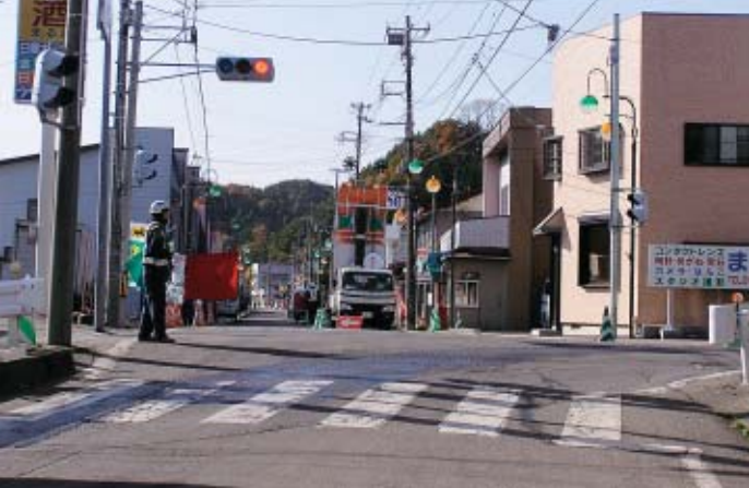
工事が進む普代郵便局前の交差点