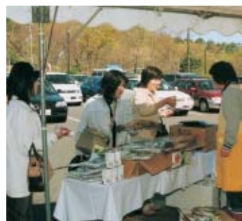
品定めをする首都圏からの宿泊客

玄関前では、イカやホタテが焼かれ、香ばしい匂いが漂う中、首都圏から来たお客さんは、すき昆布や塩蔵ワカメ、いくらなど一品一品品定めをしながら買っていました。