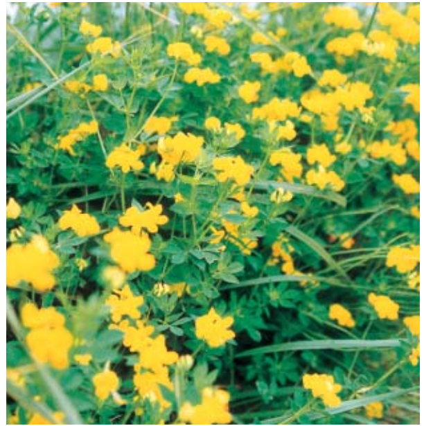
ミヤコグサ (まめ科)

5月普代村では、日当たりのよい海岸、道端にミヤコグサが、鮮やかな黄色をよそおって賑々しく咲く。特に黒崎から明戸の方向に車を走らせると、なんとミヤコグサが多いことか、連続して咲いていて、コガネを敷き詰めたようだ。