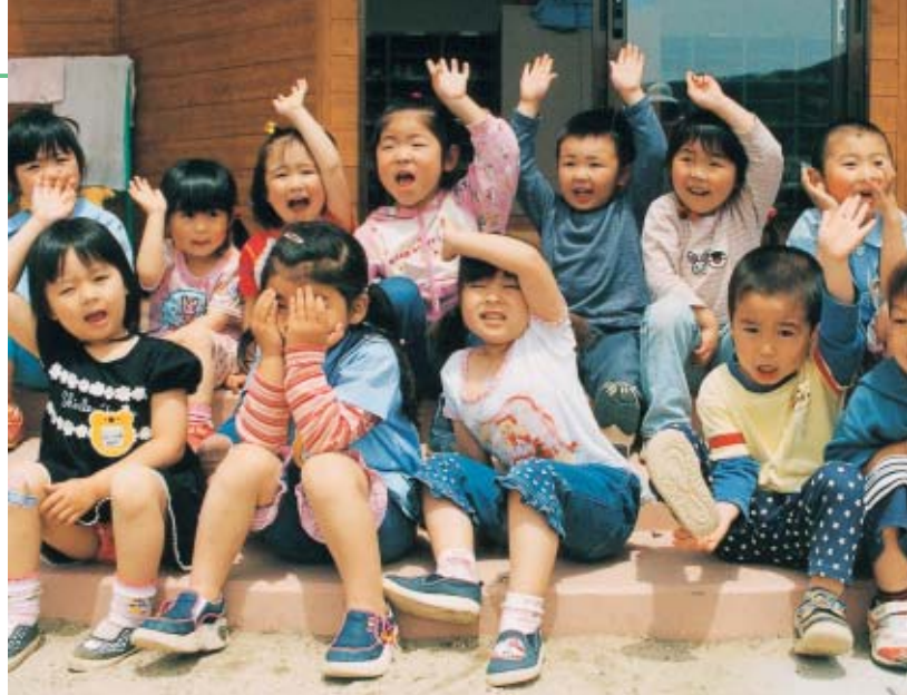
明日を担う子どもたちのためにも、自立の村づくりを推進します