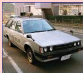
トヨタ コロナバン